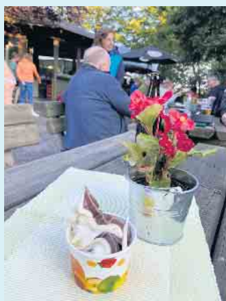
Neues, leckeres Softeis im Biergarten beim Gasthof Schöttes

des. Nach einer langen Biketour kann man im Biergarten mit Rondell direkt neben dem Gasthof bei gutem Wetter den Tag in gemütlicher Runde ausklingen lassen. Bei schlechtem Wetter natürlich auch in der Wirtsstube. Alle Speisen können einen Tag zuvor auf Bestellung gerne auch für zu Hause abgeholt werden. Vorbeischaun lohnt sich immer. [BL]