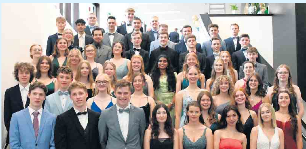
51 Schülerinnen und Schüler bekamen feierlich ihr Abiturzeugnis übergeben.

Im Anschluss an die offizielle Feier fand bis in die frühen Morgenstunden der Abiball in der Schützenhalle in Züschen statt.