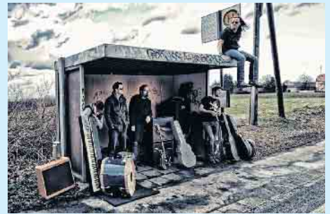
Der Name ist Programm: Am 7. August wird es rockig im Aktiv- und Vitalpark Winterberg mit der Band »RockaholiX«.

Alle Infos zur Konzert-Reihe gibt es auch im Internet unter www.winterberg.de/sparkassenopenair !