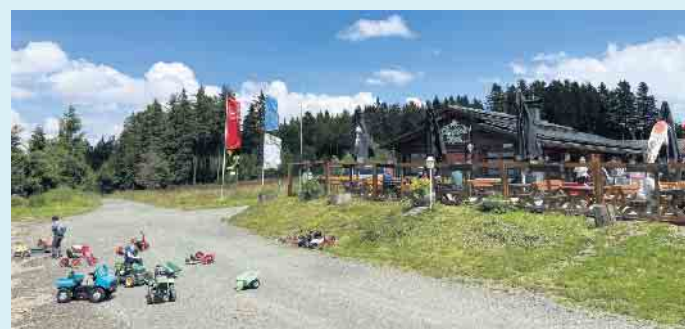
Die Hochheide Hütte mit Bobbycar-Fuhrpark für die kleinen Gäste