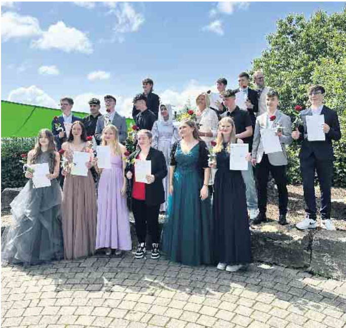
Klasse 10 E