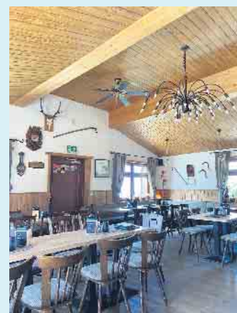
Die gemütlichen inneren Räumlichkeiten der Hochheide Hütte

der Hochheide Hütte geladen werden. Für BOSCH-Motoren sind Ladegeräte vorhanden. Seitlich an der Hütte befindet sich auch ein hochwertiges Reparatur-Kit mit diverser Werkzeug. Neben der Hütte liefert ein Getränkeautomat jederzeit zusätzlich für Wanderer und Mountainbiker Kaltgetränke „to go“. Neu seit dieser Saison sind die Pizza-Snacks in den Variationen Margerita, Salami und Schinken. Kulinarisches Highlight ist der „Pulled Pork Burger“, bestückt mit Röstzwiebeln und Gewürzgurken. Auf der Speisekarte finden sich aber auch weitere saisonale Tagesgerichte.