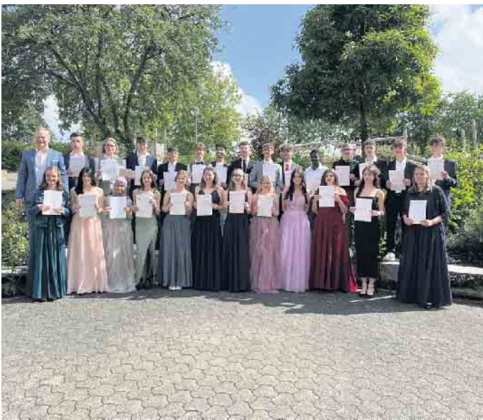
Klasse 10 B

Alle sprachen ihre Gratulationen zu den guten Abschlüssen aus: Von den 95 Schülerinnen und Schülern, die die Sekundarschule mit einem Abschlusszeugnis verlassen, erhalten 58 Schülerinnen und Schüler einen Mittleren Schulabschluss, davon 28 Schülerinnen und Schüler sogar mit Qualifikation zum Besuch der gymnasialen Oberstufe. Außerdem wurden 33 Erste Erweiterte Schulabschlüsse nach Klasse 10, zwei Erste Schulabschlüsse nach Klasse 9 sowie zwei Förderschulabschlüsse im Bildungsgang Lernen vergeben. Ein besonderes Lob mit einem extra Applaus sowie einem kleinen Präsent durch den Förder-