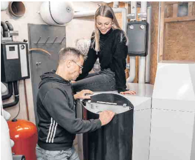
In die Zukunft investieren: Mit bis zu 23.500 Euro wird der Einbau einer neuen Holzheizungsanlage auf Basis erneuerbarer Energien staatlich gefördert. Zusätzlich gewährt die KfW-Bank einen zinsgünstigen Ergänzungskredit.

Aktuell erleichtern verbesserte Förderbedingungen den Umstieg auf klimafreundliche Heizungsanlagen mit Holz. Hauseigentümer sind gut beraten, den Wechsel auf ein Pelletsystem als eine Versicherung für die Zukunft zu verstehen. Denn Experten sind sich einig: Die Preisentwicklung bei fossilen Brennstoffen wird langfristig nur einen Weg kennen - nach oben. Wer dem nicht hilflos ausgeliefert sein möchte, sollte sich vom alten Heizsystem verabschieden. Dabei helfen üppige staatliche Förderungen und zinsgünstige Darlehen. Bis zu 70 Prozent der Einbaukosten für eine neue Heizungsanlage auf Basis von erneuerbaren Energien wie beispielsweise Holz übernimmt der Staat. Plus Zusatzbonus für besonders staubarme Pellet- und Hackschnitzel-Zentralheizungen oder wasserführende Pelletka-