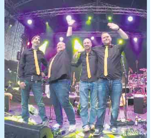
»Die Goldenen Reiter« bringen zum Festival-Auftakt die Neue Deutsche Welle ins Sauerland.

Den Startschuss der „Sparkassen Open Air“-Konzerte geben „Die Goldenen Reiter“. Nach unzähligen Auftritten bei Partys, Stadtfeiern und Events zäumen „Die Goldenen Reiter“ die NEUE DEUTSCHE WELLE weiter konsequent von hinten auf: Die Stromgitarren bleiben im Stall und die Pferde werden mit akustischen Gitarren, Ukulele, Akkordeon, Bass und Cajon im Gepäck gesattelt, weil die Menschen es auch nach all den Jahren so wollen! NDW is back, obwohl sie nie wirklich weg war. Nach wie vor wird kein Klischee ausgelassen, bleibt kein NDW-Hit ungewürdigt und kein Auge trocken, wenn die Reiter durch nie vergessene musikalische Partylandschaften reiten. Kurzum: „Die Goldenen Reiter“ geben Gas und machen Spaß, stehen auf blaue Augen und Berlin, haben heute nur von Euch geträumt, drehen sich nicht nach dem Kommissar um und su-