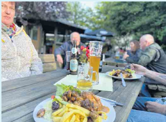
Leckeres Grillbuffet im Biergarten vom Gasthof Schöttes