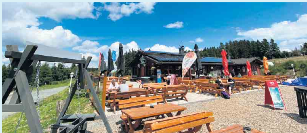
Die Hochheide Hütte in schöner Lage am Rothaarsteig

Der Gottesdienst wird in diesem Jahr ebenfalls direkt an der Hütte, ab 13.30 Uhr abgehalten. Geplant sind an diesem Tag kleine Rundfahrten mit der Pferdekutsche von der Wilkemühle aus Usseln, ebenfalls mit Start und Ankunft bei der Hochheide Hütte. Die Rollende Waldschule wird ebenfalls vor Ort sein und der Hundesportverein aus Olsberg zeigt einen Einblick in die Welt der Hunde mit Vorträgen über Hundetraining. Die Alphornbläser aus Winterberg sorgen an diesem Tag für die musikalische Unterhaltung. Bei guten Wetter wird auch eine Hüpfburg für die kleinen Gäste aufgestellt.