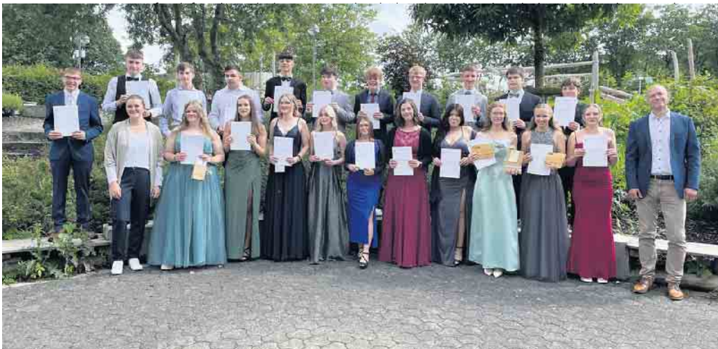
Klasse 10 A

Sekundarschule Medebach-Winterberg verabschiedet 95 Schülerinnen und Schüler