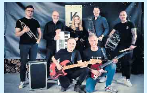
Zum Finale des „Sparkassen Open Air“-Festivals spielt „kraftstoff“ am 14. August groß auf.

Eine Woche später, am 7. August, wird „RockaholiX“ für gute Laune und Musik an der Musikmuschel sorgen. Der Name ist Programm: Die Festival-Fans dürfen sich auf Melodien aus einer Zeit freuen, in der Musik noch handgemacht, ungemastet und schmutzig war. Von rockig geladen bis akustisch-verspielt werden Liebhäberrstücke und Klassiker zu Herz und Ohr gebracht. Die fünf Musiker stehen für Klassiker der Rockge-