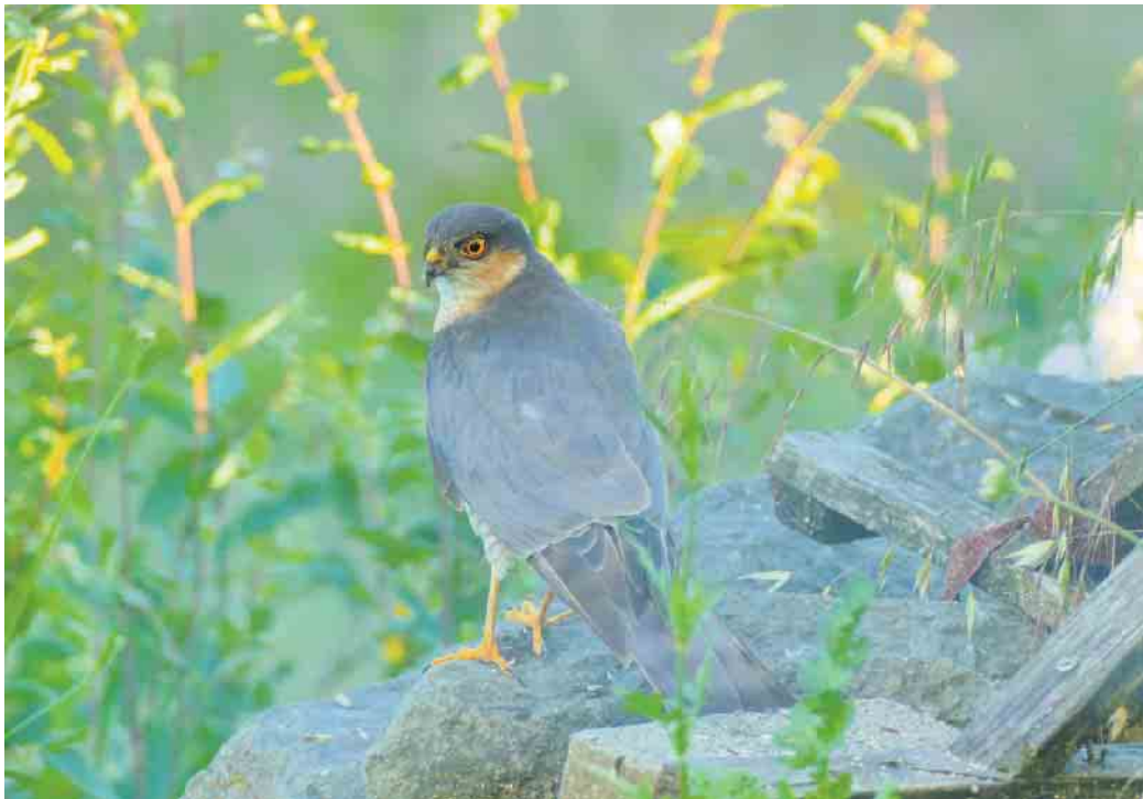
Sperber im Halletal in der Abendsonne.

Der Angriffskrieg in der Ukraine dauert nun schon fast zweieinhalb Jahre und ein Ende ist nicht abzusehen. Seit dieser Zeit leben viele Menschen, die aus den Kriegsgebieten flüchten mussten, in unserer Region. Das Bildungs- und Exerzitienhaus St. Bonifatius und der Förderverein laden alle UkrainerInnen aus Hallenberg, Medebach, Olsberg und Winterberg und ihre Begleitung zu einem Nachmittag der Begegnung am Sonntag, 11. August, um 14 Uhr, nach St. Bonifatius in Elkeringhamen ein. Für Kinder und Erwachsene stehen Tanz, Theater, Singen, Kreatives, Spiele für Kinder und Erwachsene und vieles mehr auf dem Programm. Außerdem wird informiert über die bisherige Ukrainehilfe. Zu essen gibt es Köstlichkeiten aus der Ukraine, Waffeln und Würstchen. Allen ein herzliches Willkommen!