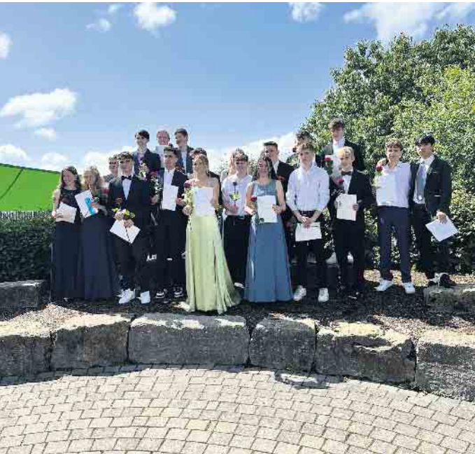
Klasse 10 D

ihre Kinder auf ihrem Weg mit viel Liebe und Unterstützung begleitet haben. Die Schülerinnen und Schüler der einzelnen Klassen sowie die Schülervvertretung bereicherten das Programm durch Präsentationen, die Erinnerungen, Ereignisse und Situationen in ihrer Zeit an der Sekundarschule zeigten. So endete eine abwechslungsreiche und kurzweilige Entlassfeier an beiden Standorten der Sekundarschule Medebach-Winterberg.