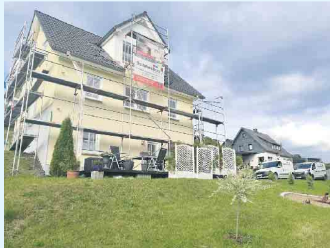
Fassadenarbeiten vom Malerbetrieb Schnorbus