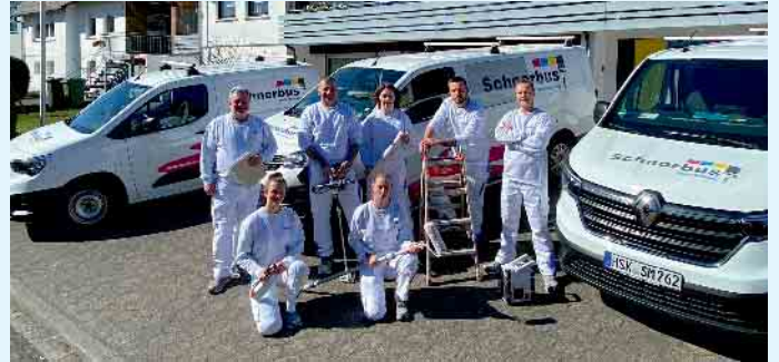
Das junge, dynamische Team vom Malerbetrieb Schnorbus aus Züschchen

Der Malerbetrieb Schnorbus aus Züschchen verwendet stets hochwertige Materialien von namhaften Herstellern, wie z.B. Herbol oder Sikkens. Individualität sowie Ausdruckstärke