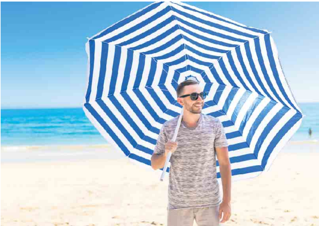
Handelsübliche Sonnenschirme lassen noch etwa die Hälfte der Sonnenstrahlen durch. Deshalb sollte man auch im Schatten Sonnenschutz auftragen.

Vor allem im Internet gibt es immer wieder Hinweise, dass Kokosöl einen natürlichen Schutz vor UV-Strahlen bietet. „Tatsächlich haben Forscher herausgefunden,