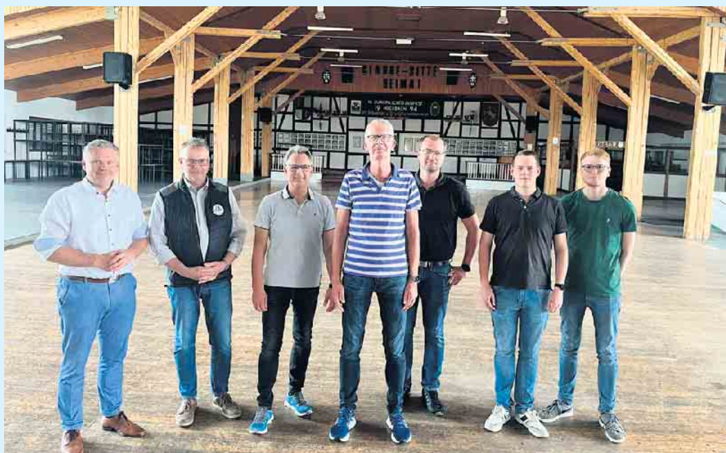
Bürgermeister der Hansestadt Medebach mit Vertretern der drei Vereine.

Im weiteren Verlauf der Planungen folgte jedoch die Ernüchterung: In enger Abstimmung mit der Stadt Medebach sowie nach Gesprächen mit der Bezirksregierung und Rücksprache mit der Landesregierung in Düsseldorf stellte sich heraus, dass die Städtebauförderrichtlinie NRW für dieses Projekt nicht anwendbar ist.