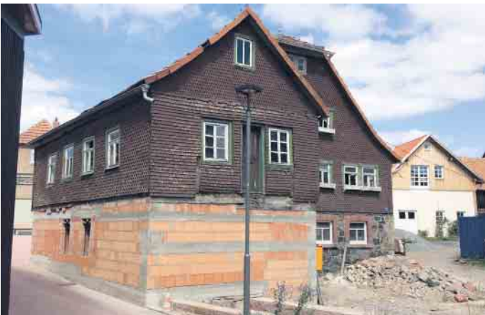
Bevor die Maler kamen, war die Mühle in einem traurigen Zustand.

standteil der Caparol-Firmenphilosophie. Mit der Initiative „Mal Dir Deine Zukunft aus!“ werden Berufseinsteiger oder frischgebackene Selbstständige - mit einem breiten Förderangebot unterstützt. Mehr unter www.caparol.de/nachwuchsfoerderung (akz-o)