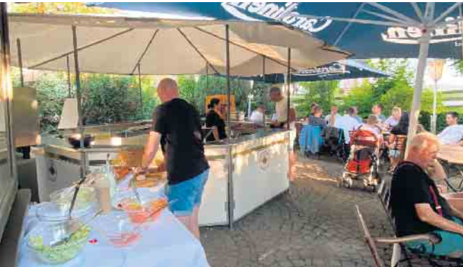
Lustiges Beisammensein im Biergarten vom Gasthof Schöttes