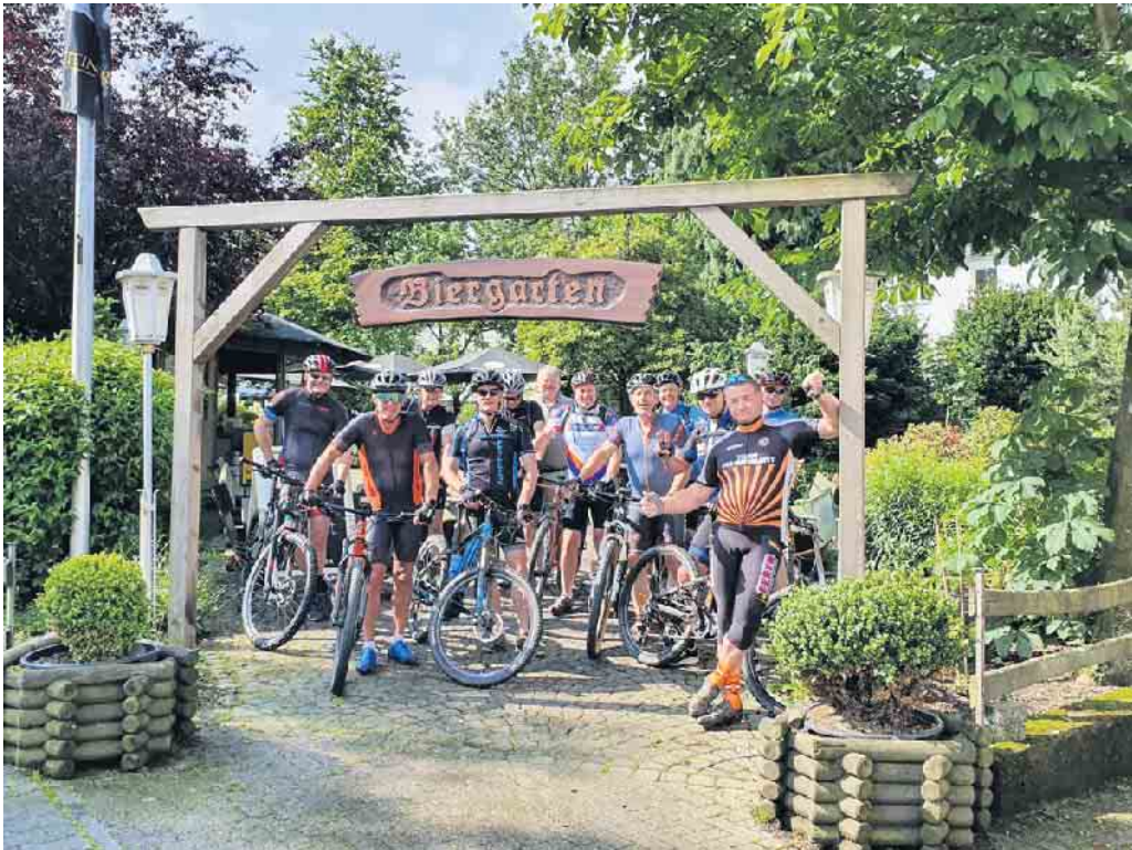
Biketruppe im Biergarten des Gasthof Schöttes