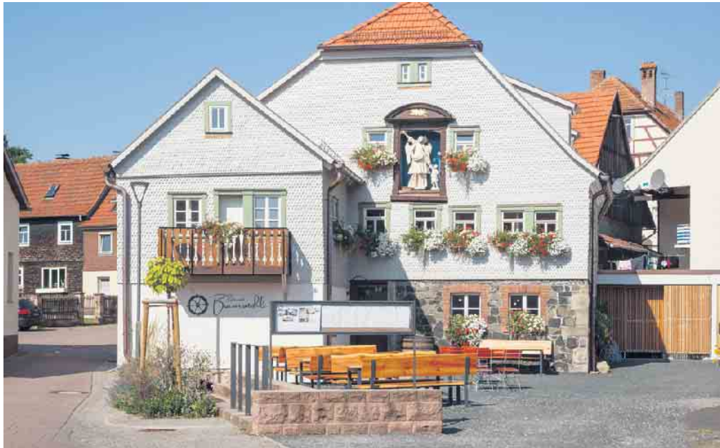
Wer die alte Mühle kannte, kommt aus dem Staunen nicht heraus.