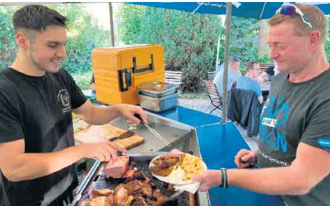
Leckeres vom Grill bei Schöttes