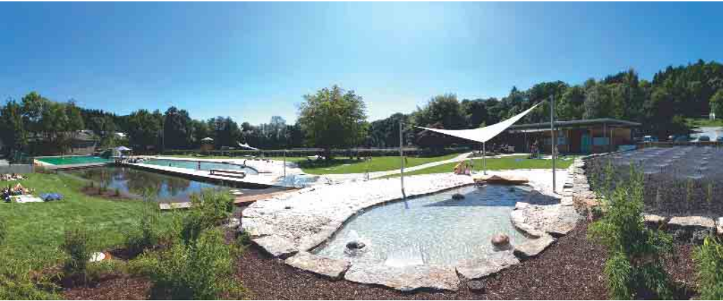
Naturbad Hallenberg.

Rahmen der Freizeitgestaltung bieten zu können. Das Hallenbad bleibt während der Naturbadsaison geschlossen, damit in dieser Zeit anstehende Reparatur- und Wartungsarbeiten durchgeführt werden können.