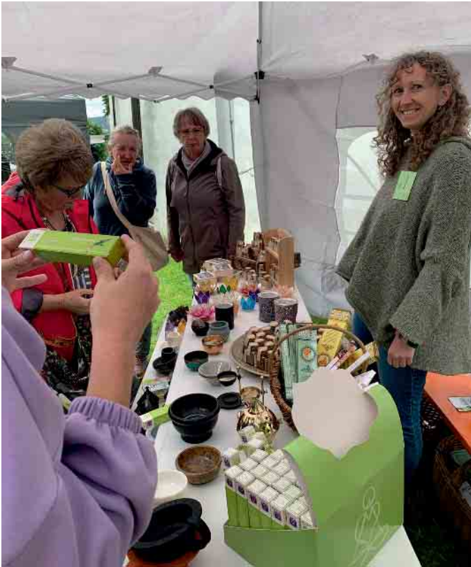
Marktstand mit Interessierten

schichte zurück und freut sich über die vielen Kräuterpädagogischen Schulungsabsolventen, die mit ihrer Begeisterung das Wissen der Wild- und Heilkräuter weitertragen. Die vielen Besucher waren nicht nur von den vielfältigen Ständen,