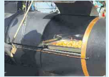
Gegrilltes aus dem Barbecue-Grill im Dampflok-Style