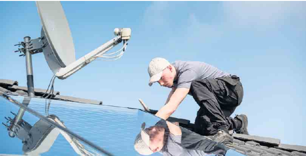
Eine ideale Kombination: Wer mit Solarthermie die Wärme der Sonne nutzt, um seine Pelletheizung oder einen wasserführenden Pelletkaminofen zu unterstützen, hat viel für das Klima getan - und kann sich zudem über dauerhaft niedrige Heizkosten freuen.

Durch die Wahl des Heizsystems hat jeder Eigenheimbesitzer die Möglichkeit, einen positiven Beitrag zur Klimawende zu leisten. Besonders gut gelingt das, wenn Solarthermie mit ei-