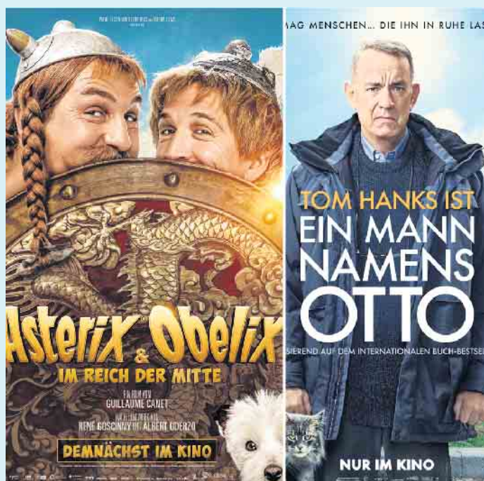
Das neue Open-Air-Kinoprogramm im Juli an der Hochheide Hütte

Sommelier-Abend dieser Saison auf dem Programm. Ein Frühstücks-Buffer ist auf Voranmeldung ab 6 Personen möglich. Die große, an die Hütte angrenzende, neu gepflasterte Außenterrasse bietet 450 Sitzplätze. Für die kleinen Gäste ist ein Trampolin und eine große Bobbycar-Fuhrpark neben der Hütte vorhanden. Die Hütte ist bis Ende September täglich ab 11.00 Uhr geöffnet. [BL]