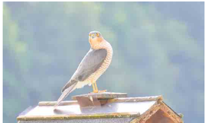
Falke auf dem Vogelhäuschen.