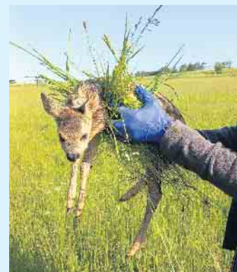
Das Kitz wurde dank moderner Wärmebildtechnik via Drohne gefunden