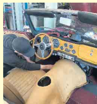
Im Kfz-Meisterbetrieb Schäfer werden auch Oldtimer frisch gemacht

bilclub Deutschland) und der ARCD (Auto- und Reiseclub Deutschland). Nebenbei kann sich der Kfz-Meisterbetrieb Schäfer seit über 15 Jahren zu den 500 Servicebetrieben mit rund 3000 Kfz-Fachleuten des ACE allein in Deutschland hinzuzählen. Jeden Mittwoch und Freitag ist zudem eine Hauptuntersuchung (HU) und eine Abgasuntersuchung (AU) durch den DEKRA im Hause möglich. [BL]