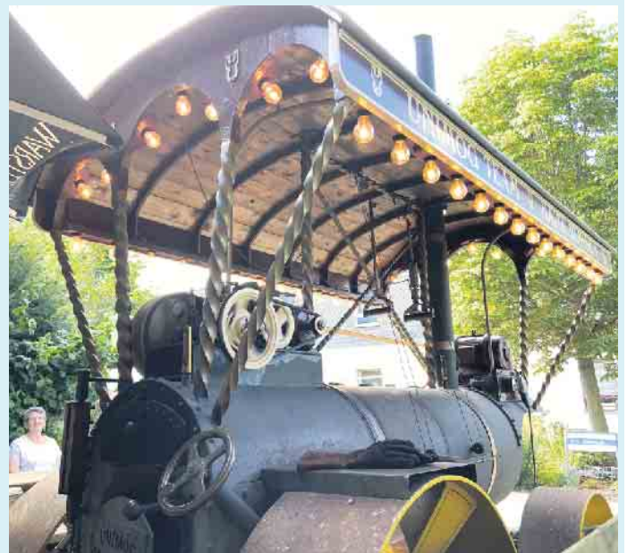
Beim Landgasthof Schöttes packt der Chef noch persönlich an