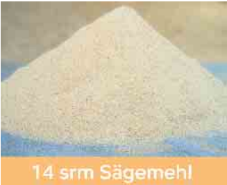
14 srm Sägemehl

Das Rundholz wird im Sägewerk zunächst entrindet, es fallen ca. 4 Raummeter Rinde aus der LKW-Ladung an.