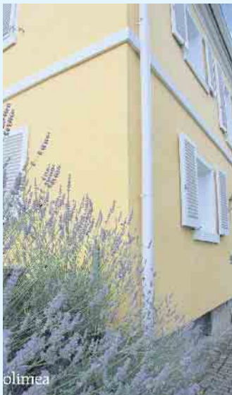
Helle Fassade von Volimea