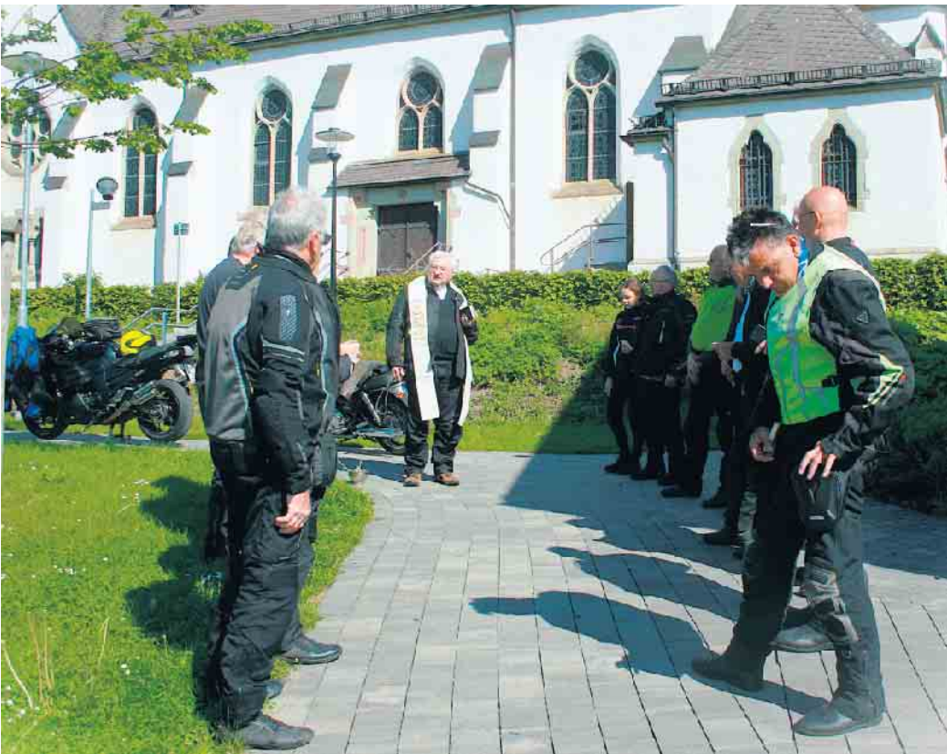
Start der Motorrad-Wallfahrt an der Kirche St. Engelbert in Medebach-Medelon

gelbert in Medebach-Medelon. Die erste Rast führte sie an den Diemelsee zum kurzen Erholen