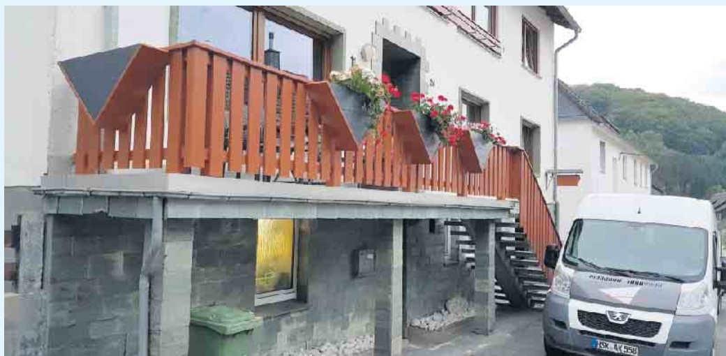
Balkongeländer in Holzoptik

Auch die Gestaltung und Fertigung von Balkongeländern in Kunststoff kann in vielfältiger Weise mit Kunststoffprofilen in der Kombination mit Edelstahl und Glas von der Tischlerei Holztec geplant und hergestellt werden. Die Balkonverkleidungen sind ebenfalls aus hochwertigem PVC, witterungsbe-