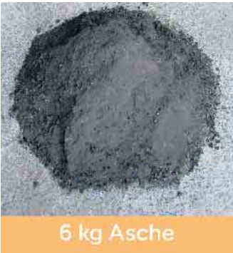
6 kg Asche

Die durch die Sägeaggregate direkt abgefrästen Hackschnitzel betragen 26 Schüttraummeter (8,4 to), diese werden entweder an die Zellulose- oder Holzwerkstoffindustrie (Spanplatte) geliefert, oder auch für die Holzpelletproduktion bzw. Hackschnitzelheizanlagen genutzt.