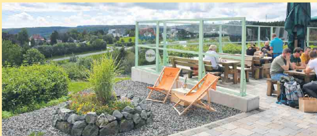
Die große Sonnenterrasse an der Schanze

Seit fast 100 Jahren prägt die St.Georg Sprungschanze die Skyline von Winterberg. Mitten im Ski-gebiet auf 734 m ü.M. findet ihr eine der schönsten Aussichtsterrassen von Winterberg. Mit unseren Spritz-Varianten aus der Sommerdrink-Karte schweift der Blick vom Kahlen Asten bis weit über Winterberg hinaus. Für die Kinder gibt's eine eigene Spielwelt mit Kugelbahnen und unserer großen Speil-Pistenwalze. In der noch jungen Gastronomie im Fuß der Schanze warten frisch gebackener Kuchen, Waffeln mit verschiedenen Toppings sowie eine ansprechende Auswahl an Speisen- auch in fleischlosen Varianten, wobei wir uns vom Street-food-Style inspirieren lassen. Übrigens hat „Die Schanze“ jetzt auch freitags, samstags und an Feiertagen die Türen bis 21.00 Uhr geöffnet. Da empfiehlt sich dann unbedingt noch ein Sundowner auf