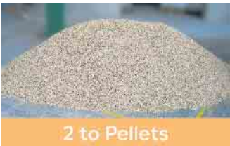
2 to Pellets

Die Kappstücke, die bei optimierter Einteilung der Stämme für die jeweilige Holzliste anfallen, betragen ca. 2 Raummeter.