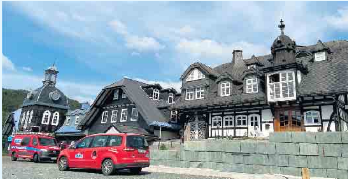
Der Meisterbetrieb Menke in Winterberg-Siedlinghausen

Komplettlösungen vom Meisterbetrieb Menke aus Winterberg-Siedlinghausen