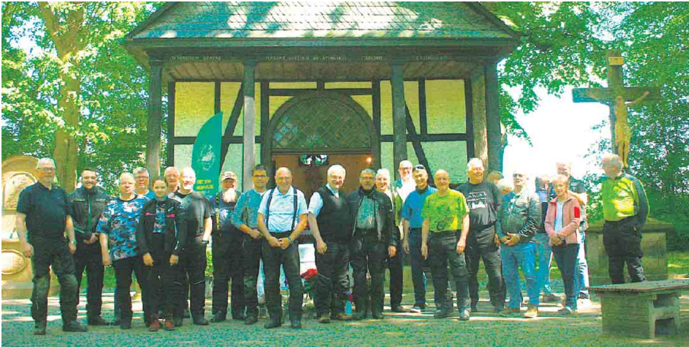
Biker am Wallfahrtsort „Am Brünneken“ in Verne