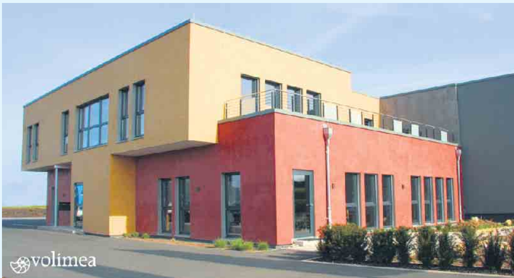
Warme Fassaden-Farbgestaltung von Volimea

Die Fassade ist das Aushängeschild eines jeden Bauwerks und die Möglichkeiten der Farbgestaltung sind nahezu unendlich.