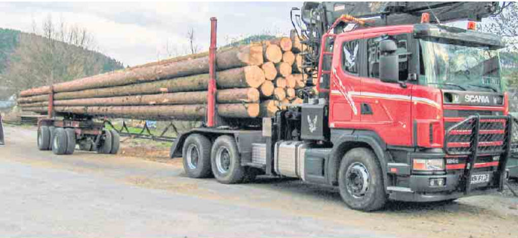
33 Festmeter Langholz

Der abgebildete LKW hat ca. 33 Festmeter Langholz geladen.