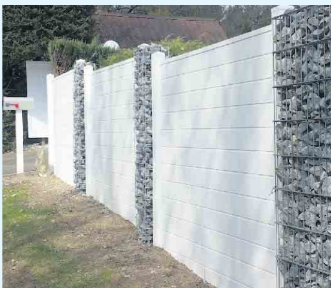
Schöne Kombination eines Sichtschutzes mit Steinelementen

ständig und langlebig. Die vielfältigen Gestaltungsmöglichkeiten Ihres Balkons in der Kombination Kunststoffprofile, Glas und Edelstahl geben ihrem Zuhause ein neues Gesicht. Lassen sie sich von Tischlerei Holztec beraten. [BL]