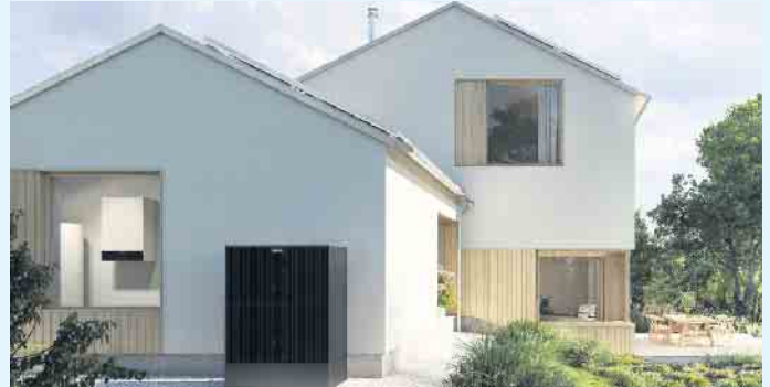
Moderne Häuser mit PV und Wärmepumpe

Um die in Erde, Wasser oder Luft gespeicherte Wärme verfügbar zu machen, nutzen Wärmepumpen elektrische Energie. Durch die Kombination mit einer Photovoltaikanlage lässt sich ein erheblicher Teil des benötigten Stroms aus Sonnenenergie erzeugen. Damit erlangt man mehr Unabhängigkeit von Energieversorgern und erreicht geringere Stromkosten. Eine Ausrichtung auf Ost- oder Westdächern passt am besten zum typischen Verbrauchsverhalten eines Privathaushalts, da die Module in den Morgen und Abendstunden Strom produzieren. Der Meisterbetrieb Menke aus Siedlinghausen steht für diese Anwendung mit einem entsprechend abgestimmtem System von Photovoltaik-