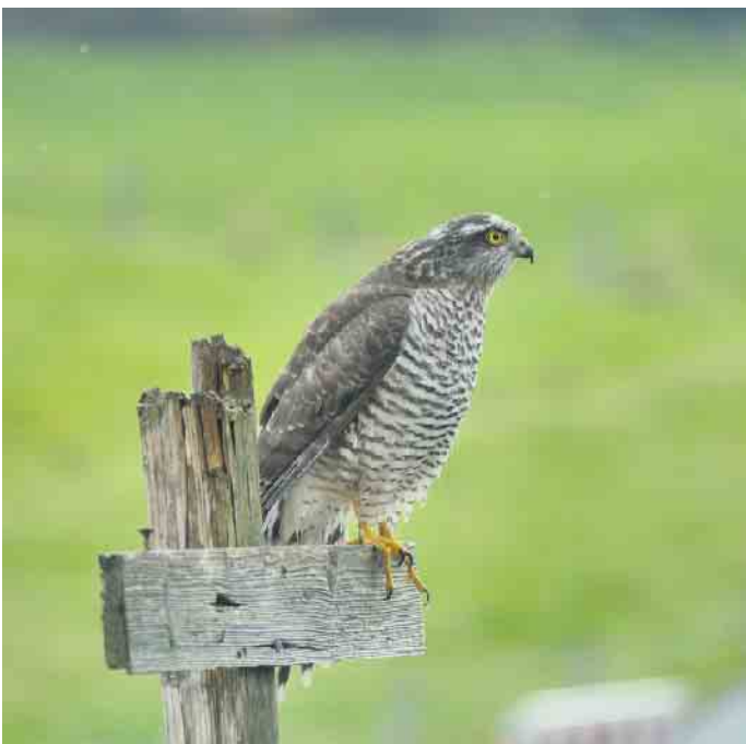
Junger Sperber.