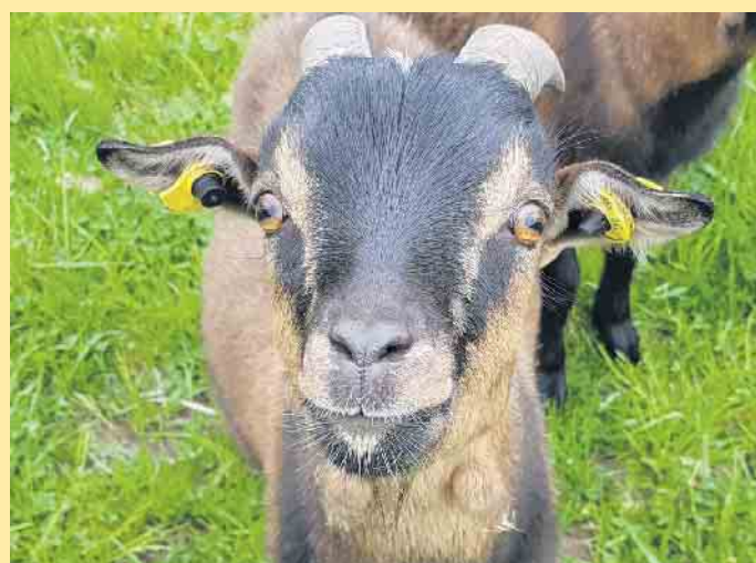
Im Streichelzoo des Schneewittchenhaus

Eis- die gibt's natürlich auch in alkoholfreien Varianten. Von dort aus geht es weiter den Rothaarsteig entlang bis zum Schneewittchen-Haus. Wer mit dem Bike unterwegs ist, kann sich dort im Bikepark auf den verschiedenen Parcours ausprobieren. Ansonsten kann das komplette Equipment auch im Bike-Verleih vor Ort gemietet werden. Für die Kinder warten die Zwergziegen, Schafe und Kaninchen in unserem Streichelzoo auf Eure Kleinen. Auf unserer Terrasse kann man aber auch ganz einfach dem Treiben nur zuschauen und an der Ostwand des Kahlen Asten vorbei den Blick in die Ferne schweifen lassen. Ein weiterer Blick in unsere Karte und schon zaubert unser