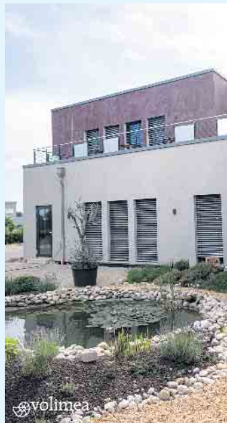
Moderne Fassade von Volimea

Lassen Sie sich vom Malerbetrieb Schnorbus auch für außergewöhnliche Looks inspirieren und beraten. [BL]