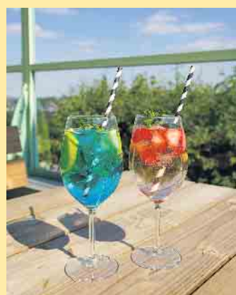
Spritzige Aperol-Variationen an der Schanze

Die Schanze Herrlohweg 100 59955 Winterberg Tel.: +49 (0) 2981 425 9019 kontakt@die-schanze.de Öffnungszeiten Täglich 11-18 Uhr Fr., Sa. und an Feiertagen bis 21 Uhr - Küche schließt eine Stunde früher. Dienstag Ruhetag.