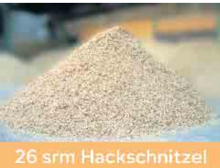
26 srm Hackschnitzel

Aus diesen Sägespänen (14 srm) werden nach dem Trocknen ca. 2 to Pellets gepresst.