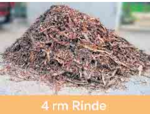
4 rm Rinde

Der abgebildete LKW hat ca. 33 Festmeter Langholz geladen.