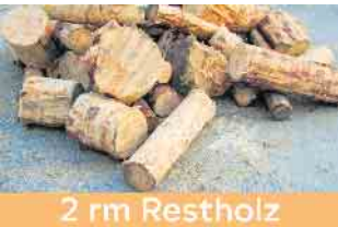
2 rm Restholz

Beim Auftrennen der Hölzer fallen 14 Schüttraummeter (3,8 to feuchte Sägespäne an.