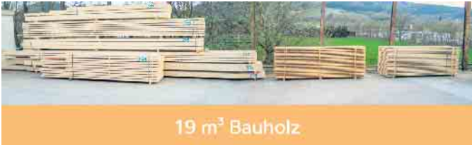
19 m³ Bauholz

PowerPellets werden direkt im Sägewerk in Eslohe aus Fichtenspänen hergestellt. Die Beschränkung auf diese besonders langfaserige Holzart ermöglicht einen optimalen Pressvorgang. Die im Sägewerk anfallenden Sägespäne werden pelletiert. Die folgende Bilder Geschichte verdeutlicht wie vollständig das Rundholz aus heimischen Wäldern genutzt wird. Da ein Stamm rund und ein Balken eckig ist, fallen erhebliche Mengen Sägeresthölzer an, die teilweise zu Pellets verpresst werden. Hier eine kleine Bilder Geschichte.