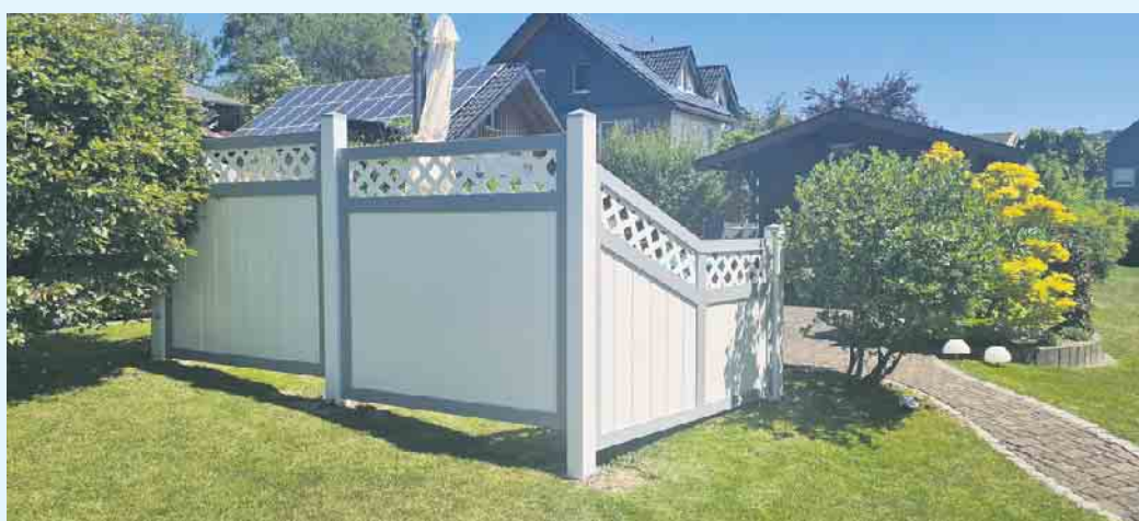
Heller Sichtschutz im Garten

ständig und langlebig. Die vielfältigen Gestaltungsmöglichkeiten Ihres Balkons in der Kombination Kunststoffprofile, Glas und Edelstahl geben ihrem Zuhause ein neues Gesicht. Lassen sie sich von Tischlerei Holztec beraten. [BL]