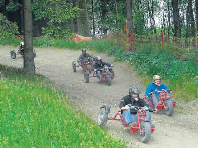
Spaß pur: Die Mountaincars an der Ruhrquellen-Hütte

Die Ruhrquellen-Hütte ist ein familienfreundliches Erlebnisziel für Radfahrer, denn sie bietet mit ihrer wunderschönen Umgebung Freizeitspaß pur. Inmitten vieler Wanderwege, direkt am Rothaarsteig und Ruhrtalradweg gelegen, ist die Ruhrquellen-Hütte das ideale Ziel, um eine Tour zu starten oder eine gemütliche Pause einzulegen.