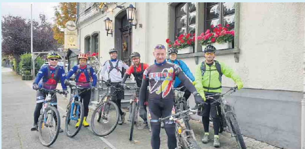
Bikegruppe vor dem Landgasthof Schöttes in Olsberg-Wiemeringhausen