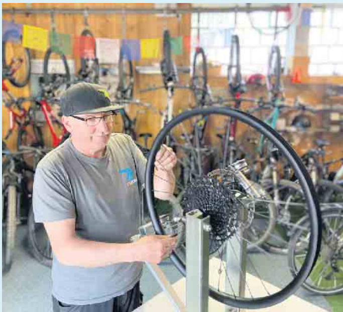
Kompetenter Service und Reparaturen rund ums Rad in Uppu,s Bike

Traumrouten im Raum Winterberg und der Bike Arena Sauerland sowie geführte MTB-Touren ganz individuell zum perfekten Wohlbefinden auf der Tour. Auf Wunsch können auch Pauschalangebote für Touren mit und ohne Übernachtungen zum Kennenlernen der Region oder Mehrtagestouren durch das Sauerland mit Übernachtungen in zünftigen Hütten zusammengestellt werden. Ganz nach Geschmack wird für Firmen und Vereine auch ein erlebnisorientiertes Angebot erstellt. Zur MTB-Miettour sind alle Tipps kostenlos. Der Erfahrungsschatz stammt aus über 30 großen Touren. Um auf dem Bike sicher zu werden, führt Uppu auch Mountainbike-Schulungen für Anfänger bis Alpenüberquerer durch. Von Juli bis Oktober ist täglich ab 9.00 Uhr geöffnet. [BL]