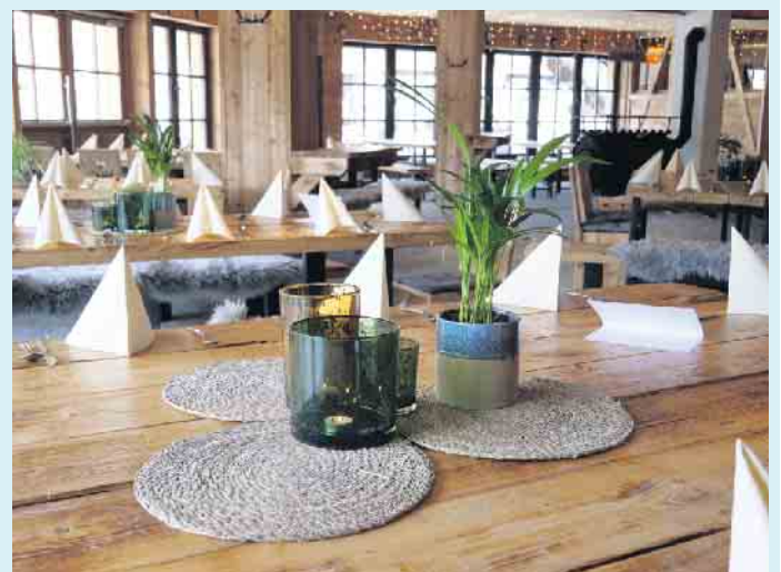
Tolles Hüttenambiente „Bei Möppi“

Bei Möppi kann man die wilde Seite jeder Saison genießen. Hier treffen rustikales und stylisches Hüttenflair auf gleich drei Etagen, mit Winterbergs modernster und größter Erlebnisgastronomie aufeinander. Die große Außenanlage lädt bei gutem Wetter zum chillen ein. Bei gutem Wetter wird für die kleinen Gäste auch eine Hüpfburg aufgebaut. [BL]