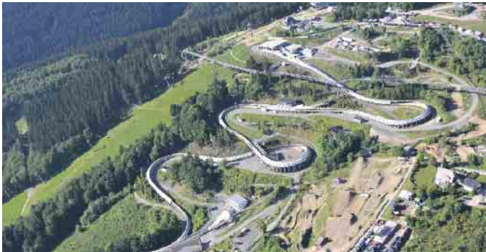
Luftaufnahme VELTINS-EisArena.

Mit dem BobbahnRun Winterberg feiert am 24. Juni ein neues Laufevent Premiere. Bislang haben sich 219 Laufbegeisterte für die ganz besondere Herausforderung angemeldet: Nach einer 5 Kilometer-Laufrunde durch die Wälder des Erlebnisbergs Kappe gilt es die 1,6 Kilometer lange Bobbahn zu be-