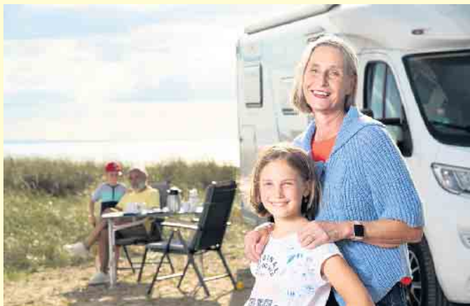
Campingurlaub ist in allen Generationen angesagt. Bevor es losgeht, sollte allerdings der Versicherungsschutz für das Wohnmobil überprüft werden.

Die besten Versicherungstipps für die Reise mit Wohnmobil und Caravan