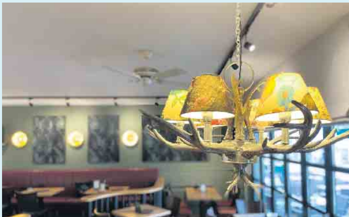
Die gemütlich, stylischen Räumlichkeiten des Bistro Uppu

Der wohl bekannteste und kultige Bike-Treff „ Bistorant Uppu “ im Sauerland befindet sich im Zentrum von Winterberg und direkt an den ausgezeichneten Routen der Bike-Arena Sauerland und dem Rothaarsteig.- Frei nach dem Motto „hier trifft sich alles was 2 Räder hat“- vor, zwischen und nach der Tour. Bei „Uppu“ sind auch „versaute“ Biker herzlich willkommen. Hier zu verweilen ist die schönste Art, nach einer harten Tour zu entspannen. Die Speisekarte wurde von und für Biker zusammengestellt und umfasst regionale, frische Produkte der Saison. Darunter auch Menüs wie das „Aktive-Sportler-Frühstück“. Die „Spezials“ aber bilden hier