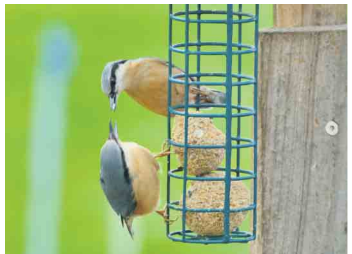
Kleibermännchen beim Füttern seiner Frau.

Kinder eine gute Vernetzung von Kindertageseinrichtungen und Familienzentren eine notwendige Basis zum Wohle der Familien sei. Aktiv genutzt wurde auch der „Tag der Kindertagespflege“ im Mai. Viele Tagesmütter aus Winterberg, Medebach und Hallenberg sowie eine Gruppe der Großtagespflege des DRK hatten es sich nicht nehmen lassen, sich im Aktiv- und Vitalpark Winterberg zu treffen. Auch eine Mutter, die sich für die Tagespflege interessiert, bereicherte mit ihren Kindern das Treffen und tauschte sich aus.