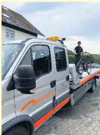
Der Kfz-Meisterbetrieb Schäfer schleppt auch E-Bikes ab

terbetrieb Schäfer seit über 15 Jahren zu den 500 Servicebetrieben mit rund 3000 Kfz-Fachleuten des ACE allein in Deutschland hinzuzählen. [BL]