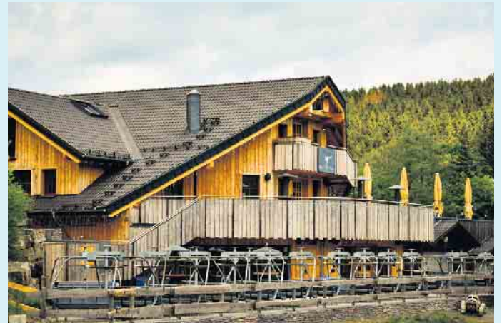
Die stattliche Hütte „Bei Möppi“ am Poppenberg in Winterberg

Einfach ausgefallen gut.- In der ganzjährig geöffneten Ski- und Wanderhütte „Bei Möppi“ erwarten die Gäste leckere Wildgerichte mit Fleisch aus der Region, aber auch süße und deftige Leckereien. Bei allen Gerichten sowie bei Barbecue wird stets besonders schmackhaftes und zartes Qualitätsfleisch aus lokaler und nachhaltiger Zucht verwendet.