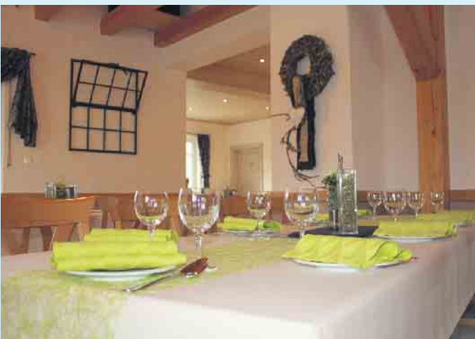
Gemütliches Ambiente in der Ruhrquellen-Hütte

Einkehrer im Einsatz. Ausreichend Parkmöglichkeiten sind vorhanden. Genial geeignet ist die Ruhrquellen-Hütte auch für diverse Familien- sowie für Betriebsfeiern auf Voranmeldung. Die Speisekarte umfasst eine große Auswahl an Hauptspeisen, Pasta und Kindergerichten. Neu auf der Speisekarte sind verschiedene Pizzen. Ein besonderer Spaß und Nervenkitzel vom Feinsten bietet das Mountaincart, ein Downhill-Kart für den Liftbetrieb im Sommer. Durch sein flottes Design und sein leichtes Handling findet er bei Jung und Alt gleichermaßen großen Anklang. Sehr beliebt ist das Mountaincart für Kindergeburtstage oder Junggesellenabschiede. [BL]