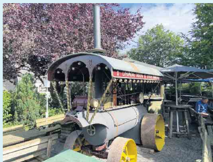
Der BBQ-Grill im Dampflok-Style im Biergarten des Landgasthof Schöttes