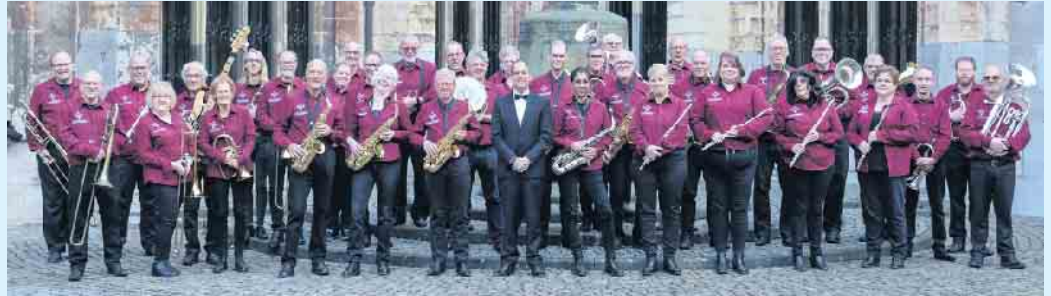
Musikverein Mixed Harmony Maastricht

Das Schöne: Direkt am Marktplatz können Sie sich im Ristorante Café „AnGerichtet“ mit