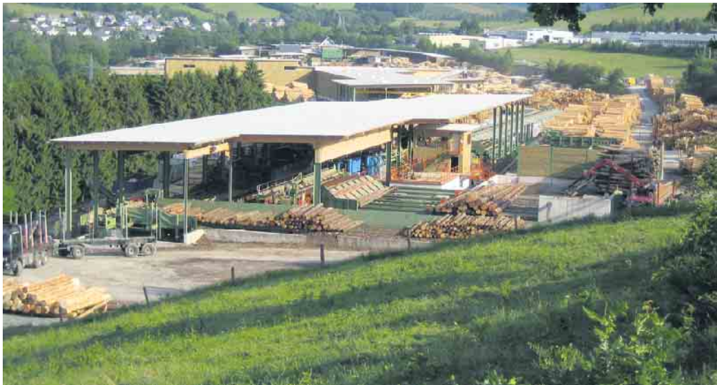
In Deutschland werden Holzpellets aus Sägespänen und anderen Resten gepresst, die bei der Holzverarbeitung anfallen. Bau- und Möbelholz wird nicht für die Pelletproduktion genutzt.

Immer mehr Eigenheimbesitzer entscheiden sich gegen fossile Brennstoffe wie Öl und Gas. Eine gute Alternative sind Heizsysteme auf Basis von Holzpellets. Sie gelten als klimaschonend und werden staatlich gefördert. Dennoch gibt es immer wieder Diskussionen, ob das Heizen mit Holzpellets dem Klimaschutz tatsächlich zugutekommt. „Dass in Deutschland Bäume allein für die Herstellung von Pellets gefällt werden, ist ein weitverbreiteter Irrglaube“, weiß Martin Bentele, Geschäftsführer des Deutschen Pelletinstituts. „Bau- und Möbelholz hat als Rohstoff einen viel zu hohen Preis, um es zu verheizen.“ Holzpellets in Deutschland werden aus regional anfallenden Sägespänen und Resten hergestellt. Pellets tragen also dazu bei, dass Holz, für das es keine sinnvollere Verwendung gibt, optimal genutzt wird. Das bedeutet auch: Je mehr Holz für ökologische Bauprojekte verarbeitet wird, desto mehr Rohmaterial fällt für die Pelletproduktion an. Der im Zusammen-