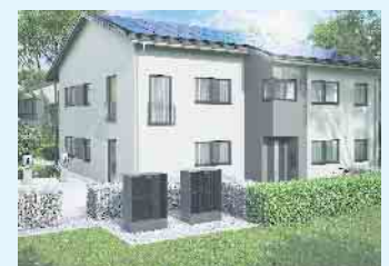
Bestens ausgestattetes Mehrfamilienhaus mit PV-Anlagen, Wärmepumpen und Wallboxen