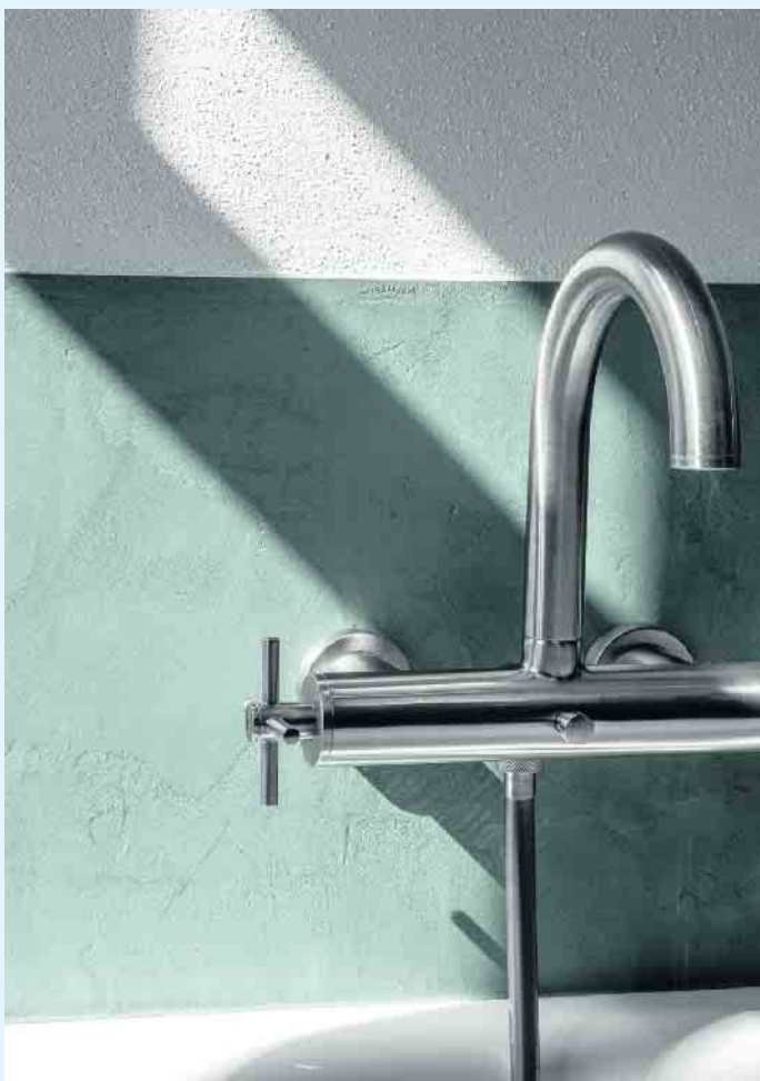
Schöne Wandgestaltungsmöglichkeiten von Volimea futado

Oberflächen von „ Volimea futado “. Die urbane Ästhetik von futado auf mineralischer Weiß- und Grauzementbasis für vielfältige