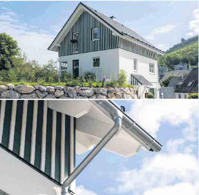
Schöne Holzfassade im Giebelbereich

Unterhalb des mit gewelltem Betondachstein eingedeckten Satteldachs sorgen die lotrechte Holzfassade mit Bodendeckelschalung in grün und weiß für ein auffälliges, gleichermaßen rustikales wie modernes Äußeres. Unterstrichen wird dies durch die moosgrüne Holzhaustür, über der sich ein Schleppdach mit integrierten Einbauspot für eine