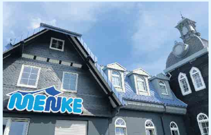
Der Meisterbetrieb Menke in Winterberg-Siedlinghausen

Um die CO 2 -Emissionen im Gebäudebereich zu senken, fördert der Staat den Einsatz erneuerbarer Energien beim Heizen. Grundlage ist die Bundesförderung für effiziente Gebäude (BEG). Über diese beteiligt sich der Staat auch an den Kosten für Wärmepumpen. Ein Rechtsanspruch auf Förderung besteht nicht. Ausnahmen können