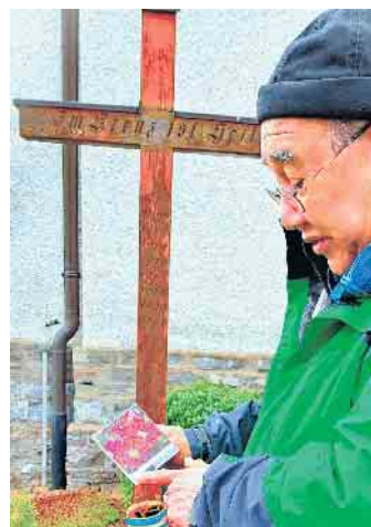
Auswahl des passenden Standortes an der Kirche St. Antonius, Medebach-Oberschledorn