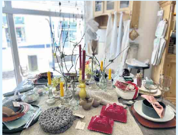
Frühlingshafte Geschirrkollektionen bei „Tischlein deck dich“