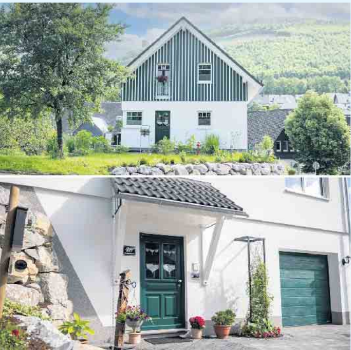
Wohntraum in Holzbauweise

Weitere Infos und Beispiele aus den Bereichen Hausbau, Anbau und Aufstockung finden Sie auf unserer Website unter: www.moderner-holzbau.de