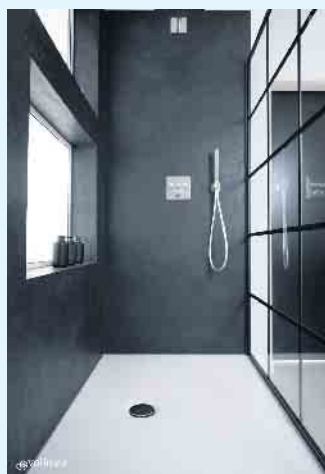
Moderne Badgestaltung von Volimea futado

Ansprüche. Dabei lässt sich die Spachtelmasse problemlos auf alte Fliesen auftragen. Das Ergebnis sind fugenlose, rutschsichere und pflegeleichte Oberflächen, die in ihrem natürlichen Charme viel Raum für Individualität in allen Wohnbereichen, besonders Bädern oder auch in Ihrem Geschäftsbereich lassen.