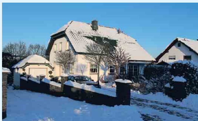
Dächer werden durch vielfältige Witterungen und Temperaturunterschiede beansprucht. Ein regelmäßiger Check sorgt für Sicherheit.

PV-Anlagen sind vielerorts bereits ein fester Bestandteil auf unseren Dächern. Auch hier prüft der Dachdecker, ob beispielsweise die Module noch sicher befestigt sind und es keine Beschädigungen an der Unterkonstruktion des Dachs gibt. Übrigens: bei leichten Verschmutzungen, einer dünnen, oder sogar bei einer geschlossenen Schneedecke, arbeitet eine Solaranlage weiter. Nur bei großen Schneelasten oder sehr starken Verschmutzungen besteht Handlungsbedarf. Auch hier sollten Fachbetriebe zu Rate gezogen werden. Die fachgerechte Montage von Solaranlagen auf dem Dach ist entscheidend für Wirkungsgrad und Haltbarkeit, ebenso wie die regelmäßige Überprüfung der Anlage. Innungsbetriebe des Dachdeckerhandwerks sind auf der ZVDH-Verbandsseite zu finden: https://dachdecker.org/hausbesitzer/betriebe/ (akz-o)