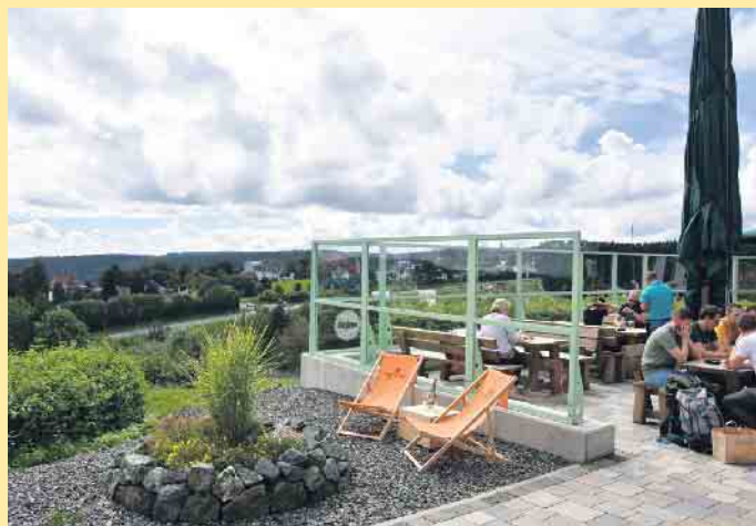
Außenterrasse der Gastronomie in der St. Georg Schanze mit herrlicher Aussicht

Seit fast 100 Jahren prägt die St. Georg Sprungschanze die Skyline von Winterberg. Mitten im Skigebiet auf 734 m ü.M. findet ihr eine der schönsten Aussichtsterrassen von Winterberg. Mit einer unserer neuen Spritz-Varianten aus der neuen Sommerdrink-Karte schweift der Blick vom Kahlen Asten bis weit über Winterberg hinaus. Für die Kinder gibt's eine eigene Spielwelt mit Kugelbahnen und unserer großen Spiel-Pistenwalze. In der noch jungen Gastronomie im Fuß der Schanze warten frisch gebackener Kuchen, Waffel mit verschiedenen Toppings sowie eine ansprechende Auswahl an Speisen - auch in fleischlosen Varianten, wobei wir uns vom Streetfood-Style inspirieren lassen. Übrigens hat „Die Schanze“ jetzt auch freitags bis sonntags“ die Türen bis 21 Uhr geöffnet. Da empfiehlt sich dann unbedingt noch ein Sundowner auf Eis - die gibt's natürlich auch in alkoholfreien Varianten. Von dort aus geht es weiter den Rothaarsteig entlang bis zum Schneewittchen-Haus. Wer mit dem Bike unterwegs ist, kann sich dort im Bikepark auf den verschiedenen Parcours ausprobieren. Ansonsten kann das komplette Equipment auch im Bike-Verleih vor Ort gemietet