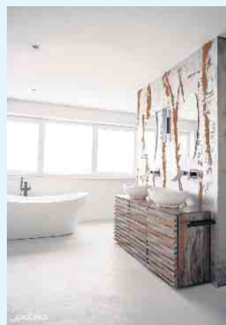
Helles, modernes Bad von Volimea futado

Die hochstabilen und mineralischen Kalkzement- und Harzkomponenten machen die Beschichtung spannungsarm. Dank der guten Haftungs- und Druckfestigkeit halten sie einer hohen Belastbarkeit problemlos stand.