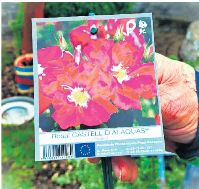
Als Pilgerrose bezeichnet: Rosal Castell D’Alaquàs

Alle Interessierten, Rosenliebhaber und Pilger sind zu diesen Veranstaltungen herzlich eingeladen.