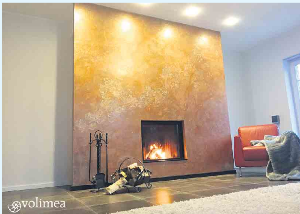
Wohnzimmer Kamin-Wandbeschichtung von Volimea grandezza in bronze

Der Malerbetrieb Schnorbus aus Züschen verleiht Ihren Wänden eine zeitlos-elegante Noblesse mit schillernden farblichen Akzenten und außergewöhnlichen