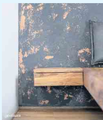
Schlafzimmer-Wanddesign mit Wandbeschichtung in Antik-Bronze-Patina von Volimea grandezza

Der Malerbetrieb Schnorbus aus Züschen verleiht Ihren Wänden eine zeitlos-elegante Noblesse mit schillernden farblichen Akzenten und außergewöhnlichen