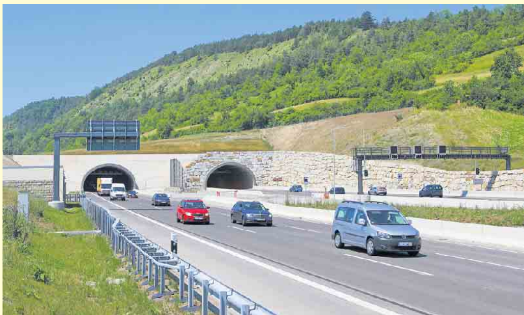
Die über 270 Tunnel auf deutschen Autobahnen und Bundesstraßen gehören zu den sichersten der Welt. Das richtige Verhalten ist dennoch wichtig.

Bei einem Stau im Tunnel ist es wichtig, eine Rettungsgasse für die anrückenden Einsatzkräfte zu bilden. Autos auf dem linken Fahrstreifen fahren ganz nach links, auf den anderen Fahrstreifen