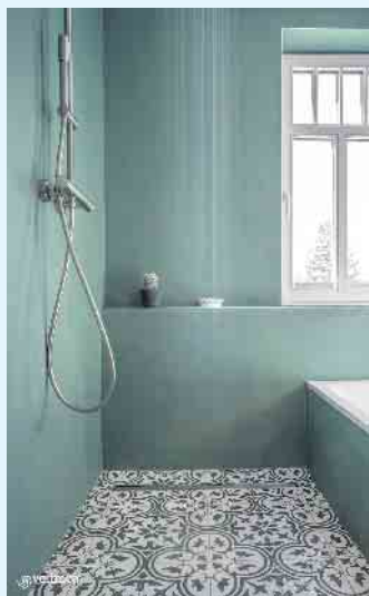
Stylische Badgestaltung von Volimea futado

Der Malerbetrieb Schnorbus aus Züschen verleiht Ihren alten Bädern neuen Glanz.- Dank der fugenlosen und belastbaren Oberflächen von „ Volimea futado “. Die urbane Ästhetik von futado auf mineralischer Weiß- und Grauzementbasis für vielfältige Ansprüche.