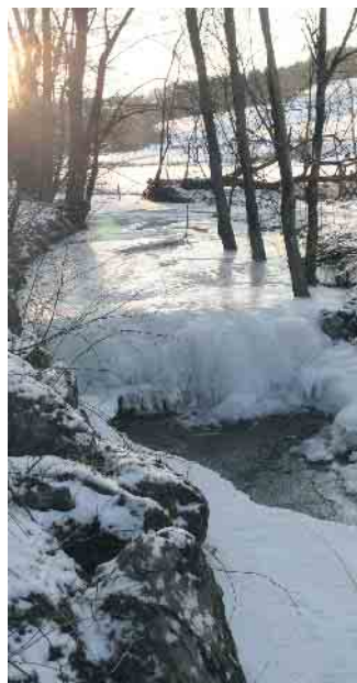
Bach im Halletal/Oberschledorn.

Zur diesjährigen Mitgliederversammlung lädt die „Forstbetriebs-gemeinschaft Orke“ am Mittwoch, 26. Februar, um 19.30 Uhr, in den Speisesaal der Schützenhalle in Medebach-Berge ein. Damit alle organisierten Privatwaldbesitzer möglichst umfassend zu informiert sind, empfiehlt sich die Teilnahme an dieser offiziellen Mitgliederversammlung. Der Vorstand der FBG Orke bittet daher alle Mitglieder der FBG Orke um rege Teilnahme an der Veranstaltung.