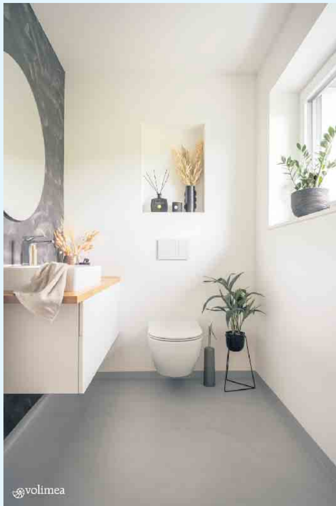
Helle Badgestaltung mit fugenlosen Wänden und Böden

rät Sie gerne zu Ihrer individuellen, fugenlosen Wand- und Bodengestaltung. [BL]