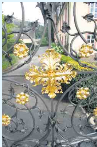
Barocke Schmiedearbeit der Kunstschmiede Willecke

59955 Winterberg-Siedlinghausen · Weberstraße 2 Telefon 02983 478 · Telefax 969512 www.kunstschmiede-willecke.de