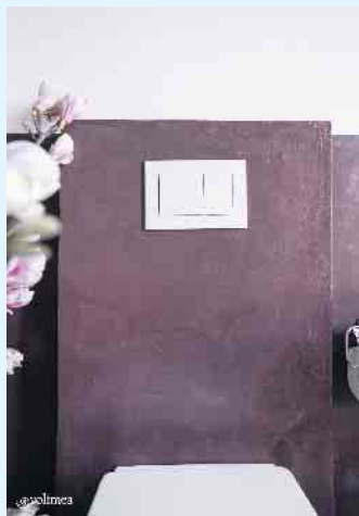
Moderne, fugenloser Strukturputz von Volimea