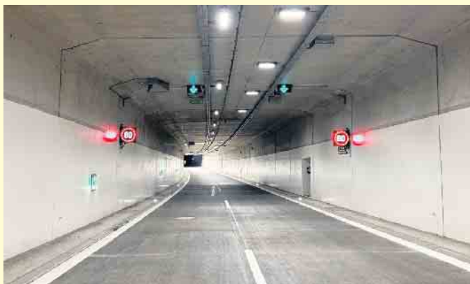
Im Tunnel ist es besonders wichtig, auf Ampeln und Verkehrszeichen zu achten.

Bei Bedarf stellen sie dann eine Geschwindigkeitsbegrenzung ein, sperren einen Fahrstreifen oder gleich die ganze Tunnelröhre. (DJD)