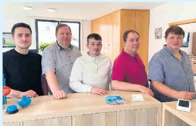
Das Team von Sauerland Promotion

Werbung, die wirkt - für große und kleine Unternehmen.- So verspricht es Sauerland Promotion. Mit kreativen Promotion-Aktionen, professioneller Kostümpromotion und gezielten Werbemaßnahmen macht das Team Ihre