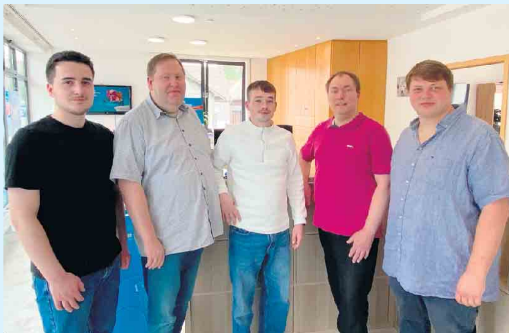
Das Team von „Sauerland Promotion“ aus Winterberg-Züschen

Das junge, dynamische Team von „Sauerland Promotion“ befindet sich seit über einem halben Jahr in der ehemaligen Sparkassen-Filiale in Winterberg-Züschen und hat seitdem die bereits vielfältigen Dienstleistungen stetig erweitert, so auch in Züschen um den Bereich der Appartement- und Ferienhaus-Services, die u.a. auch die Schlüsselübergabe & -aufbewahrung für Ihre Gäste durch eine sichere Verwahrung in einem modernen Schlüsselsafe-System mit flexibler 24/7-Schlüsselausgabe beinhaltet.- Stets persönlich und rund um die Uhr, angepasst an die Bedürfnisse Ihrer Gäste. Das geprüfte und zuverlässige Schlüsselsystem verspricht höchste Sicherheit. Der Reinigungsservice umfasst eine professionelle Endreinigung nach der Abreise der Gäste und regelmäßige Zwischenreinigungen auf Wunsch des Gastes. Gründliche Desinfektion und Pflege für höchste Hygiene werden hier groß geschrieben. Für eine gute Gästebetreuung ist immer ein persönlicher Ansprechpartner für Ihre Gäste da. Unterstützung bei Anfragen und Wünschen bekommt man rund um die Uhr, ebenfalls in Form eines 24/7-Services, ebenso wie eine reibungslose Kommunikation mit Mietern vor, während und nach dem Aufenthalt. Zur Objektpflege gehört die Kontrolle des Appartements nach jedem Aufenthalt mit einer