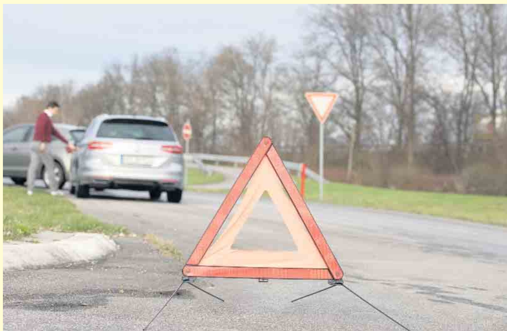
Jedes Jahr ereignen sich auf deutschen Straßen Millionen von Verkehrsunfällen.

Für die Schadenregulierung durch die Versicherung und