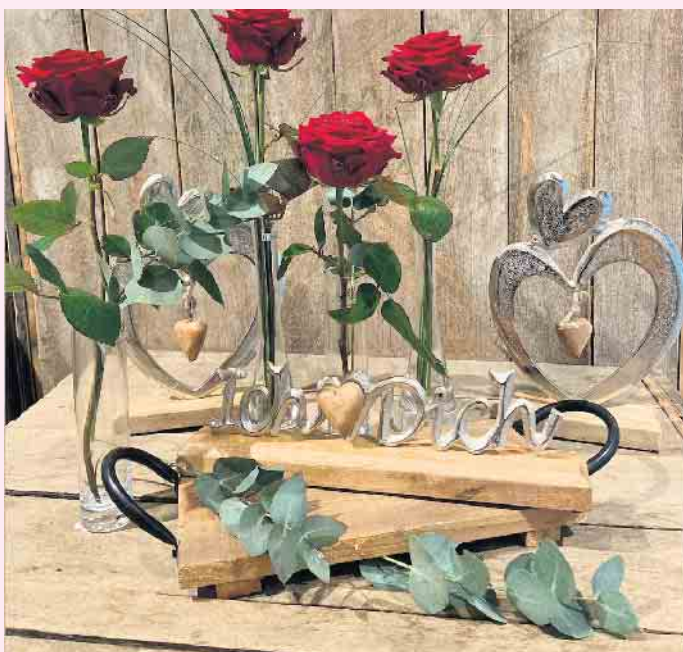
Kreative Liebesgrüße zum Valentinstag bei Blumen Klauke

Den Klassiker dabei bilden rote Rosen als Symbol für Liebe und Zuneigung.