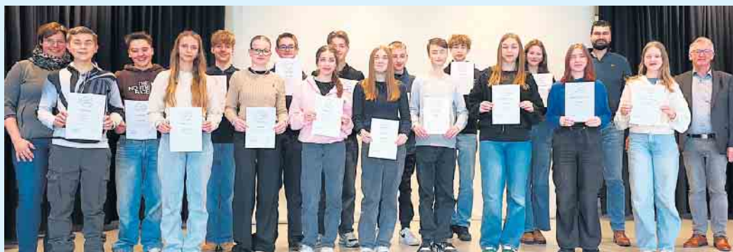
20 Schülerinnen und Schüler der Sekundarschule Medebach-Winterberg erhielten jetzt für ihre erfolgreiche Teilnahme am Projekt „Unternehmen vor Ort“ das Zertifikat von der Wirtschaftsförderung Winterberg.

Winterberg. Was hilft gegen Fachkräfte- und Nachwuchsmangel? Gezielte Information, gute Kommunikation und der persönliche Austausch von jungen Menschen mit heimischen Unternehmerinnen und Unternehmern! Alle diese Komponenten vereint das Projekt „Unternehmen vor Ort“, das kurz „UvO“ genannt wird. Initiiert von der Wirtschaftsförderung Winterberg, hat „UvO“ in Kooperation mit der Sekundarschule Medebach-Winterberg zum Ziel, die Schülerinnen und Schüler des 8. bzw. 9. Schuljahrgangs auf freiwilliger Basis in den direkten Kontakt mit heimischen Betrieben aus Winterberg, Medebach und Hallenberg zu bringen. Ganz konkret stellen sich die Unternehmer bei einem