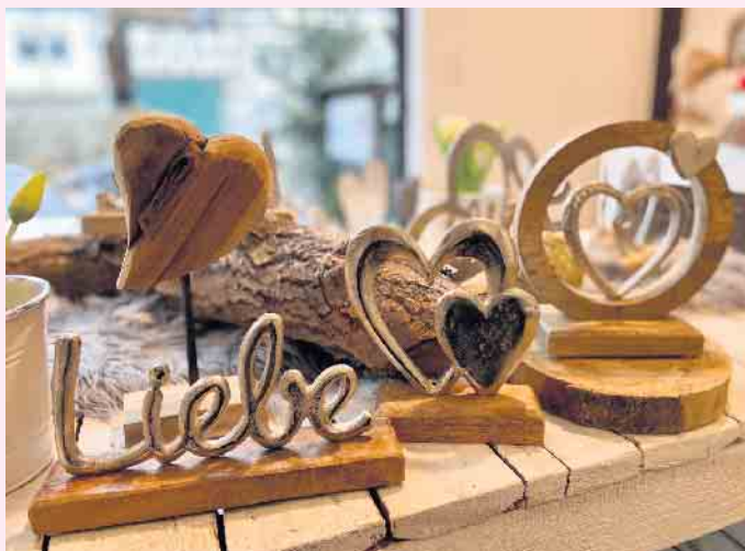
Stylische Dekorationen von Blumen Klauke zaubern Liebe ins Haus

Schließlich zählen Blumen zu den Klassikern unter den Geschenken zum Tag der Verliebten.