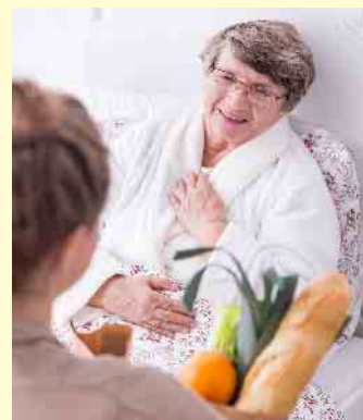
Hospizbegleiterinnen und -begleiter kümmern sich um sterbensranke Menschen und entlasten die Angehörigen.

„Im Mittelpunkt der Hospizarbeit steht der schwerstkranken und sterbende Mensch mit seinen Wünschen und Bedürfnissen sowie seine Angehörigen und Nahestehenden“, so Hardinghaus. Neben dem häufig geäußerten Wunsch, bis zum Lebensende im vertrauten Umfeld bleiben zu können, gilt es, den Menschen Zuwendung zu schenken und sie zu unterstützen. Dabei kann es beispielsweise darum gehen, ihnen einfach nur zuzuhören, ihnen vorzulesen, gemeinsam zu malen oder ein Spiel zu spielen. Diese Aufgabe übernehmen deutschlandweit mehr als 50.000 ehrenamtliche Hospizbegleiterinnen und -begleiter. Mehr Informationen über ihren täglichen Einsatz gibt es zum Beispiel unter www.dhpv.de oder beim Hos-