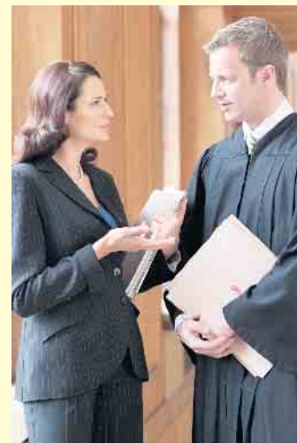
Wer am Verkehr teilnimmt, kann sich mit einer Rechtsschutzversicherung gegen Streitigkeiten im Verkehr absichern.

Eine Verkehrsrechtsschutzversicherung, etwa bei der DEVK, schützt vor rechtlichen Streitigkeiten im Straßenverkehr sowie finanziellen Belastungen. Sie hilft beispielsweise, wenn Beteiligten nach einem Verkehrsunfall fahrlässige Körperverletzung vorgeworfen wird oder Führerscheinentzug droht. Detaillierte Informationen gibt es unter www.devk.de/recht . Zum Service des Kölner Versicherers gehört unter anderem eine unabhängige telefonische Rechtsberatung. Außerdem vermittelt das Unternehmen kompetente Rechtsanwältinnen und Rechtsanwälte und ermöglicht auch außergerichtliche Streitbeilegung über Mediation. Bei einem