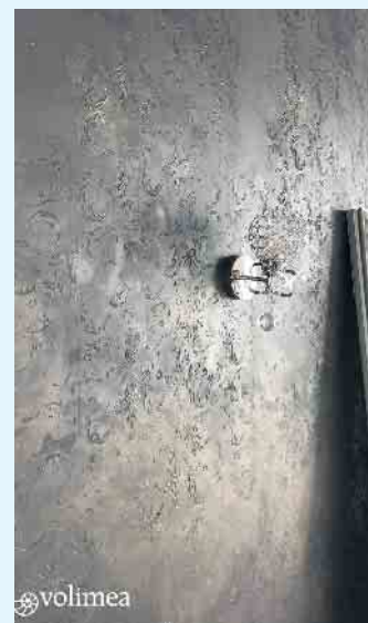
Volimea Grundspachtel anthrazit mit antikgold und Struktur