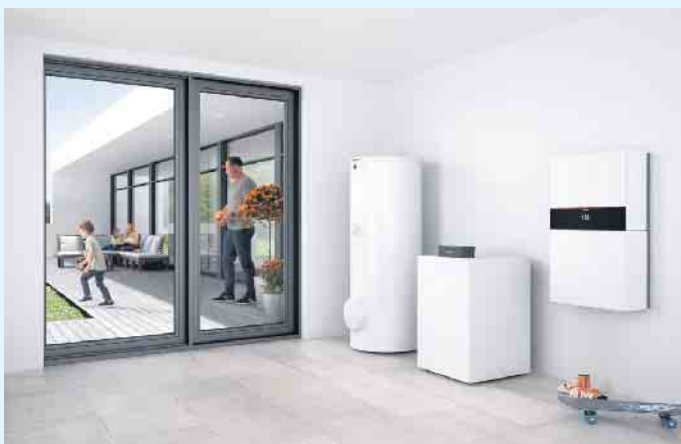
Wärmepumpenlösung für Alt- und Neubau

des Heizkreises (Vorlauf, Rücklauf) und des Primärkreises (z. B. Solevor- und -rücklauf) sowie einem Drehstromanschluss sind meistens keine weiteren Installationsarbeiten im Hause notwendig. Damit eine Wärmepumpenanlage aber das halten kann, was sie verspricht, müssen eine professionelle Planung und Installation erfolgen. Die Meisterbetriebe der Innung für Sanitär- und Heizungstechnik sind für diese Arbeiten die richtigen Partner. Fragen Sie Ihren Installateur- und Heizungsbauermeister nach der Wärmepumpentechnik - und nutzen auch Sie schon bald die Wärme, die einfach da ist. Die Umwelt bietet einer Wärmepumpe gleich vier mögliche Wärmequellen an.