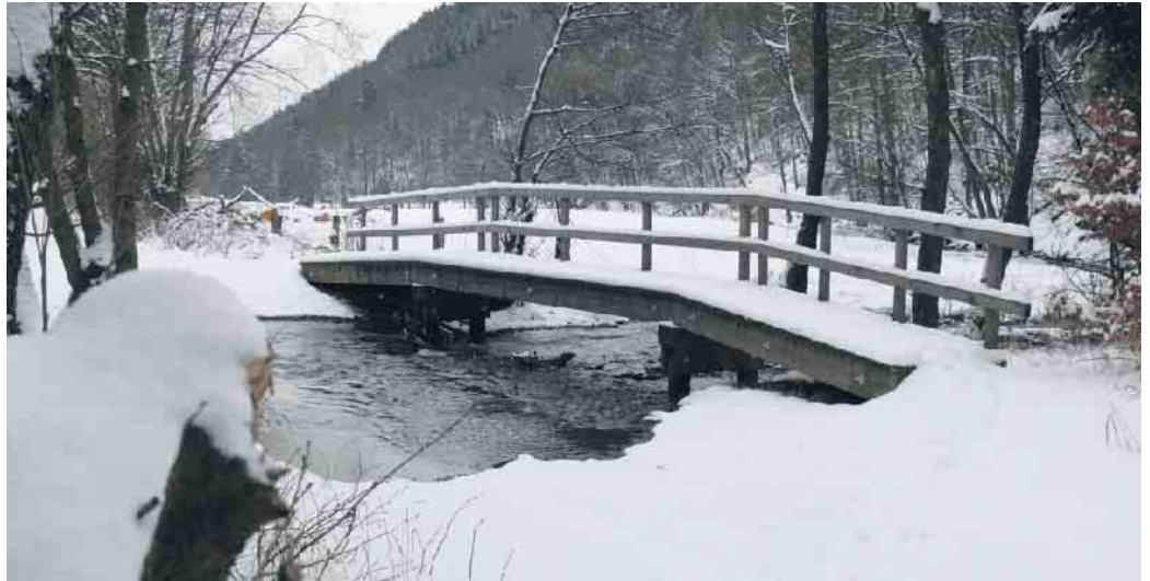
Leserfoto von Heinz Kling (Archivfoto aus Dezember 2024)