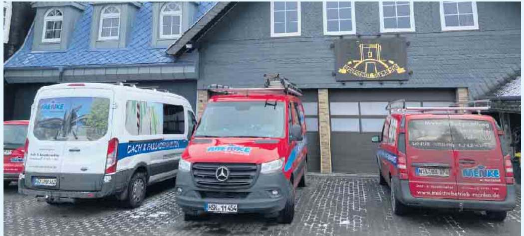
Der Meisterbetrieb Menke in Winterberg-Siedlinghausen

Die Wärmepumpe speist mit der aus der Umwelt gewonnenen Energie die Heizung und die Warmwasserbereitung eines Hauses. Im Gegensatz zu Solaranlagen ist eine Wärmepumpenanlage sogar in der Lage, ganzjährig den Wärmebedarf eines Domizils abzudecken. Damit stellt eine Wärmepumpe eine interessante Alternative zur konventionellen Beheizung dar. Auch bei der Modernisierung älterer Gebäude sollte man über den Einbau einer Wärmepumpe nachdenken. Wärmepumpen können Vorlauftemperaturen bis zu 65 Grad erreichen und dadurch nicht nur mit Fußbodenheizungen, sondern auch mit konventionellen Heizkörpern betrieben werden. Außer der Einbindung