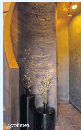
Wandbeschichtung Treppenhaus mit antikgold von Volimea

Wandbeschichtungen von grandezza verfügen im Gegensatz zu Tapeten über eine große Robustheit, starke Haftkraft und