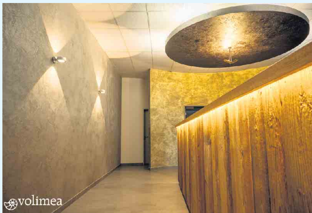
Spachteloptik bleigrau mit Goldlasur von Volimea

Ihr Malerbetrieb Schnorbus berät Sie gerne zu Ihrer individuellen, fugenlosen Wand- und Bodengestaltung. [BL]