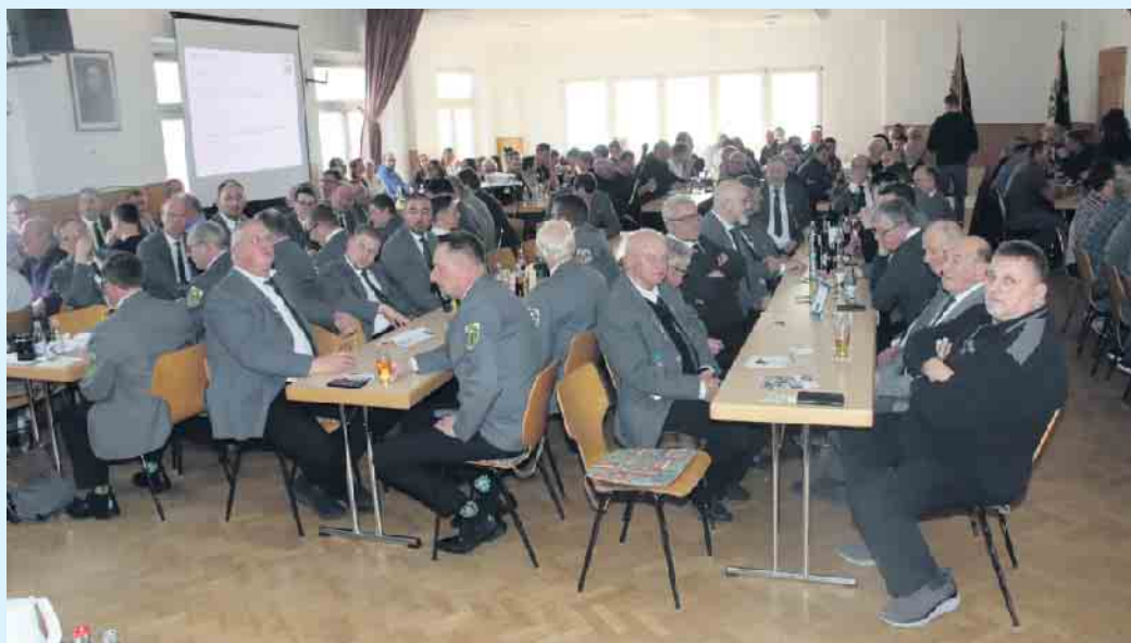
Generalversammlung des Jahres 2025.

Der Vorstand freut sich auf eine rege Teilnahme aller Vereinsmitglieder und auf angeregte Gespräche und Diskussionen.