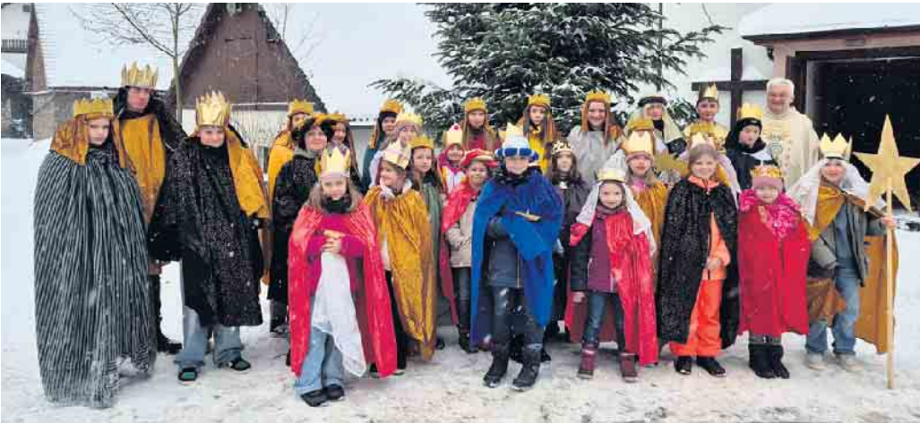
Sternsinger Titmaringhausen, Deifeld und Referringhausen.

Unter dem Motto „Schule statt Fabrik - Sternsingen gegen Kinderarbeit“ sammelten zwölf Sternsinger