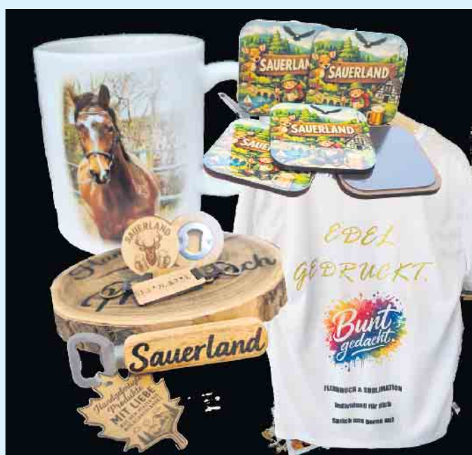
Handgemachte, individuelle Sauerländer Geschenke von KDL Heimatgefühl

Die jungen Unternehmer, die stark regional verwurzelt sind, sehen sich selbst als modernes Sauerländer Handwerksunternehmen, frei von Massenabfertigung, sondern wo jeder einzelne Wunsch und die Kundenzufriedenheit zählt. Deshalb nimmt man sich Zeit für jede Bestellung und die passende Lösung, für ein individuelles und für jeden Anlass maßgeschneidertes Produkt. Produziert wird gerne in größeren Mengen für Vereine und Unternehmen, jedoch auch für einzelne Privatkunden: Vom einzelnen Frühstücksbrett zum Geburtstag, dem Taufgeschenk, bis hin zur Firmenkleidung oder dem Hofstaatshirt ist alles möglich. [BL]