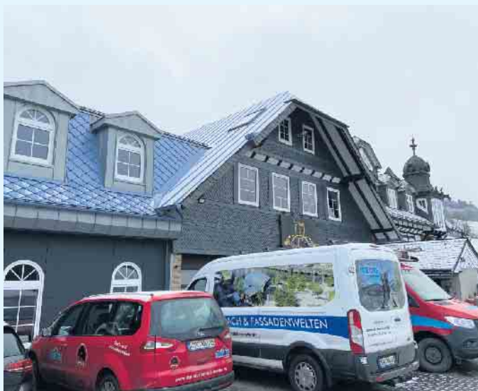
Der Meisterbetrieb Menke in Winterberg-Siedlinghausen

Komplettlösungen vom Meisterbetrieb Menke aus Winterberg-Siedlinghausen