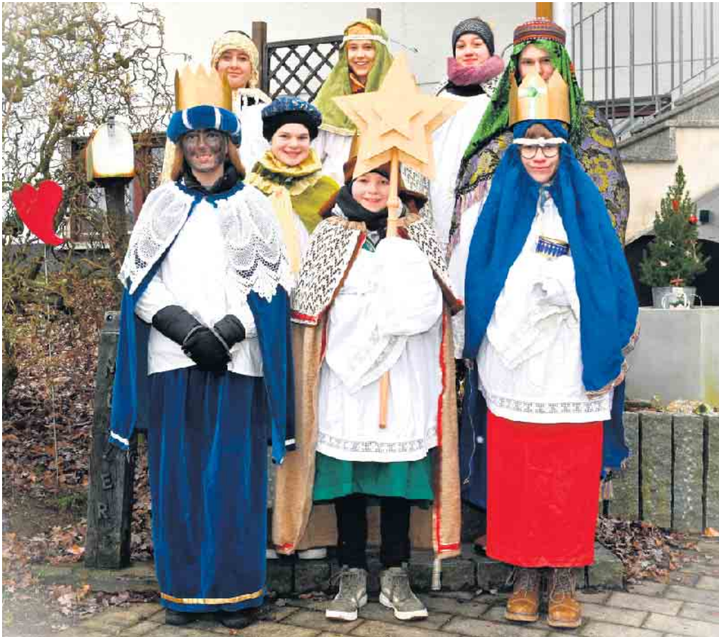
Sternsinger unterwegs von Haus zu Haus in Medebach-Berge, ausgesendet in der Vorabendmesse von Pfarrer Dr. Funder.

Ausgesendet in der Vorabendmesse von Pfarrer Dr. Funder, brachten die Sternsinger den Segen zu den Häusern. Beim gemeinsamen Singen waren die Hausbewohner begeistert und bedankten sich für den Segen mit großzügigen Spenden. Mit diesen sollen Kinder und Jugendliche in Amazonien erreicht werden, unter dem Leitsatz „Gemeinsam für unser Erde - in Amazonien und weltweit“.