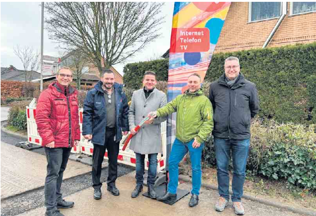
Gut vorbereitet ist eine Winterwanderung auf dem Rothaarsteig eine nachhaltige Auszeit für Körper und Geist.

Für Winterwanderungen mehr Zeit einplanen Wanderungen im Winter und Sommer sind nicht vergleichbar, denn das Laufen ist im Schnee anstrengender. „Wandernde sind daher langsamer unterwegs und sollten für ihre Tour mehr Zeit einplanen“, rät Ilka Robke, die darauf aufmerksam macht, dass es sein könne, dass Wandernde auch mal durch tieferen Schnee gehen müssen. Der Rothaarsteig ist nicht auf der kompletten Strecke präpariert. Sie empfiehlt, Wanderstöcke für besseren Halt mitzunehmen. Wichtig sei es zudem, den Blick immer mal nach oben zu lenken. Wenn viel Schnee auf den Bäumen liegt, könne es vereinzelt zu Schneebruch kommen, wissen die Expertinnen. Beim Wandern auf dem Rothaarsteig ist es wichtig, auf markierten Wegen zu bleiben. Insbesondere in den Wintermonaten sind sensible Lebensräume und Tiere besonders schutzbedürftig.