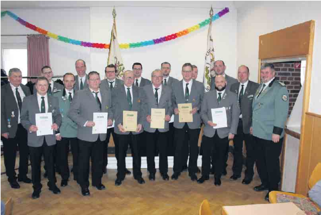
Verdiente Vorstandsmitglieder, die im vergangenen Jahr geehrt wurden.