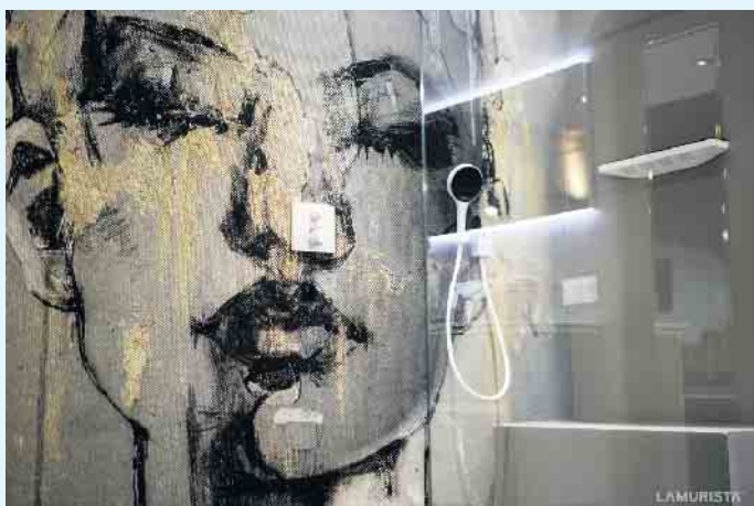
Tolle Wandgestaltung für den Nassraum

alte Fliesenbeläge überarbeitet werden können. Staub und Schmutz durch das Entfernen der alten Fliesen entfällt durch eine solche Maßnahme komplett. Ihr Malerbetrieb Schnorbus berät Sie gerne zu Ihrer individuellen, motivreichen und gleichzeitig fugenlosen Wandgestaltung in Ihrem Bad. [BL]