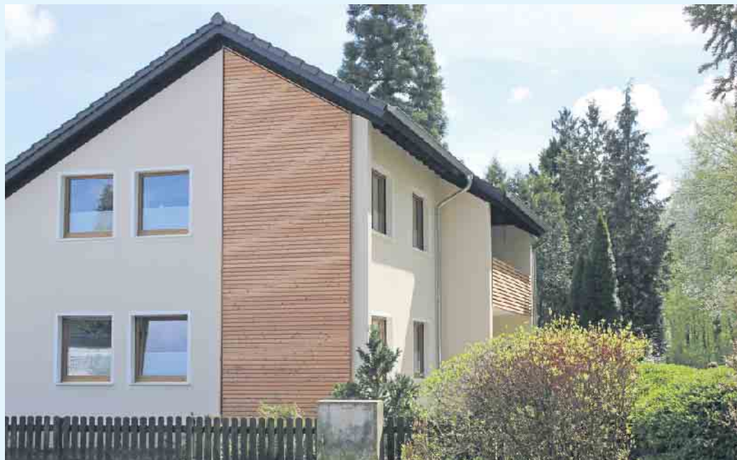
Natürlich mit Holz: Das Naturmaterial bietet fürs Bauen zahlreiche Vorteile in Sachen Umwelt- und Klimaschutz - und wertet das Zuhause auch optisch auf.

Heutige Anforderungen an Klimaeffizienz lassen sich gut mit dem Naturmaterial Holz erfüllen. Vollholzprofile ermöglichen nicht nur eine vielfältige Gestaltung der Hausfassade, sondern bilden gleichzeitig die Basis für eine moderne Wärmedämmung, da Holz von Natur aus ein schlechter