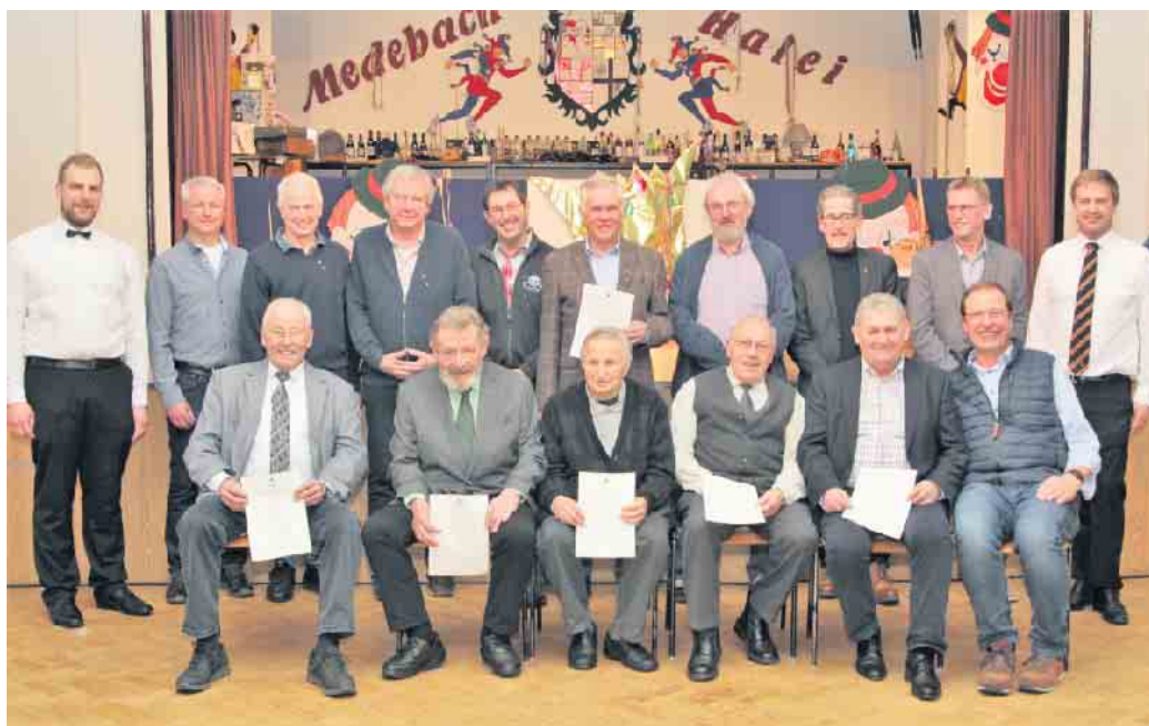
Die geehrten Kolping-Jubilare mit dem Kolping-Leitungsteam.