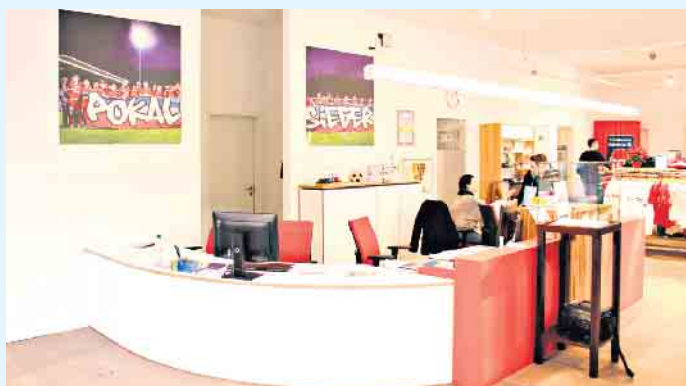
Vor dem Stadion des 1. FC Heidenheim hat Lehner Haus ein Vereinslokal und die Geschäftsstelle mit Fanshop des Zweitligisten gebaut.

Fertighaushersteller bauen mehr als nur Eigenheime