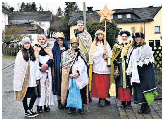
Sternsinger in Medebach-Berge unter dem Motto: „Kinder stärken, Kinder schützen“.