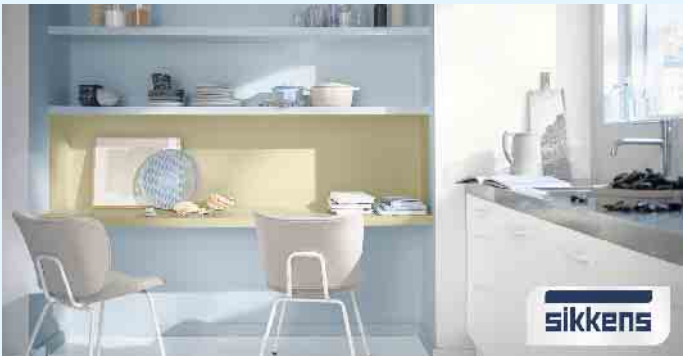
Küche in dezenten Blautönen

Ihr Malerbetrieb Schnorbus berät Sie gern zu Ihren individuellen Farbwünschen in Räumen und Fassaden. [BL]