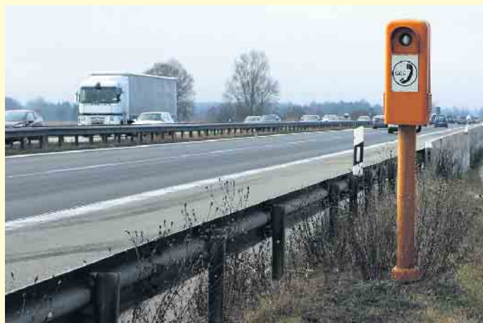
Alle zwei Kilometer steht eine Notrufsäule an der Autobahn. Ein Pfeil und eine Zahl auf den Leitpfosten geben Richtung und Abstand an.

Wer spricht? Seit 1999 landen die Anrufe beim Notruf der Auto-versicherer in Hamburg und werden an den zuständigen Notdienst weitergeleitet. Im Gegensatz zum Anruf per Handy braucht man sich dabei keine malerische