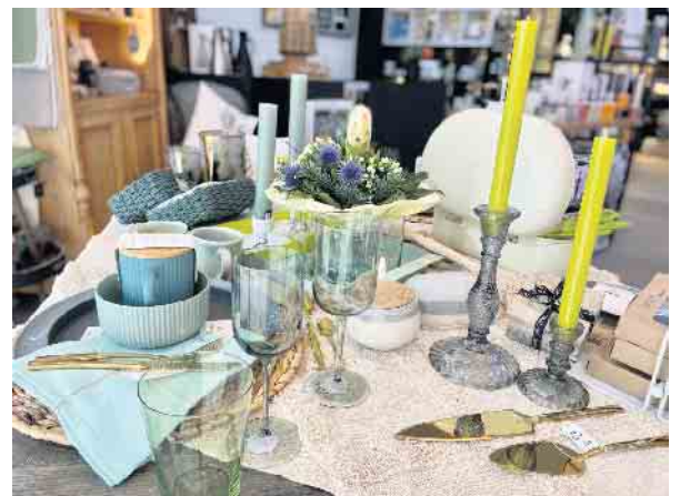
Die neue Geschirrserie von „chic.mic“ bei „Tischlein deck dich“

Aktuell erhältlich in verschiedenen Grüntönen und eukalyptusfarben bei „Tischlein deck dich“ an der Unteren Pforte, ganz zentral am Marktplatz von Winterberg gelegen. Darunter auch Backzubehör in knalligem grün von BIRKMANN, Kissen und Leinenservietten von IHR sowie farbige Gläser von blomus.- Alles individuell kombinierbar auch mit Geschirr und Tischdeko der Marken ASA, KÜCHENPROFI und REMEMBER. Der gut aufgestellte Laden „Tischlein deck dich“ hat neben den nachhaltigen Produkten noch weitere Haushaltswaren, Küchenhelfer, Geschirr, Besteck, Gläser, Tischwäsche, Wohnaccessoires und Deko von etwa 70 namhaften Herstellern im klassisch zeitlosen und ausgefallenen Stil vorrätig. [BL]