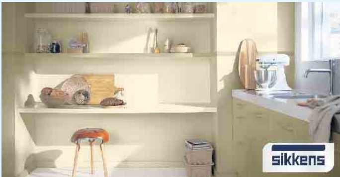
Küche in warmer Farbgestaltung

Für jeden gewünschten Farbton bietet das 5051 Color Concept von Sikkens unendliche Möglichkeiten der Farbkombination. Der Farbfächer umfasst stolze 2.079 Farbtöne. Darin enthalten sind nicht nur die beliebtesten Farbtöne, sondern auch mehr klassische Farbtöne an Off-Whites, Grautönen und gedeckten Farben. Die sorgfältige Farbwahl trägt in hohem Maße dazu