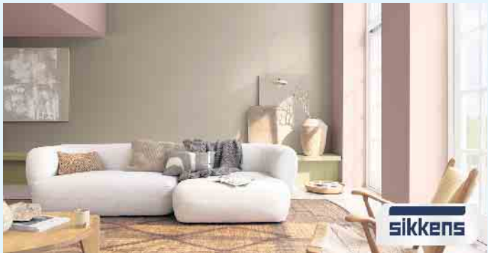
Wohnzimmer in angenehmen Farbtönen