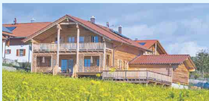
Privathäuser, Hotels und vieles mehr wird heute immer öfter in Holz-Fertigbauweise errichtet.

Konzepte für besondere Wohnge-sundheit und Barrierefreiheit werden immer öfter nachgefragt und angeboten. „Wir befinden uns in einer Frühphase der wirtschaftlichen Transformation, in der unternehmerisches Engagement für das Klima und für ein nachhaltiges Arbeitsumfeld noch einen echten Wettbewerbsvorteil bieten können. Wer sich für ein klimafreundliches Holz-Fertighaus entscheidet, fördert damit auch das Image seines Unternehmens“, schließt Hannott. (BDF/FT)