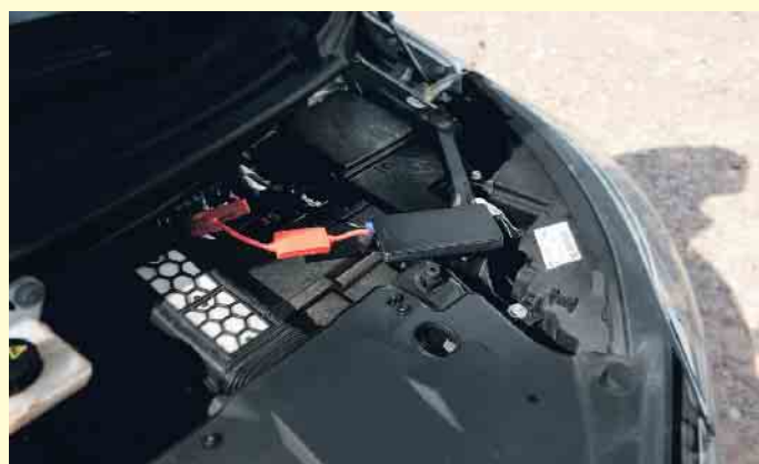
Akku-Booster in Aktion: Rote Polklemme an Plus, schwarze Polklemme an Minus, dann fließt der Strom.

Das Starthilfegerät sollte unbedingt über einen Schutz vor Kurzschlüssen verfügen. Damit wird Schlimmeres verhindert, wenn sich beide Polzangen bei eingeschaltetem Booster berühren.