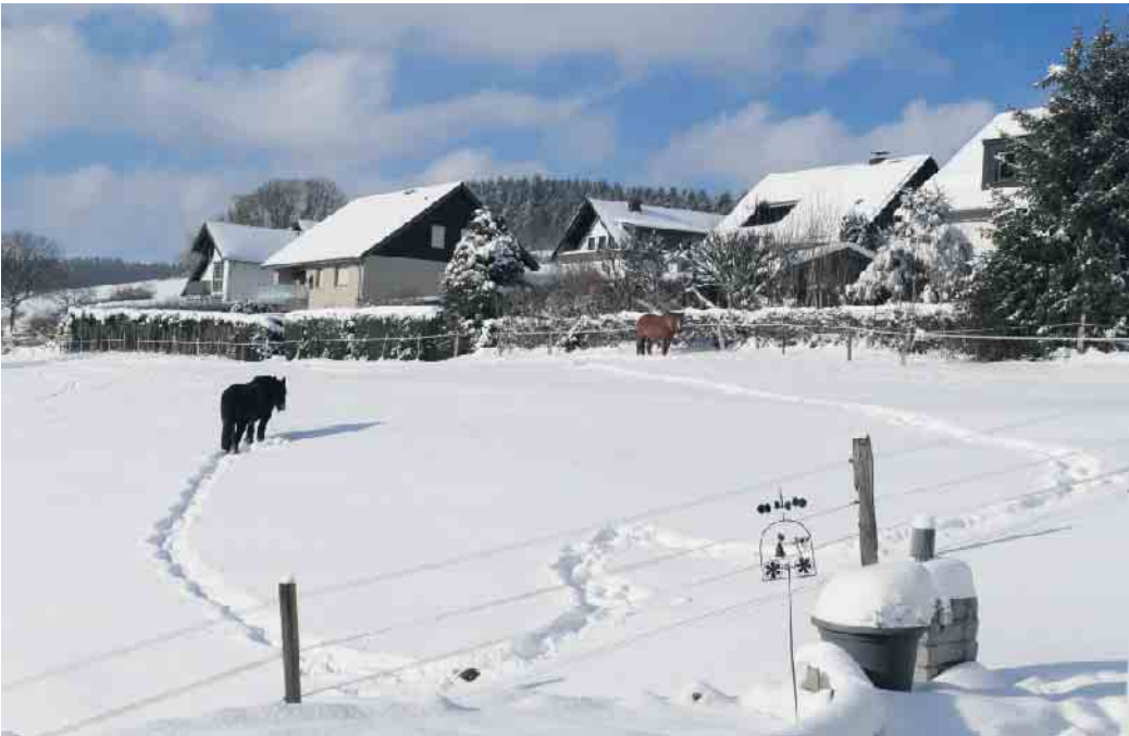
Winter in Oberschledorn.