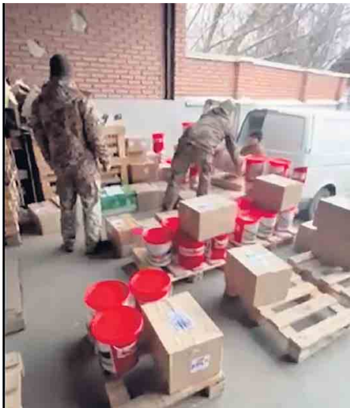
Eimer werden im Verteilzentrum in Lwiw umgeladen für Weiterlieferung

Schreiben von betroffenen Familien im Bezirk Pokrowski erreicht. Hier aus dem Originaltext übersetzt: