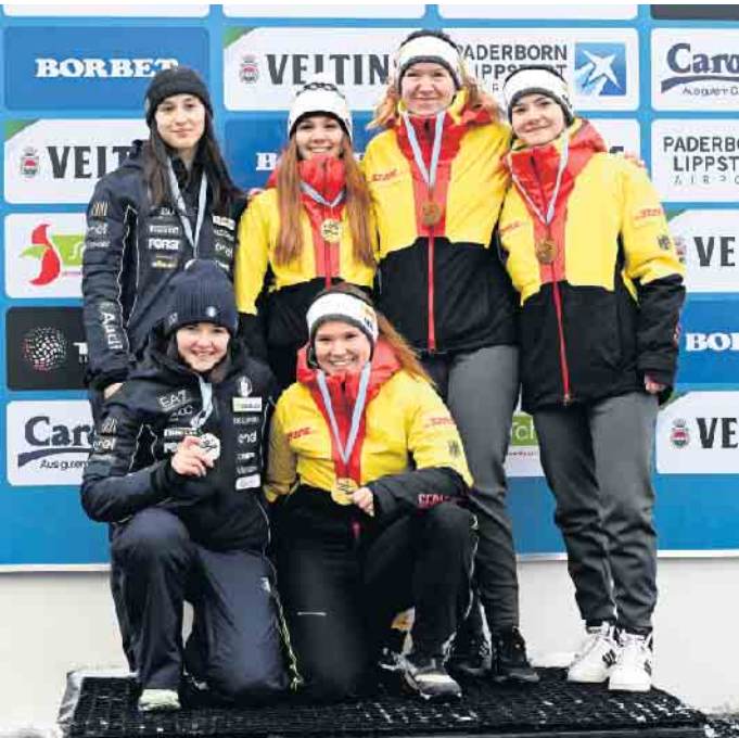
Podium Damen Doppelsitzer.