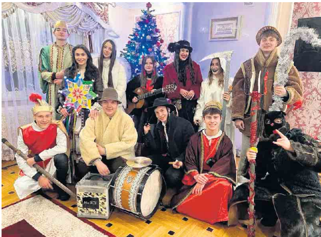
Christliche Menschen in der Ukraine feiern das Weihnachtsfest