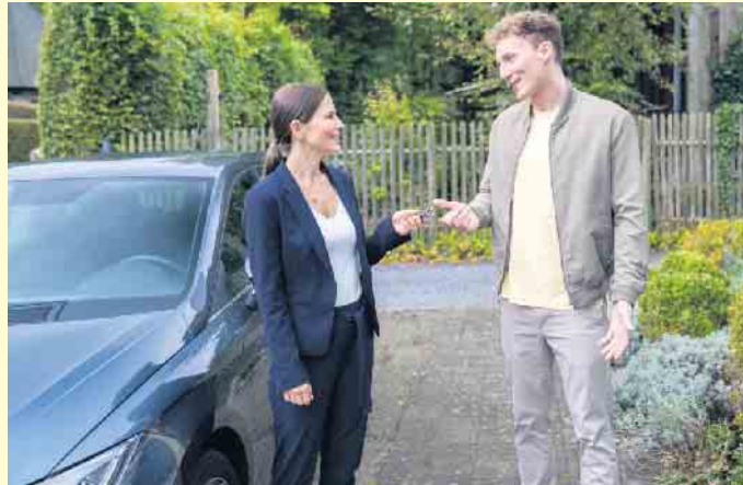
Beim Autokauf ist für mehr als Dreiviertel der Deutschen der Preis das wichtigste Kriterium.

Schon heute sind Pkw mit Elektromotor bei den laufenden Kosten attraktiver als Verbrenner. So sind die Ausgaben für den benötigten Strom geringer als die für Benzin oder Diesel, wenn man die Möglichkeit hat, sein Auto zu Hau-