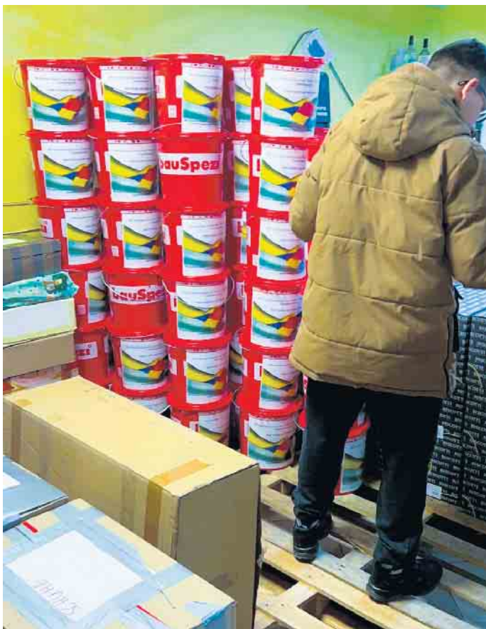
Eimer gefüllt mit Hygienartikeln aus Wulmeringhausen.

Medebach: Kaffee Langen, Firma Paul Köster GmbH, Ewers Strümpfe GmbH, Firma Brass Oberschledorn, Weihnachtszauber Medebach, Peter Schulte (Lagerraum)