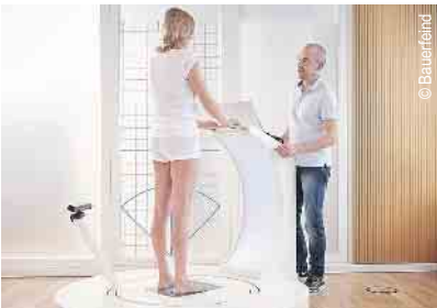
3D-Vermessung für Kompressions- strümpfe und orthop. Einlagen

Öffnungszeiten: Montag, Dienstag, Donnerstag und Freitag 09.00 bis 13.00 Uhr und 14.30 bis 18.00 Uhr | Mittwoch 09.00 bis 13.00 Uhr | Samstag geschlossen