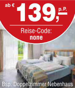
Bsp. Doppelzimmer Nebenhaus