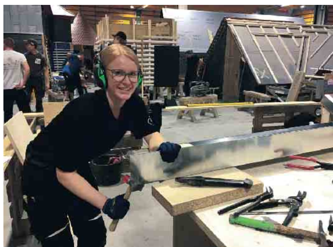
Im Dachdeckerhandwerk ist nicht mehr nur reine Muskelkraft gefragt. Dafür aber vielseitige Fähigkeiten, die den Beruf zunehmend für Frauen interessant machen.