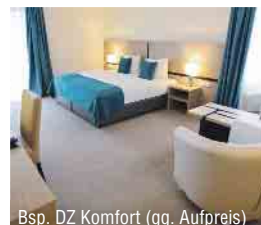
Bsp. DZ Komfort (gg. Aufpreis)