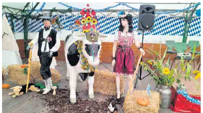
Mit viel Liebe zum Detail stellte die Gemeinschaft Ü60 den Almbetrieb dar.

drucksvoll belegte. Mit verschiedenen Aktionen wie zum Beispiel das „Bierkrug-Stemmen“ wurden die zahlreichen Gäste unterhalten. Nach einer Stärkung am bayerischen Büfett, das liebevoll vom Vorstand und seinem Team vorbereitet worden war, spielten die „Feldbergmusikanten“ aus Höxter-Stahle auf. Diese Stimmungsband unterhielt die Gäste mit zünftiger Alpenmusik und sorgte somit für gute Stimmung. An diesem Nachmittag kamen garantiert alle Liebhaber von bayrischer Musik voll auf ihre Kosten. Denn mit ihrem Auftritt trafen die „Feldbergmusikanten“ voll den Musikgeschmack des Publikums, das es nicht mehr auf den Sitzen hielt. Lautstark wurden bekannte Liedtexte mitgesungen und die musikalische Darbietung verstärkt.