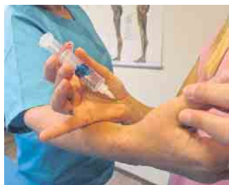
Auch die Eigenbluttherapie gehört zum erweiterten Portfolio.