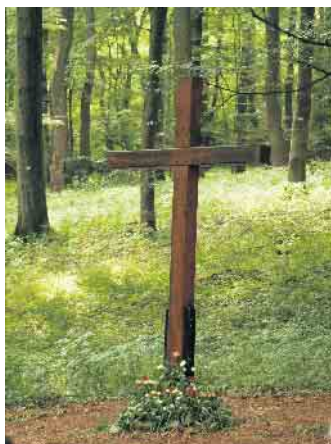
Das Kreuz im Zentrum des Naturfriedhofes lädt zum Innehalten ein.

(sie) Urnenbeisetzungen in der Natur gelten inzwischen als fester Bestandteil der deutschen Bestattungskultur. Auch in der Gemeinde Nieheim gibt es seit 2009 einen Naturfriedhof. Hier können Menschen Ruheplätze unter Partner-, Gemeinschafts-, Familien- oder Einzelbäumen erwerben.