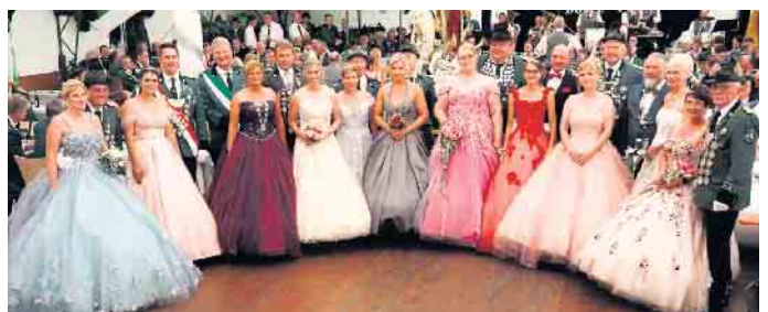
Königlicher Glanz erstrahlte beim offiziellen Foto mit allen anwesenden Königspaaren. Die Gastgeber sind als fünfte von rechts zu sehen.

Altenbergen und Kollerbeck sowie der Musikverein Bökendorf mit flotter Marschmusik.