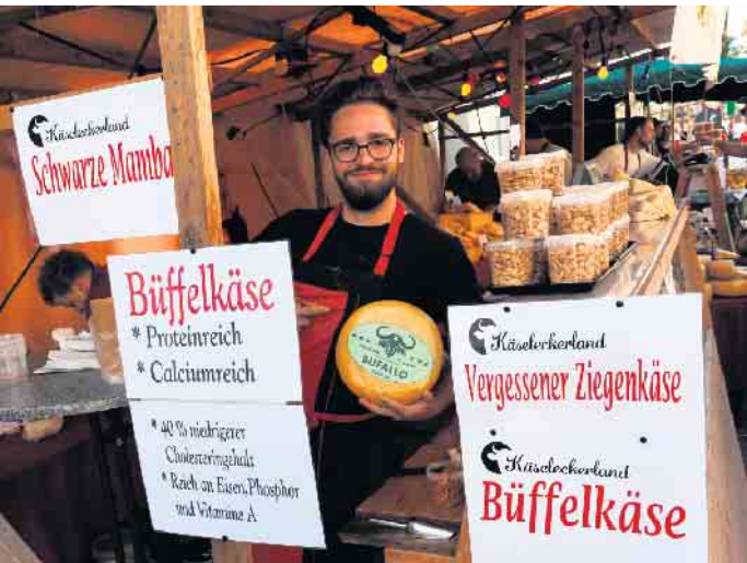
Sind Mamba- und Büffelkäse so gut, dass sie den Ziegenkäse vergessen lassen?

unermüdlich mit charmantem Lächeln in den vollen Straßen für einen Besuch im Raum des Geschmacks sowie für deftigen Käse, belebende Weine und italienische Köstlichkeiten. „Nieheim hat sich wieder glänzend verkauft“, war dazu die Meinung eines aus Hannover angereisten Besuchers, dessen Begleiterin anmerkte, dass sie und ihr Mann bereits zum dritten Mal bei einem Käsemarkt in Nieheim dabei sind. Augenfällig war der Einsatz der ehren-amtlichen, überall in der Stadt anzutreffenden Helferinnen und Helfer. Laut Mitteilung der Fachbereichs Wirtschaft zählte die Stadt Nieheim gut 10.000 Besucher