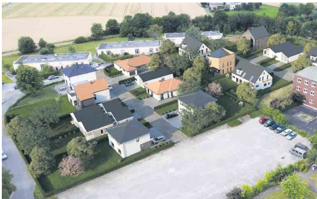
Grundstücksaufteilung Baugebiet Brakel Lütkerlinde

Weitere Informationen finden Sie auf der Projektseite unter www.lütkerlinde.de .