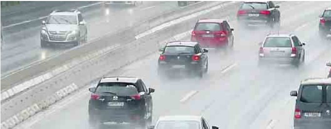
Starkregen kann zur echten Gefahr für Autofahrer werden.

troffene selbst für den Schaden aufkommen. Bei abgestellten Fahrzeugen erfolgt die Schadenregulierung über die Teilkaskoversicherung. Hier prüfen die Versicherer allerdings, ob die Möglichkeit bestand, das Auto rechtzeitig aus dem Überschwemmungsgebiet zu fahren. Ob und welche Versicherung eintritt, hängt laut ADAC auch vom Fahrverhalten ab. Für einen durch Einfahren in eine überflutete Straße entstandenen Motorschaden tritt grundsätzlich die Vollkaskoversicherung ein. Allerdings kann die Versicherung bei grober