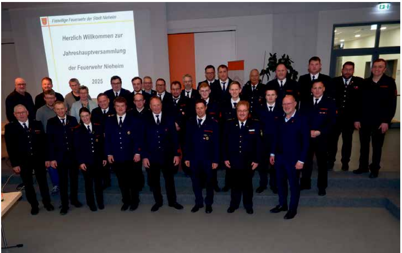
Siehe Text

Ein starkes Team - die freiwillige Feuerwehr Nieheim