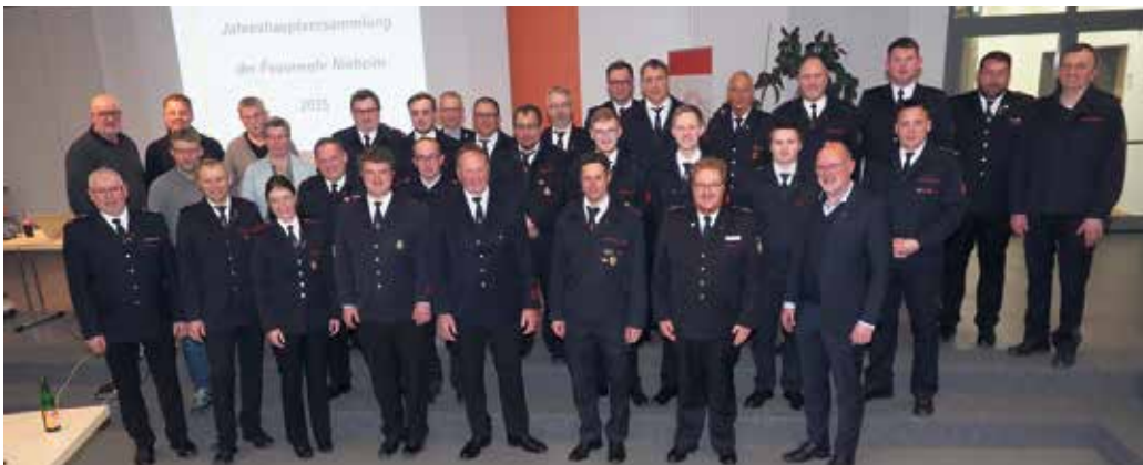
Ein gemeinsames Foto von Menschen mit einem gemeinsamen Ziel: Freiwillige Feuerwehr, Stadtrat und Stadtverwaltung.

Das will die Freiwillige Feuerwehr der Stadt Nieheim auch weiterhin mit ganzer Kraft