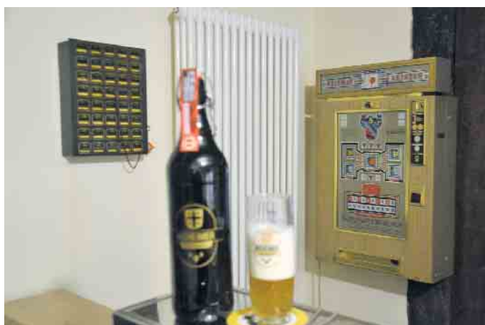
Ein Sparschrank und der Geldspielautomat gehörten früher zur Grundausrüstung einer Dorfkneipe

täuscht, wenn man sich näher mit dieser Thematik auseinandersetzt. Hin und wieder Alkohol zu trinken ist für viele Menschen in Deutschland gang und gäbe. Doch was macht Alkohol eigentlich in unserem Körper? Bis zu welcher Menge gilt der Konsum als gesundheitlich wenig riskant? Und welche körperlichen, psychischen und sozialen Folgen kann es haben, wenn man zu viel Alkohol trinkt? Das Biermuseum öffnet auf Anfrage, am besten per E-mail ( info@nieheimer-bier.de ). Sonntags gibt es eine kombinierte Eintrittskarte mit dem Käse- und Sackmuseum; um 14 Uhr besteht die Möglichkeit zur Teilnahme an einer kostenlosen Führung durch alle Museen. Das Escapegame und die Westfälische Bierverskostung können über die Homepage www.nieheimer-bier.de online gebucht werden.