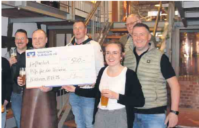
Der Vorstand der Bürgerbrauzunft überreicht einen Spende in Höhe von 500 Euro für die Ukraine-Hilfe

Die schon zahlreich erschienenen Gäste bestaunten im Laufe des Tages die Theke aus den 1960er Jahren, die beim Bockbieranstich seine Feuertaufe bestanden hat. Inzwischen hat der neue Ausstellungsbereich durch Einrichtungsgegenstände aus der ehe-