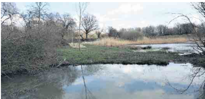
Natur beobachten und genießen! Wer diesen Wunsch hat, ist hier immer richtig.

ermöglicht. Wer gelernt hat, sich in Geduld zu üben, der kann hier Wildgänse, Enten, Grau- und Silberreiher beobachten. Gäste sind Meister Adebar und ab und zu ein Kormoran. Ob sich der vor wenigen Jahren hier aufhaltende Fischadler erneut zeigen wird, bleibt abzuwarten. Auf ihre Kosten werden ganz sicher auch „Konzertliebhaber“ kommen, denn neben den Chören der in Bäumen, Buschwerk und Röhricht singenden gefiederten Freunde,