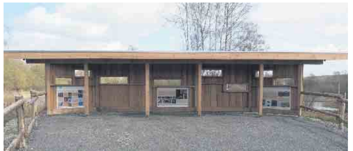
Von der neu geschaffenen Aussichtskanzel haben Besucher einen wunderbaren Blick auf die Teiche und ihre Bewohner.

gehören die Froschkonzerte im Frühjahr zu den schönsten Klängen der Natur. Besonders reizvoll sind die ein Stück weit in die Tongruben hineinführenden Schotterwege. Auf ihnen gelangt man nahe ans Wasser und befindet sich an einigen Stellen unmittelbar neben Röhricht, Schilf oder Weidengebüsch. Erläuterungen zum einmaligen Umfeld und zu dessen Besonderheiten erhalten die Besucher mittels mehrerer, an den Zaunpfählen angebrachter