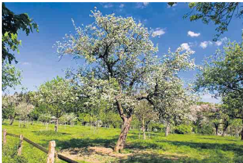
Bald leuchten die Streuobstwiesen wieder in voller Blüte - für eine hoffentlich gute Ernte 2023.

ein Gefühl für die Akzeptanz und Resonanz entwickelt. Wir sind weiter bestrebt die Produktpalette noch breiter aufzustellen, um die Pflegearbeiten dauerhaft zu sichern.“ Vom Apfelsaft gehen wieder volle 12 Cent pro Flasche ohne Umwege in die Obstbestände. Auch die Beste-Stadtwerke haben diesen wichtigen Beitrag zum Kulturlandschaftserhalt erkannt und unterstützen das Gesamtprojekt aktiv.