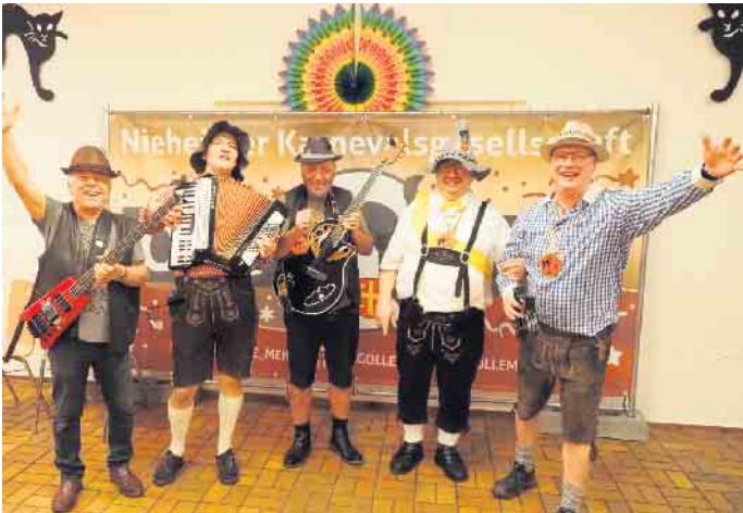
Immer wieder schöne Lieder sangen die nur äußerlich in die Jahre gekommenen Nieheimer Bergmusikanten.