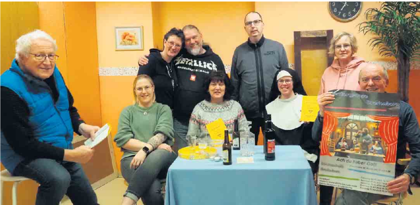
Die Theatergruppe Bredenborn präsentiert sich mit bairischem Dialekt und katholischer Scheinheiligkeit. (Bericht im Innenteil)

Neues Theaterstück wird im März aufgeführt