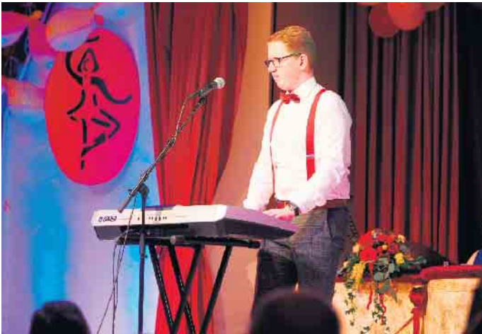
Er war der große „Lockermacher“ der ersten Stunde. DJ Pütti begeisterte mit spitzbübischen Reimen zu den gerne versteckten Alltagslügen. Damit war er der große „Lockermacher“ der ersten Stunde.