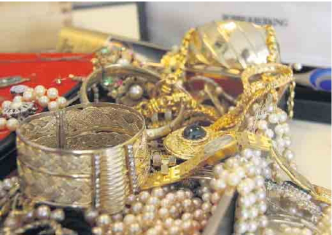
Ansprechpartner für die Wertermittlung von Schmuck, Münzen oder Edelsteinen.

Weitere Informationen gibt es auch im Internet unter www.padergold.de .