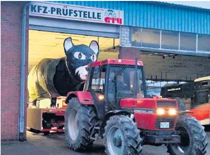
„Alles gut“, hieß es nach der Untersuchung beim Katzen-Doc des GTÜ.

Nachmittag: Aufstellen der Wanderkatze 14. Februar, 19 Uhr Eröffnung Schmiedefeuer (Ofenzentrum) 16. Februar, 14.11 Uhr Kinderkarneval -KiKaKo (Stadthalle) 21. Februar, 19.31 Uhr Frauenkarneval -FKK (Stadthalle) 27. Februar, 11.11 Uhr Weiberfastnacht / Rathaussturm 1. März , 19.31 Uhr Galaabend der NKG (Stadthalle) 3. März, 10.11 Uhr Rosenmontag