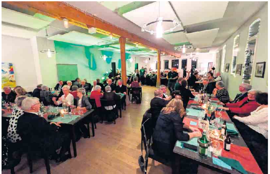
Im festlich geschmückten „alten Kornboden“ auf dem Gut Holzhausen ließ es sich gut feiern.

Nach einem abwechslungsreichen Buffet vom Klosterkrug Marienmünster stand ein Auftritt des be-