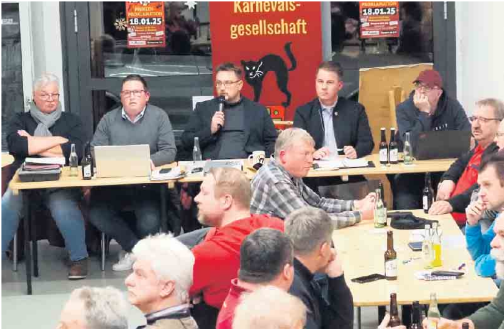
Als starkes Team präsentierten sich Vorstand und Ressortleiter der NKG bei der Planung der närrischen Aktivitäten.