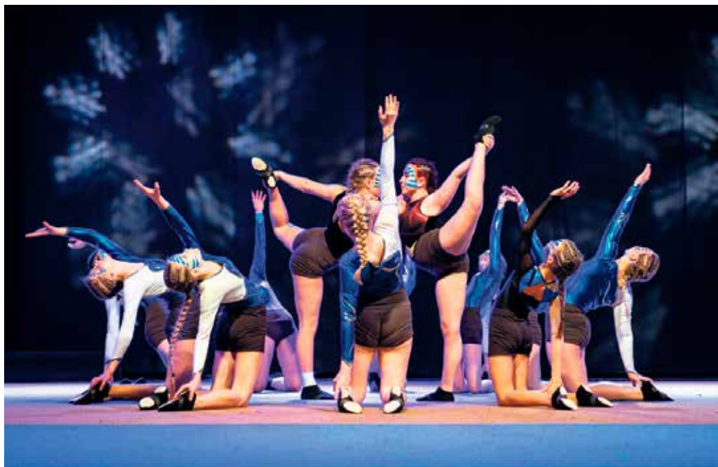
Gelungene Choreographie der jungen Artistinnen