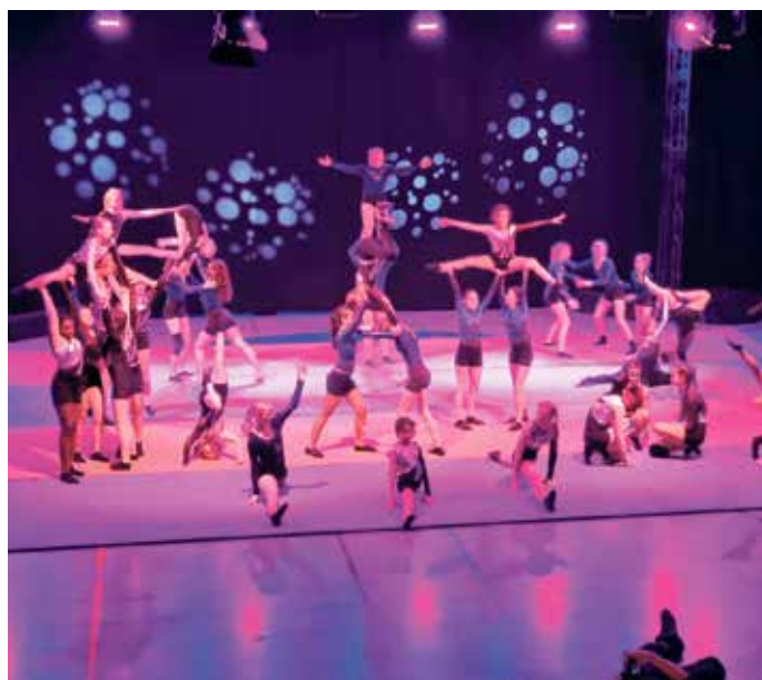
Zirkus Traumland in Aktion.