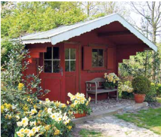
Wir genießen die stärkere Sonneneinstrahlung im Frühling und freuen uns an Austrieb und Blüte der Pflanzen.

„Viele unserer Kundinnen und Kunden kennen inzwischen die Regel: Wenn die Forsythien blühen, werden die Rosen geschnitten“, berichtet Armin Knauer und ergänzt: „Hierbei ist wichtig zu wissen, dass im Zeitraum vom 1. März bis zum 30. September laut Bundesnaturschutzgesetz auch in privaten Gärten nur ein schonender Form- und Pflegeschnitt erlaubt ist, um brütende Vögel zu schützen.“