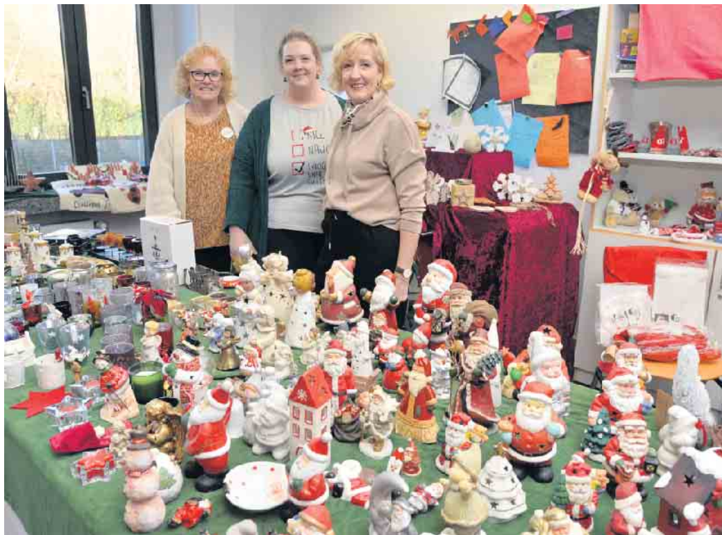
Es gibt viele schöne Verkaufsstände beim Weihnachtsbasar der Lichtbrücke.

Am ersten Adventswochenende findet auch in diesem Jahr wieder der traditionelle Weihnachtsbasar der Lichtbrücke im Aggertal-Gymnasium in Engelskirchen statt. Tausende Besucher aus nah und fern werden sich an den vielen bunt geschmückten Ständen erfreuen. Über 30 ehrenamtliche Gruppen und Initiativen bereiten sich seit Wochen auf dieses Ereignis vor. Mit viel Liebe und Geduld zaubern sie ein buntes Programm. Das vielfältige Angebot reicht von Tausenden Büchern, gut erhaltener Second-Hand-Kleidung und hochwertigem Trödel bis hin zu kunstgewerblichen Handarbeiten. Es gibt märchenhafte Geschenke, selbst gemachte Marmeladen, Liköre, Plätzchen, Holz- und Bastelarbeiten, Strickwaren, zauberhaften Adventsschmuck, Spielzeug, Puppensachen und -kleidung in allen Größen, Fair-Handels-Waren und eine Tombola erfreut mit tollen Preisen. (Gewinne können auf dem Basar bis spätestens Sonntag, 17 Uhr, abgeholt werden.) Auch für das leibliche Wohl ist bestens gesorgt: Grillwurst, Pommes, Salate, Bockwürstchen, Erbsensuppe, Kassler, Schupfnudeln