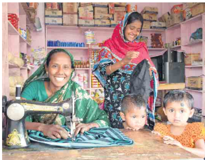
Der Erlös des Weihnachtsbasars kommt ärmsten Familien in Bangladesch zugute.