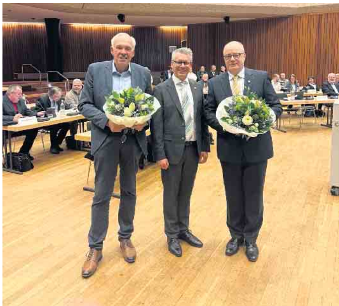
Bürgermeister mit stellvertretenden Bürgermeistern

Vier Frauen und vier Männer in der Ratsfraktion für die SPD-Lindlar