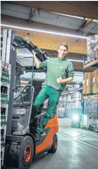
Der innerbetriebliche Transport erfolgt mit modernen Flurfördermitteln, die eingesetzten Gabelstapler können sechs Paletten gleichzeitig transportieren.