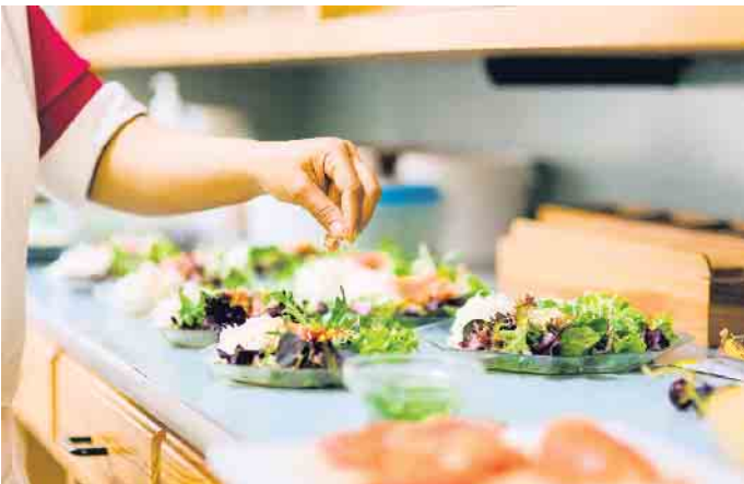
Fokus auf Gemüse: Beim Basenfasten gleicht der Körper den Säure-Basen-Haushalt wieder aus.

Versprochen: beste Beratung, bester Schlaf!