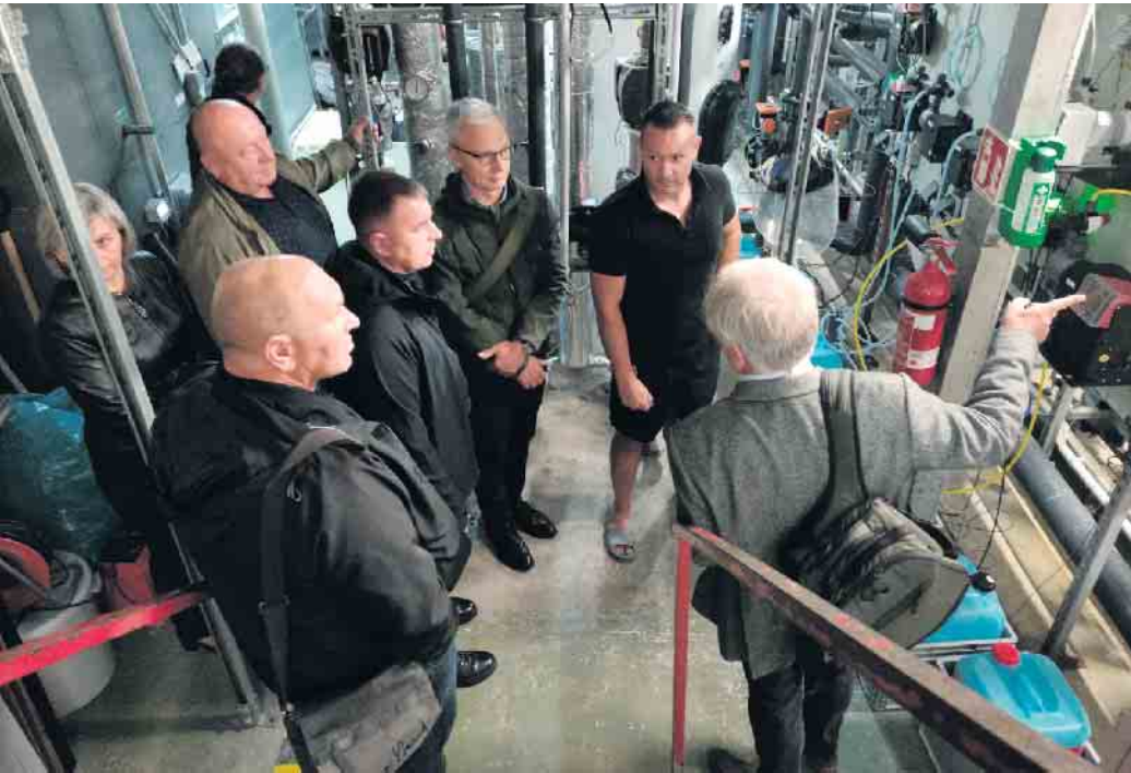
Die Gruppe informierte sich im Rahmen des Besuchsprogramms auch über die Technik des Lindlarer Hallenbads. gab es eine gemeinsame Fahrt nach Köln. Eine finanzielle Förderung der Delegationsreise erfolgte durch Engagement Global mit ihrer Servicestelle Kommunen in der Einen Welt (SKEW) mit Mitteln des Bundesministeriums für wirtschaftliche Zusammenarbeit und Entwicklung (BMZ). Ein wirklich gelungener Besuch und ein wichtiger Beitrag zum weiteren Ausbau der Städtepartnerschaft, die seit April 2023 besteht!

Ein Highlight zu Beginn des Besuchs war die Benennung des Radomyschl-Platzes vor dem Kulturzentrum. Die Gruppe absolvierte eine Vielzahl von Arbeitsterminen und Informationsbesuchen bei Einrichtungen der Gemeinde wie Rathaus, Schulzentrum, Hallenbad, Sportanlagen, Gemeindebücherei sowie in Lindlarer Firmen, auf:metabolon und im BGS-Steinbruch und traf sich zu Gesprächen mit dem Landtagsabgeordneten und dem Bundestagsabgeordneten. Am 3. Oktober, dem Feiertag,