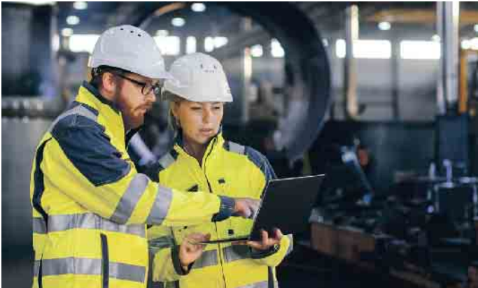
Ingenieure in der Kupferindustrie planen und optimieren Produktionsprozessen und tragen maßgeblich zur Entwicklung nachhaltiger Technologien bei.

einer Bruttowertschöpfung von 216 Milliarden einen wichtigen Wirtschaftsfaktor in Deutschland dar. Kupfer ist elementar für zahlreiche Branchen: im Bauwesen (Sanitärinstallationen, Dachdeckungen, Heizungs- und Kühlsysteme, elektrische Verkabelungen), in der Elektronik (Leiterplatten, Drähte, Kabel), in der Energiebranche (Transformatoren, Elektromotoren, Generatoren, Solar- und Windkraftanlagen) und im Transportsektor (Batterien, Elektromotoren, Verkabelungen in Elektrofahrzeugen). Zudem ist Kupfer zentral in Telekommunikationssystemen und Internetinfrastrukturen sowie in der Produktion von Photovoltaik-Paneele und Windturbinen.