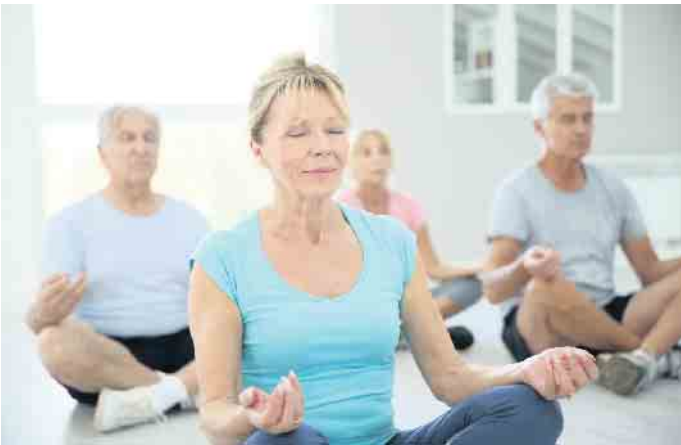
Wer regelmäßig meditiert, ist gelassener, konzentrierter und selbstbewusster.