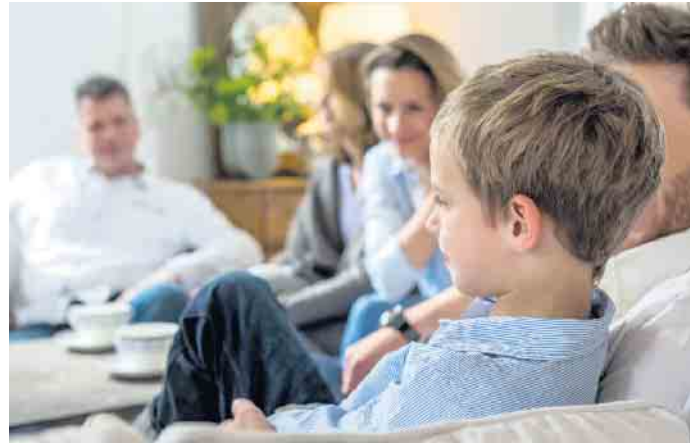
Hörprobleme bei Kindern können zu Rückzug und nachlassenden Schulleistungen führen.

Etwa zwei von 1.000 Kindern in Deutschland werden mit einer Hörstörung geboren. Das kann weitreichende Folgen haben, denn gutes Hören ist Voraussetzung für den Spracherwerb. Medizinischen Erkenntnissen zufolge werden die Grundlagen dafür schon im Alter von vier bis sechs Monaten gelegt. Je eher ein Hörschaden erkannt und behandelt wird, desto besser ist dies für die Sprachentwicklung. Deshalb wird heute schon bei Neugeborenen ein Hörscreening durchgeführt und auch bei den späteren Kinder-Vorsorgeuntersuchungen werden die Ohren regelmäßig getestet. Eltern sollten diese Untersuchungen mit ihren Kindern unbedingt wahrnehmen und