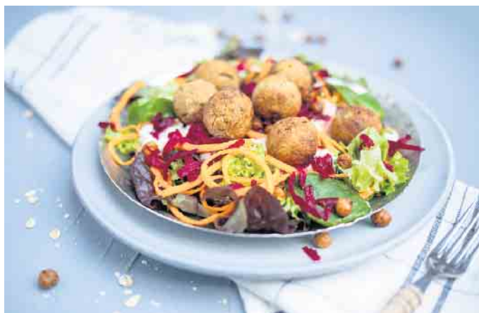
Hafermahlzeiten wie eine Salat-Bowl mit Haferbällchen lassen sich gut vorbereiten.

Neu beim aktuellen Meal-Prep-Trend ist, dass man ganz bewusst frische gesunde Zutaten verwendet. So lassen sich beispielsweise zahlreiche Gerichte und Snacks mit Hafer gut vorbereiten und mitnehmen. Die Vollkornflocken liefern dem Körper wertvolle Bal-