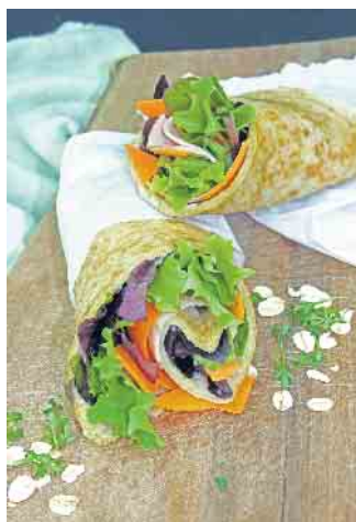
Für die gesunde Mittagspause sind Hafer-Wraps genau das Richtige.