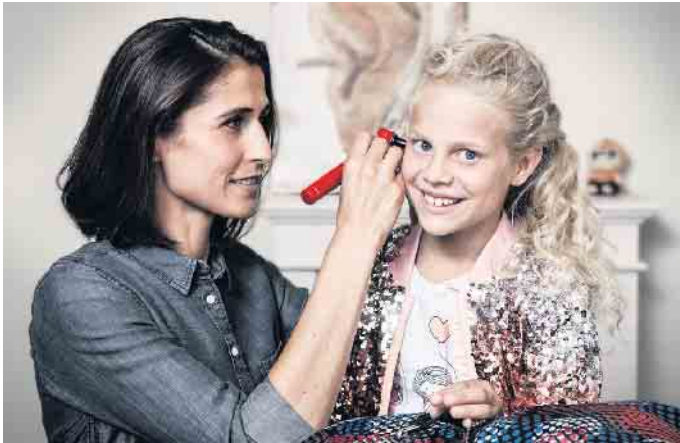
Bei Grundschulkindern treten oft vorübergehende Hörminderungen durch Erkrankungen auf. Regelmäßige Hörtests sind deshalb wichtig.

Unerkannte Hörstörungen können bei Kindern Sprach- und Schulprobleme auslösen