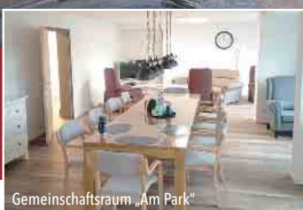
Gemeinschaftsraum „Am Park“