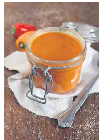
Die Paprikacremesuppe kann man portionsweise mitnehmen und aufwärmen.