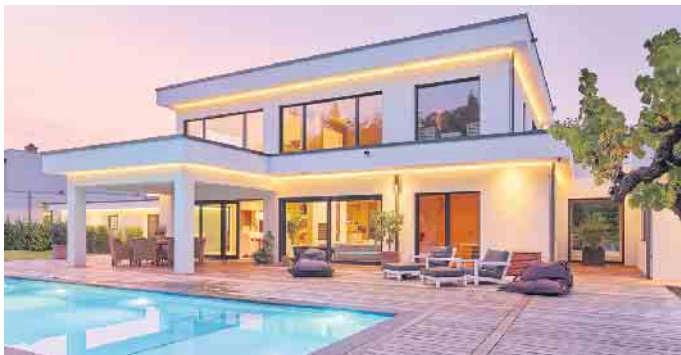
„Die Bauhausarchitektur ist Ausdruck von Individualität und Stilsicherheit.“

und planungssicher in ihrem individuellen Traumhaus an“, schließt Tews. (BDF/FT)