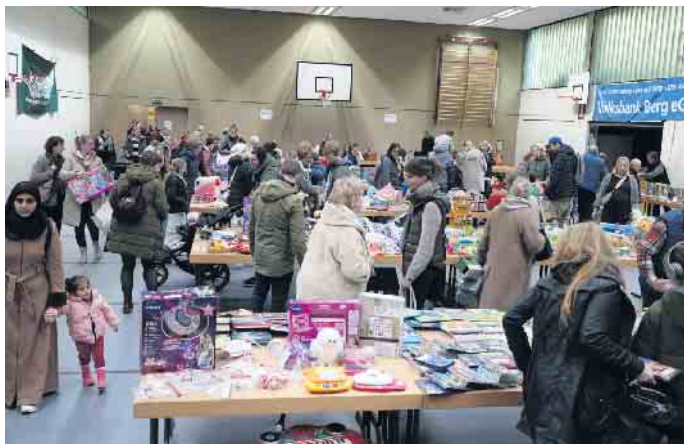
Secondhand-Spielwarenbasar im November 2024 in Frielingsdorf

Kolpingsfamilien Frielingsdorf und Lindlar haben fusioniert