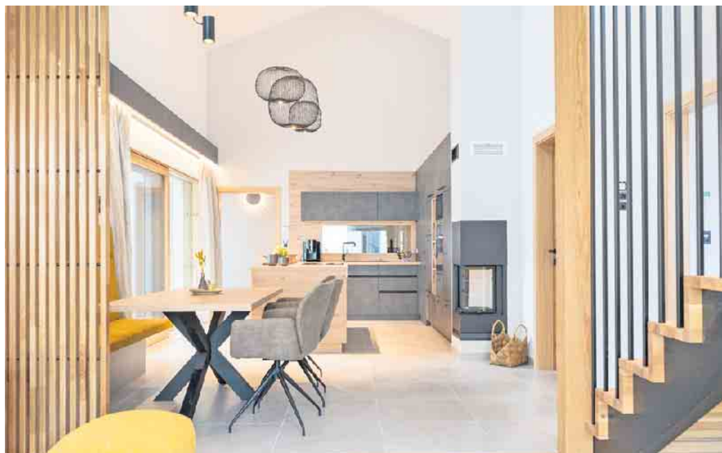
Unterschiedlich zonierte Bereiche und kurze Wege zwischen Küche, Essen und Wohnen unterstützen einen reibungslosen Familienalltag.

Tageslicht schafft Lebensqualität Natürliches Sonnenlicht ist ein zentraler Wohlfühlfaktor und fördert die Wohngesundheit, wenn es ins Haus gelangt. Großzügige Fensterflächen, die Ausrichtung des Gebäudes sowie offene Grundrisskonzepte sorgen für helle Räume und ein angenehmes Raumklima. Schon in der Planung sollte man auf die Lichtverhältnisse achten und eine gesunde Balance zwischen Tageslicht und einem effektiven Schutz vor Sommerhitze finden. Fensterflächen sind zudem nicht nur Gestaltungselemente, sie beeinflussen auch die Energieeffizienz eines Hauses. Bei vielen Fenstern sollte man ebenso bedenken, dass auch Wandflächen für Schränke und Ähnliches nötig sind. Trotz Transparenz braucht es zudem geschützte Bereiche ohne Einblicke für ein sicheres und angenehmes Wohngefühl.