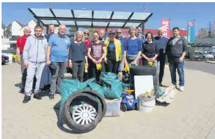
Erfolgreicher Dorfputz in Frielingsdorf im Frühjahr