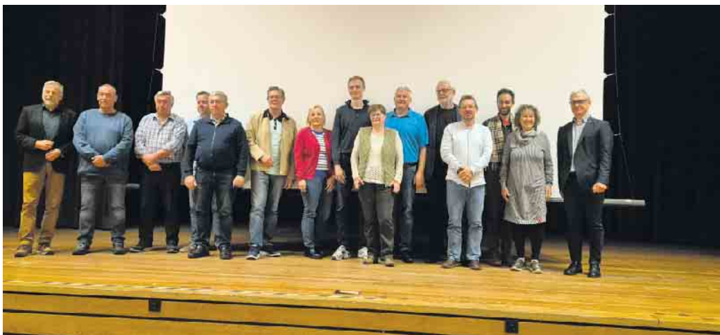
Groß ist die Zahl der Ratsmitglieder, die den Rat nun verlassen. Der neue Rat wird nur noch 32 statt 36 Sitze haben.