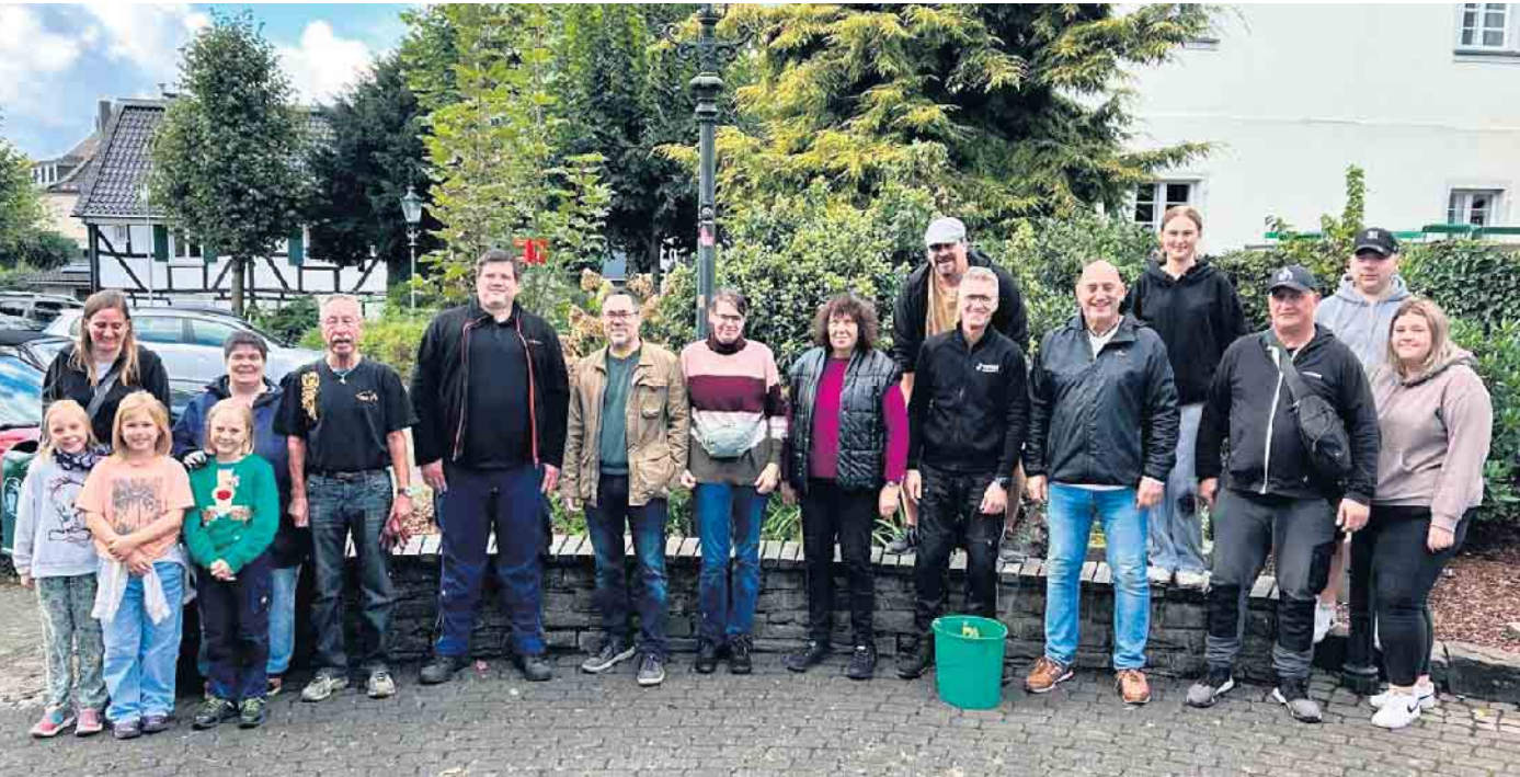
Viele fleißige Hände halfen beim Lindlarer Herbstputz mit.

Ende September folgten zahlreiche Helferinnen und Helfer dem Aufruf zum Lindlarer Herbstputz.