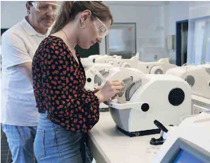
Brillenschliff, Reparatur und Anpassung - nur ein paar Dinge, die Augenoptiker-Auszubildene innerhalb von drei Jahren lernen

Der Weg in die Augenoptik beginnt mit einer dualen Ausbildung im Betrieb und in der Berufsschule. In drei Jahren lernen Auszubildende den Beruf von der Pike auf. Nach bestandener Gesellenprüfung stehen alle Türen zur indivi-