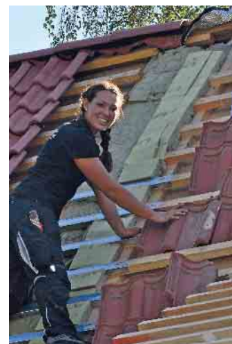
Dachdeckerinnen sind auf dem Vormarsch: schweres Tragen ist out, das übernehmen Lastenaufzüge.

Als Einstieg in die Dachdecker-Ausbildung wird ein Schülerpraktikum empfohlen. Viele Dachdeckerbetriebe bieten Schnuppertage an, informieren auf Azubimesen über den Beruf oder nehmen am Girls' Day teil. Denn der Beruf ist durchaus auch für Frauen geeignet, das zeigt auch der Anstieg bei den weiblichen Azubis: Plus 30 Prozent im Vergleich zum Vorjahr. Gute Voraussetzungen sind neben handwerklichem Geschick ein mathematisches Grundverständnis und Teamfähigkeit. Wer zudem noch gern draußen arbeitet und dazu beitragen will, dass unser Klima besser wird, ist im Dachdeckerhandwerk genau richtig! (akz-o)