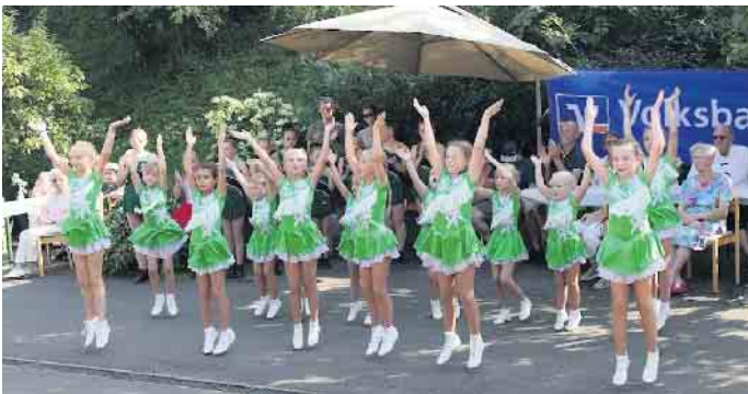
Tanzmäuse des TUS Lindlar