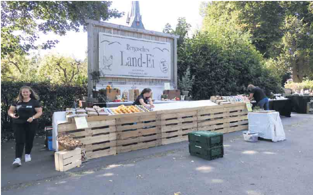
Feierabendmarkt unter dem Kirchturm in Lindlar-Linde

Am 1. September konnten wir in Lindlar-Linde das einjährige Bestehen des Dorfgemeinschaftshauses Linder Treff feiern. Vor genau einem Jahr wurde das kath. Pfarrheim in die Trägerschaft des Bürgervereins Linde e.V. übergeben. Die Vorbereitung des Trägerwechsels durch die Quartiersentwicklung im ländlichen Raum, die unter lebhafter Beteiligung Linder Bürger:innen stattgefunden hatte führte zu einem zukunftsweisenden Resultat. In diesem ersten Jahr nun konnte durch die zahlreiche und tatkräftige Unterstützung aus der Dorfgemeinschaft sowie durch zahlreiche Spenden viele Projekte umgesetzt werden. Eine Toilette wurde behindertengerecht umgebaut, im großen Saal wurde die Akustik durch Schallmassnahmen verbessert, ein Bouleplatz entstand und die Terrassenüberda-