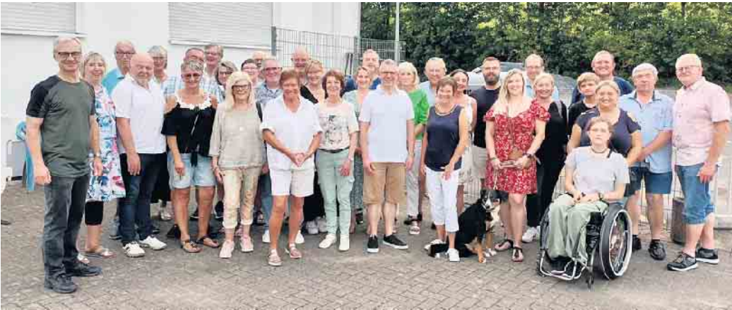
Viel Spaß hatten alle nach der politischen Sommerpause

Die CDU-Lindlar ist sehr dankbar für die vielen Menschen, die sich für die CDU im Lindlarer Gemeinderat, als Sachkundige Bürgerinnen und Bürger, im Vorstand, als Aktive im CDU-Gemeindeverband einsetzen, oder die Partei auch als passive Mitglieder unterstützen. Als Dankschön für dieses Engagement lud der Parteivorstand alle Mitglieder zu einem Grillfest ins Schützenhaus in Frielingsdorf ein. Die Freude über einen sehr schönen Abend ganz ohne politische Agenda war groß.