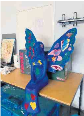
Schutzengel der CJG St. Antoniuschule

Schuljahr bei der Erschaffung ihres eigenen Schutzengels. Lebensgroß und aus glasfaserverstärktem Kunststoff wurde er künstlerisch mit bunten Farben bemalt. Dank dem Dachdeckerunternehmen Wirtz und Löhn aus Lindlar konnte er kostenfrei auf dem Vordach der Schule angebracht werden. Dort sitzend begrüßt der Schutzengel nun jeden Morgen vor Unterrichtsbeginn die Schülerinnen und Schüler und begleitet sie auf ihrem Schulweg.