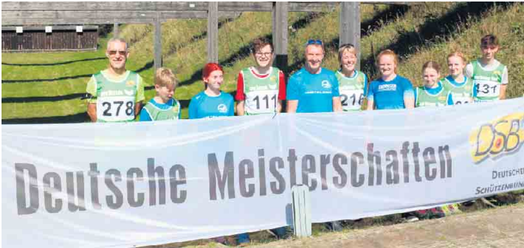
Das Team der Lindlarer Sommerbiathleten im Harz