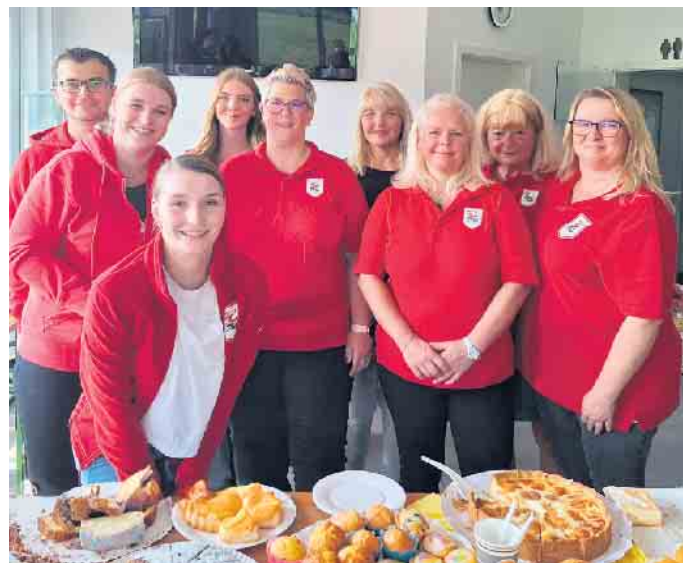
Das Team der KG-Lindlar beim Kuchenverkauf anlässlich des Weltkindertags 2023.

Selbstverständlich haben zum Gelingen zahlreiche weitere Vereine und Akteure beigetragen. Allen gemein war, ein deutliches Si-