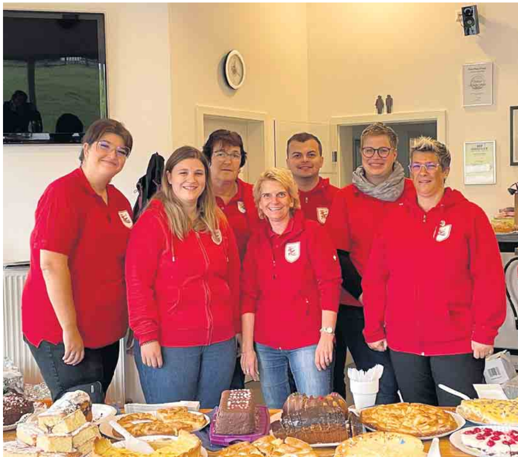
Das hochmotivierte Team der KG stand zum Kuchenverkauf parat.

Ein Team der Großen Karnevalsgesellschaft Rot-Weiß Lindlar e.V. wirkte auch in diesem Jahr wieder beim Weltkindertag in Lindlar mit und organisierte den Kuchenverkauf. Großer Dank gilt den Kuchenspendenden!