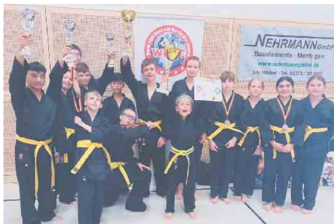
Sieger in der Kampfsportmeisterschaft