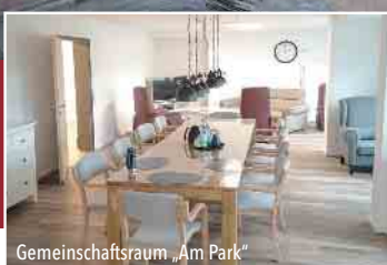
Gemeinschaftsraum „Am Park“