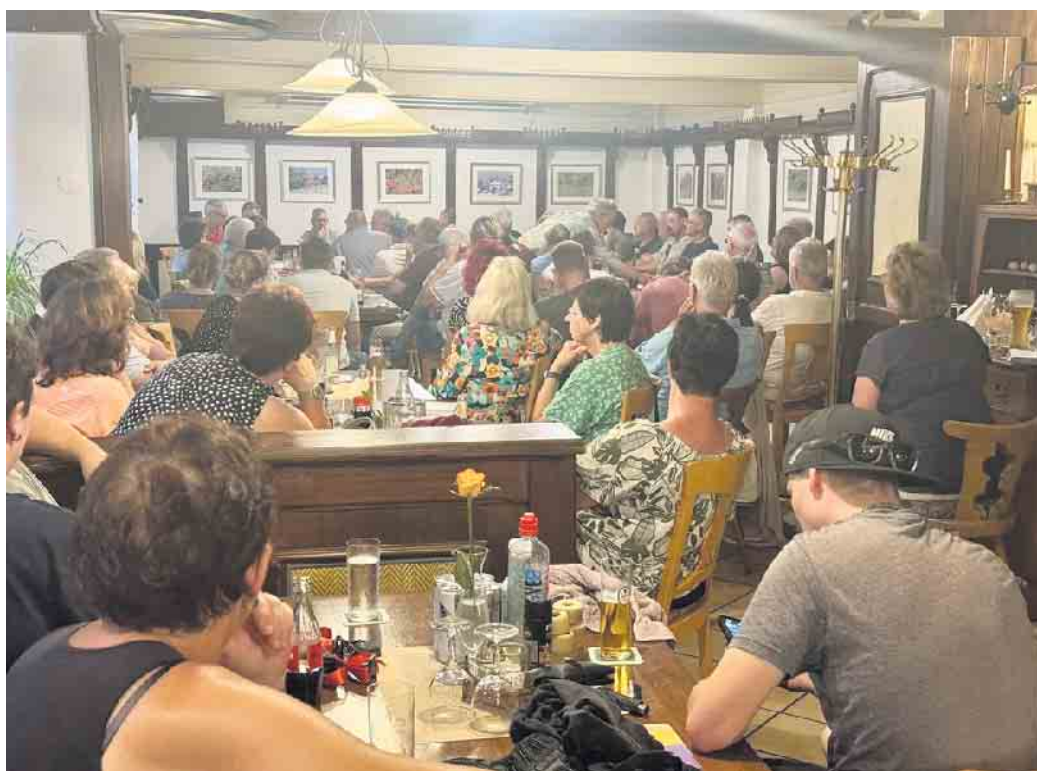
Großes Interesse am Lindlarer Weihnachtsmarkt bekundeten zahlreiche Versammlungsteilnehmer am 29. August.

Fazit: Es soll ein Weihnachtsmarkt von Lindlarern für Lindlarer werden.