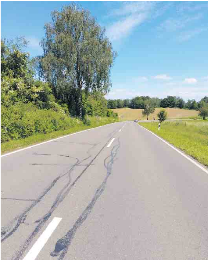
Die Kreisstraße 19 im Gemeindegebiet Lindlar muss auf der Strecke zwischen Zufahrt Leppedeponie und Kreisverkehr Industriepark Klause umfassend saniert werden.

Lindlar, K 21 Lindlar-Neuenfeld-Kuhlbach, L 302 Kuhlbach-Neuremscheid-Bickenbach und K 19. Zunächst wird auf der sanierungsbedürftigen Strecke der K 19 die Deckschicht abgefräst. Danach werden Schadstellen saniert und die Straße wird asphaltiert. Die Zufahrten und Einmündungen werden an die neue Fahrbahn angeglichen, Bankette neu angelegt und vorhandene Mulden (zur Entwässerung) instandgesetzt. Zuletzt werden die vorhandenen Schutzplanken ausgetauscht und auf die neue Fahrbahnhöhe angepasst. Weitere Informationen zu Bau-maßnahmen auf den Kreisstraßen unter www.obk.de/kreisstrassen .