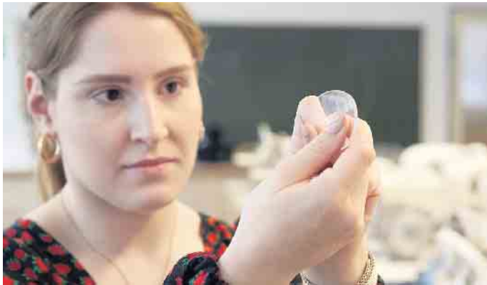
Handwerkliches Geschick und Präzision werden in der Augenoptik großgeschrieben.