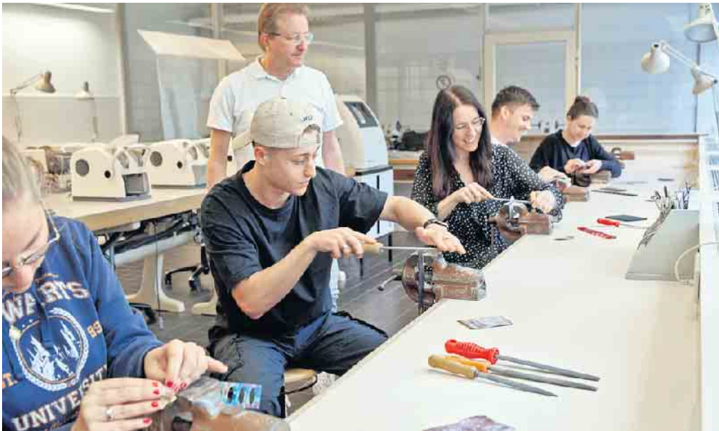
Handwerkliches Geschick und Präzision werden in der Augenoptik großgeschrieben.

Die Augenoptik ist ein Gesundheitshandwerk. Deswegen gehören neben der Kundenberatung und -versorgung mit Korrektionsbrillen und Kontaktlinsen