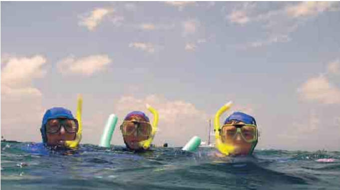
Mitmachen können beim Schnorchelabzeichen kleine und große Schwimmer.

Neue Schnorchelabzeichen deutschlandweit eingeführt