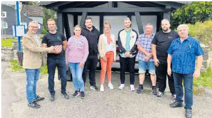
Eine kleine Unterstützung für den Bürgerverein Hartegasse

Die CDU-Lindlar löste vor Kurzem ihr Versprechen gegenüber dem Bürgerverein Hartegasse-Süng ein: Die CDU hatte anlässlich des 50. Vereinsjubiläums ihre Unterstützung für die Sanierung des Buswartehäuschens in Hartegasse zugesagt. Dieser Beitrag konnte nun vor Ort übergeben werden. Die CDU ist von dem enormen Einsatz des Bürgervereins für die Menschen im Kirchdorf begeistert und sehr dankbar für dieses Projekt sowie für die zahlreichen ehrenamtlichen Aktivitäten.