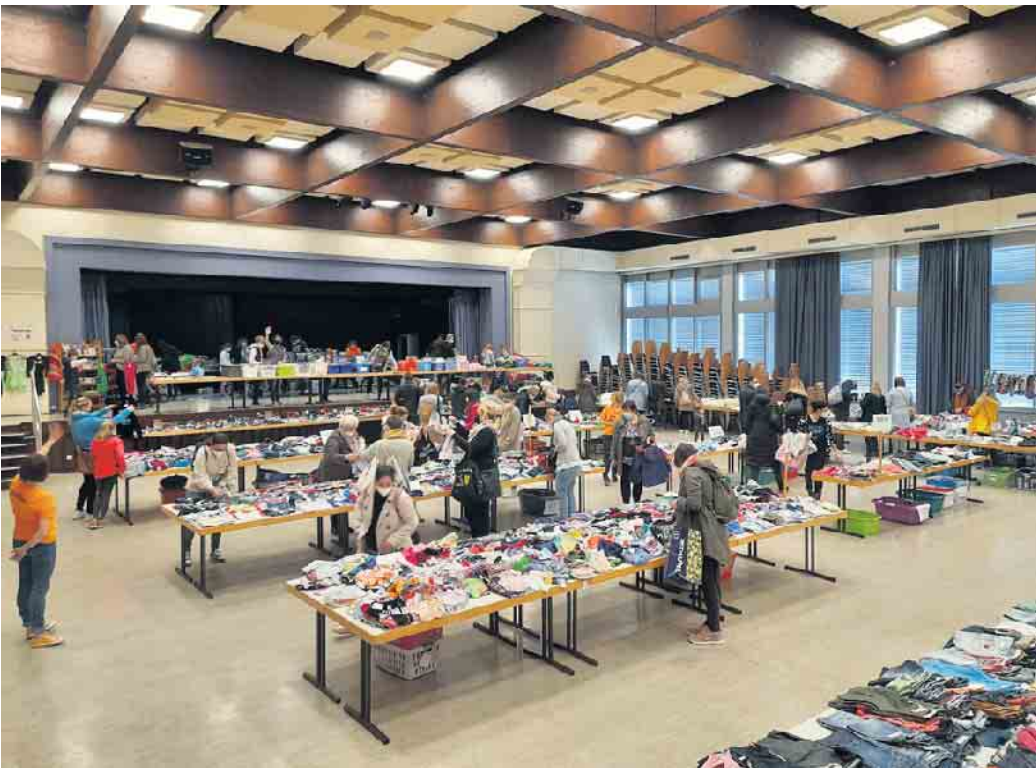
TVO Basar in der Aula Bielstein