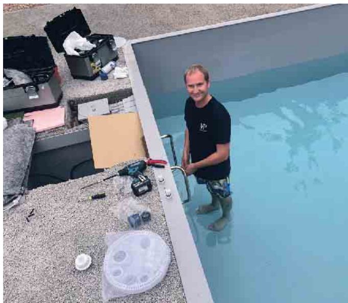
Mit den Füßen im Wasser: das ist Arbeiten in der Poolbranche.

Wer Pools baut, bringt Glück ins Haus - so könnte man es vereinfacht sagen. Anlagenmechaniker für Sanitär-, Heizungs- und Klimatechnik, Elektriker, Elektroniker oder Mechatroniker - das sind nur einige Berufsgruppen, die im Poolbau