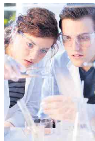
Im Programm „StartPlus“ werden junge Menschen mit Startschwierigkeiten beim Start in eine qualifizierte Ausbildung unterstützt.

auf den wartet ein passender Ausbildungsplatz. Und die Erfolgsquote ist hoch: In den vergangenen zehn Jahren haben im Schnitt neun von zehn Teilnehmenden nach Abschluss des Projekts eine Ausbildung im Unternehmen begonnen. (djd)