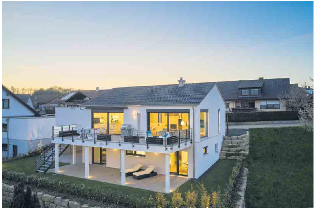
Keller werden heute zum Wohlfühlwohnen genutzt.

Mehrgenerationenhauses bestmöglich gegenseitig zu unterstützen. Das ist eine Vorstellung, die bei vielen Baufamilien gut ankommt.“ Eine andere Möglichkeit ist, die Wohnung eines Tages für eine häusliche Pflegekraft zu nutzen. Oder aber sie wird vermietet und hilft auf diese Weise dabei, die Rente aufzubessern. „Richtig geplant trägt ein Eigenheim mit Keller in doppelter Hinsicht zur attraktiven Altersvorsorge bei: Statt Miete zu zahlen, werden Mieteinnahmen generiert“, so Kunz, der Fach-