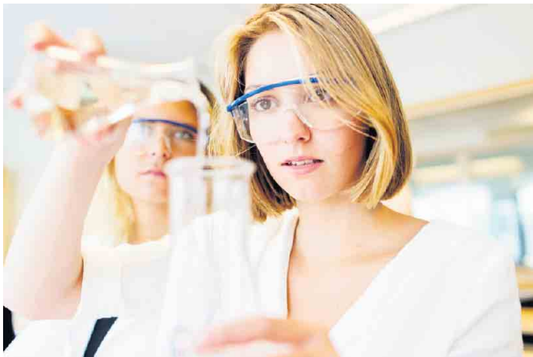
Ausbildungsberufe in der pharmazeutischen Produktion sind oft weniger bekannt, bieten aber gute Perspektiven.

Eine qualifizierte Ausbildung bietet heute beste Chancen für den Start in ein erfolgreiches Berufsleben, denn Fachkräfte werden überall gebraucht. Oft fallen Schulabgängern bei der Suche nach der passenden Stelle aber nur die gängigen Berufe etwa in Handwerk, Handel und Pflege ein. Dabei gibt es viele weitere Ausbildungen, die auch sehr gute berufliche Perspektiven bieten - zum Beispiel die zum Chemikanten in der pharmazeutischen Produktion. Chemikanten kontrollieren die komplexen Prozesse, mit denen aus Rohstoffen Vorprodukte und aus Vorprodukten fertige Medikamente werden. Anlagen per Hand schalten oder vom Leitstand aus überwachen, Ventile umlegen, Proben ziehen - die Arbeit ist vielfältig und steht im Mittelpunkt der Produktion. Weiterqualifizierungen etwa zum Produktionstechniker bieten attraktive Aufstiegsmöglichkeiten.