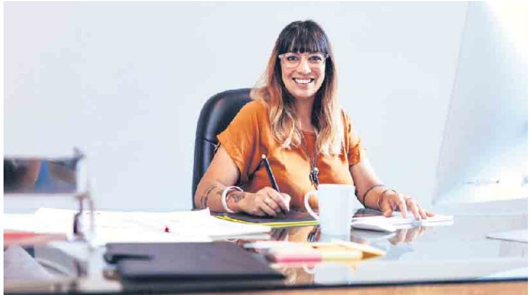
Eine Umschulung in einen anderen Beruf bringt Chancen, aber auch Herausforderungen mit sich.

seine Stärken noch besser einsetzen kann.