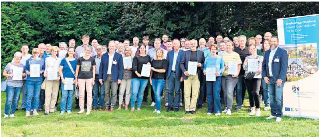
Die Vertreterinnen und Vertreter der oberbergischen Dorfgemeinschaften haben ihre Bescheide für die in 2025 bewilligten Fördergelder, zugunsten der Dorfentwicklung erhalten.