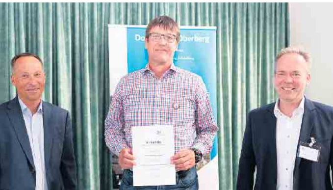
Der Förderbescheid für den Heimatverein Hohkeppel; Gemeinde Lindlar.

als zukünftiger Schattenspender Fördersumme: 2.896 Euro TUS Belmicke 1910 e. V. (Stadt Berneustadt) Projekt: Waldsofas für Belmicke • zwei mobile Waldsofas zur Schaffung von stets neuen Perspektiven und Ruheoasen in der Natur Fördersumme: 1.856 Euro Gemeinnütziger Verein Bickenbach von 1905 e. V. (Gemeinde Engelskirchen) Projekt: Erneuerung der Boule-Bahn auf dem Dorfplatz • Instandsetzung der vorhandenen Boule-Bahn in Bickenbach Fördersumme: 973 Euro Kinderschützenverein & Dorfgemeinschaft Börlinghausen e. V. (Gemeinde Marienheide) Projekt: „Altes bewahren - Neues gestalten - Unser Dorfgemein-