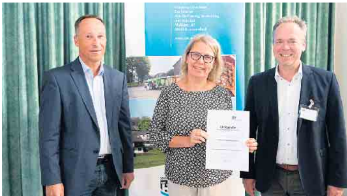
Der Förderbescheid für den Bürgerverein Brochhagen e. V.; Gemeinde Lindlar.