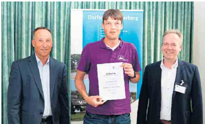
Der Förderbescheid für den Bürgerverein Scheel e. V.; Gemeinde Lindlar.

dient zudem als Lager für Gerätschaften zur Spielplatzpflege.