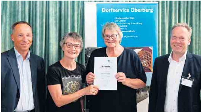
Der Förderbescheid für den Bürgerverein Linde e. V.; Gemeinde Lindlar.