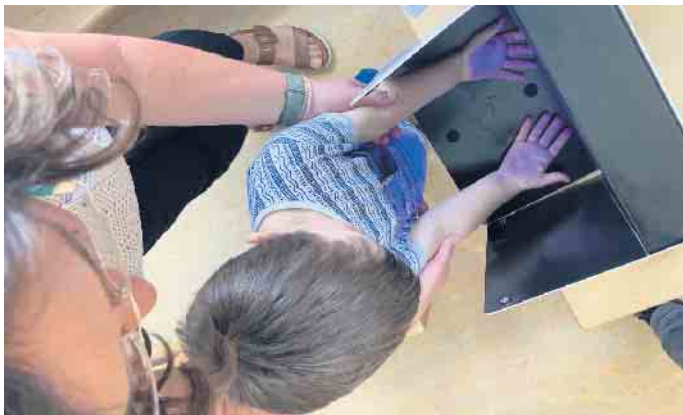
Das farbige Licht zeigt, dass die Hände noch nicht sauber sind.