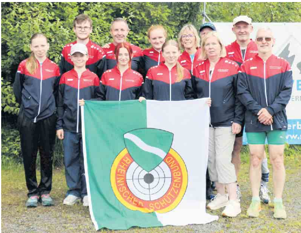
Das Lindlarer Team des Rheinischen Schützenbundes

Am vorletzten Wochenende im Juni kämpften die Lindlarer Biathleten in Neuastenberg gegen die Konkurrenz aus Hessen und Westfalen. Zwei Tage lang trat man gegen die Konkurrenz an, in den