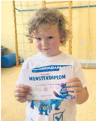
Das Monsterdiplom nach erfolgreich absolviertem Parkour.