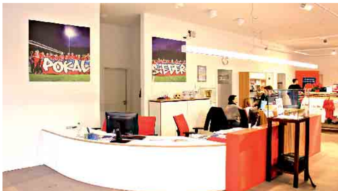
Vor dem Stadion des 1. FC Heidenheim hat Lehner Haus ein Vereinslokal und die Geschäftsstelle mit Fanshop des Zweitligisten gebaut.

Bei Ein- und Zweifamilienhäusern, dem Kerngeschäft der meisten Fertighaushersteller, beträgt der Fertigbauanteil gemäß den bundesweiten Baugenehmigungszahlen rund 23 Prozent. Vor zehn Jahren waren es noch 15 Prozent. Zunehmend interessant ist die Fertigbauweise aber nicht nur für private, sondern auch für gewerbliche Bauherren und Investoren. Die kurze und