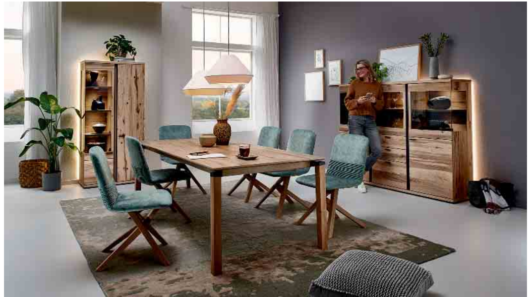
Zeitlos schöne Qualitätsmöbel bereiten ihren Besitzern lange Freude.

ENGELSKIRCHEN NEUREMSCHIED 11 TEL. 02263/2441