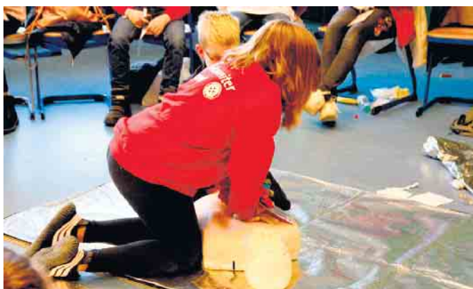
Kinder lernen die Herzdruckmassage