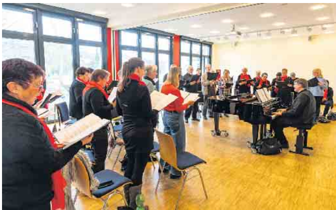
Projektstart am 4. März mit Interessenten im Severinushaus, Lindlar.

Und natürlich bei unseren Sängerinnen und Sängern sowie an der Abendkasse.