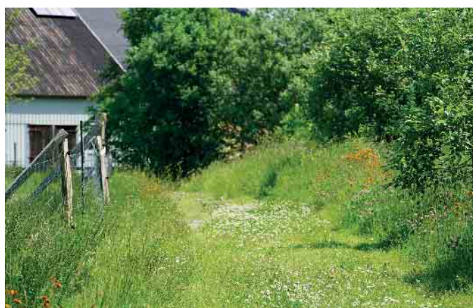
Mit nur wenig Aufwand lassen sich Garten, aber auch Terrasse oder Balkon in kleine Paradiese für Insekten, Bienen, Schmetterlinge und Co. verwandeln.