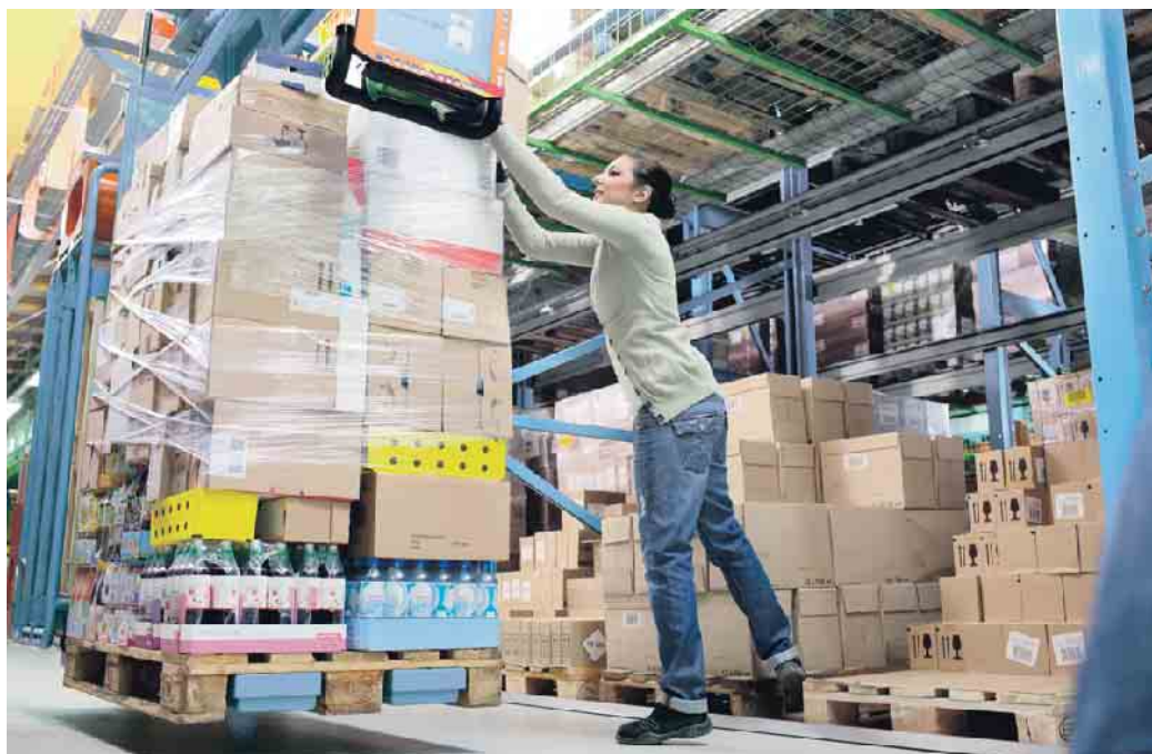
Erkrankungen des Muskel-Skelett-Systems machen den größten Anteil an den Arbeitsunfähigkeits-Tagen aus.

Zu den besonders belastenden Tätigkeiten zählen unter anderem das Heben und Tragen von Lasten, Zwangshaltungen, sich ständig schnell wiederholende Tätigkeiten und Vibrationen. Für den Einstieg in die Gefährdungsbeurteilung von Muskel-Skelett-Belastungen haben BAuA und die Deutsche Gesetzliche Unfallversicherung Checklisten herausgebracht. Im Idealfall können hieraus bereits wirksame Maßnahmen abgeleitet werden. Ist die Beurteilung komplexer, sollte der betriebliche Praktiker ein vertiefendes Verfahren nutzen oder einen Experten hinzuziehen.