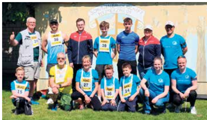
Das Lindlarer Team

schon jetzt zeigt sich: Die Lindlarer Sommerbiathleten gehören