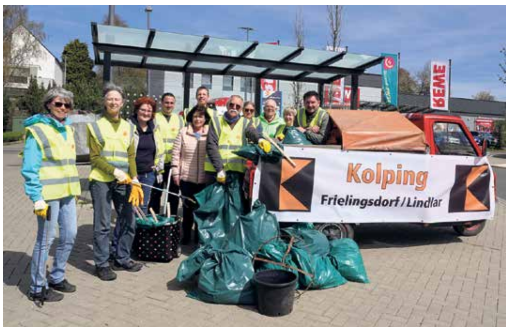
Die Frielingsdorfer Helfer/-innen und ihr Sammelergebnis beim Dorfputz.

Frielingsdorfer Bürger/-innen zogen am Samstag, 11. April, mit Handschuhen, Zangen sowie Müllsäcken ausgestattet durch das Dorf, um für einen sauberen Ort zu sorgen