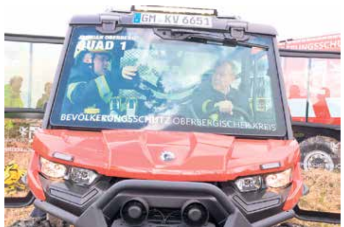
Klaus Grootens lässt sich das UTV erklären.