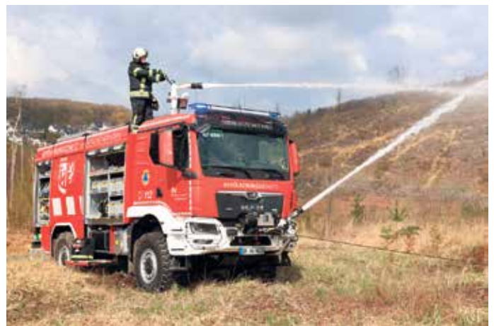
Waldbrand-TLF mit Front- und Dachmonitor im Demo-Einsatz

Diese können an dem Tank auf dem UTV auch ihre Löschrucksäcke nachfüllen. "Das ist ein großer Schritt zur Bekämpfung von Vegetationsbränden", unterstrich Seeger. Verlastet wird das UTV auf einem Abrollcontainer, der auch Platz für weitere Löschrucksäcke, Hacken und Motorsägen bietet. (mk)