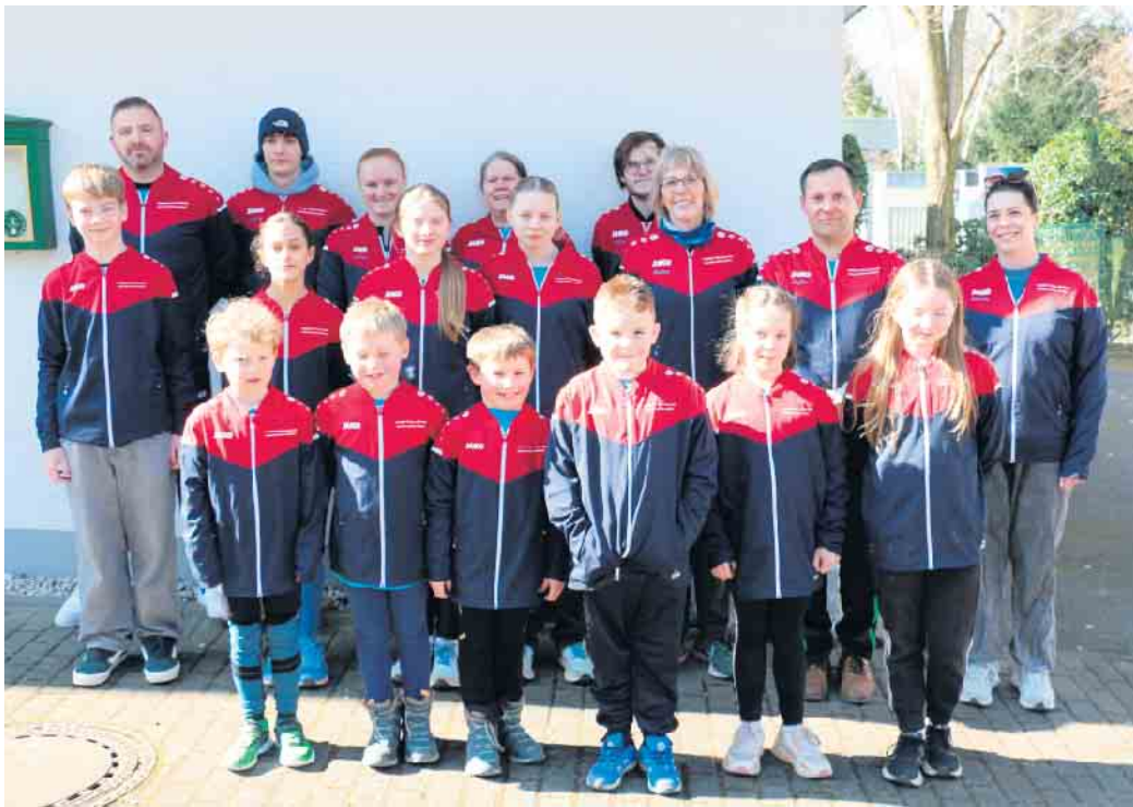
Ein tolles Team des Schützenverein Lindlar in Raubach