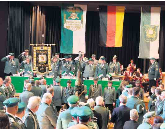
Fahnenappell zu Beginn der Veranstaltung

kehrslenkung konzentrieren werde. Mehrheitlich wurde entschieden, die Delegiertenversammlung 2026 unter Organisation des Schützenvereins „Hohe Belmücke“ im Bergneustädter Krawinkelsaal durchzuführen und auf Wunsch des Schützenvereins Bergneustadt das Bundesprinzenschießen zum 725. Stadtgeburtstag ebenfalls in die „Feste Nyestad“ zu verlegen. Bei der traditionellen Hutsammlung kamen diesmal gut 900 Euro zusammen, die von mehreren Personen auf insgesamt 1.800 Euro aufgestockt wurden - 1.000 Euro für die Kinderklinik Gummersbach und 800 Euro für die „Speisekammer Lindlar & Frielingsdorf“. Musikalisch begleitet wurde die Veranstaltung vom Musikverein Lindlar unter Leitung von Stefanie Deckers. (mk)