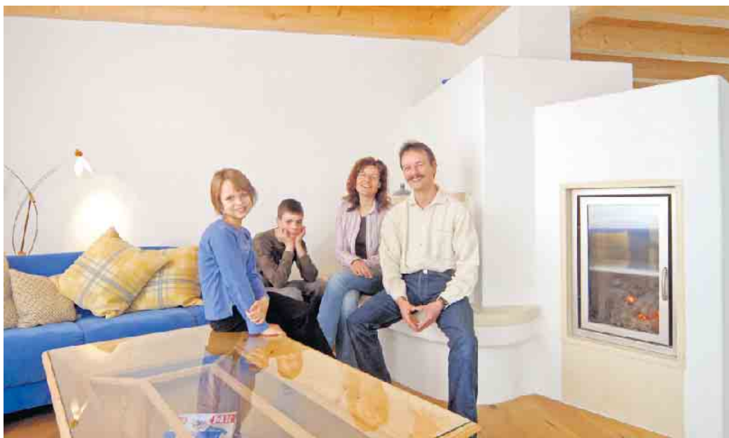
Wohlfühlklima fürs Familienheim: Der Traditionswerkstoff Lehmputz lässt sich als Trockenbausystem spielend leicht verarbeiten.

Was manche Bauherren - egal ob im Neubau oder in der Renovierung - bisher noch davon abhält, Lehm in ihrem Haus einzusetzen, ist der relativ hohe Aufwand für den Auftrag von Lehmputzen sowie die langen Trocknungszeiten, die den Baufortschritt hemmen. Deutlich einfacher geht es mit innovativen Plattensystemen, wie sie etwa Naturbo entwickelt hat. Sie vereinen alle ökologischen Vorteile von Lehmputz mit der unkomplizierten Verarbeitung von Trockenbausystemen. Auf vorgefertigten Plattenelementen aus Holzweichfaser ist der Lehm bereits mit einer Gewebeamierung aufgebracht. Die Platten können ohne umfangreiche Vorarbeiten und ohne den Einsatz größerer Wassermengen verbaut werden. Unter www.naturbo.de gibt es dazu mehr Infos und Verarbeitungstipps. Auf Holzständer oder Holzplatten erfolgt die Befestigung durch Verschrauben, auf Mauerwerk oder Gipsbauplatten lassen sich die Elemente verkleben. Auch Innen- und Trennwände können mit entsprechenden Ständerkonstruktionen erstellt werden. Die schnelle und einfache Verarbeitung spart Geld, Zeit und Material.