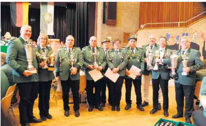
Die Gruppe der Pokalsieger