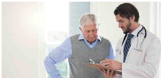
Bei Herzinsuffizienz sollten Ärzte genau hinschauen.

Bei einer Transthyretin-Amyloidose lagert sich das Eiweiß Transthyretin als fadenförmige Fibrillen in unterschiedlichen Geweben und Organen ab und kann deren Funktion beeinträchtigen. Die altersbedingte, erworbene Form betrifft vor allem das Herz und tritt meist bei älteren Menschen über 60 Jahre auf. Seltener ist die erbliche Variante der Erkrankung, die hereditäre Transthyretin-Amyloidose. Sie schädigt je nach Mutation die Nerven, das Herz oder beide Organe und kann auch bei jüngeren Menschen vorkommen. Oft zeigen Patienten mit der erblichen Form sowohl Symptome am Herzen als auch an den Nerven. Mehr Informationen zur Erkrankung gibt es unter www.leben-mit-amyloidose.de . (akz-o)