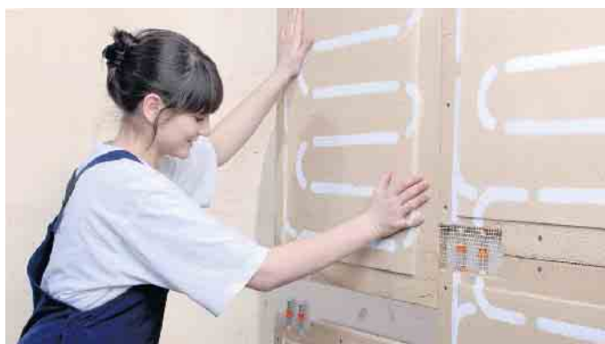
Eine angenehme und energiesparende Wandheizung ist mit Lehmbauplatten, die ab Werk mit Heizungsrohren vorbestückt sind, schnell und einfach einzubauen.

Die Lehmputz-Plattenelemente gibt es in verschiedenen Ausführungen, etwa als reine Wandbel plankung oder als Innendämmung. Wer sich die angenehme und energieeffiziente Wärme einer Wand- oder Deckenheizung ins Haus holen will, kann die Installation von Flächenheizung und Lehmputz in einem Arbeitsgang durchführen. In spezielle Plattenelemente sind bereits Heiz-/Kühlrohre eingelassen, die mit klassischen Presskupplungen verbunden werden. (DJD)