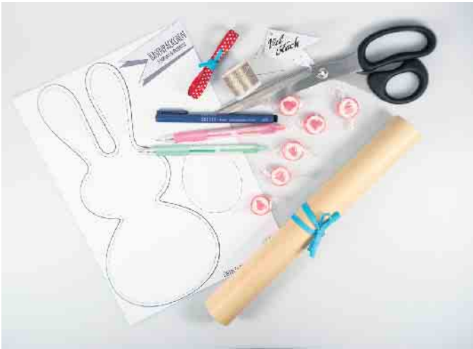
Das Material für die Osterhasentüten auf einen Blick.