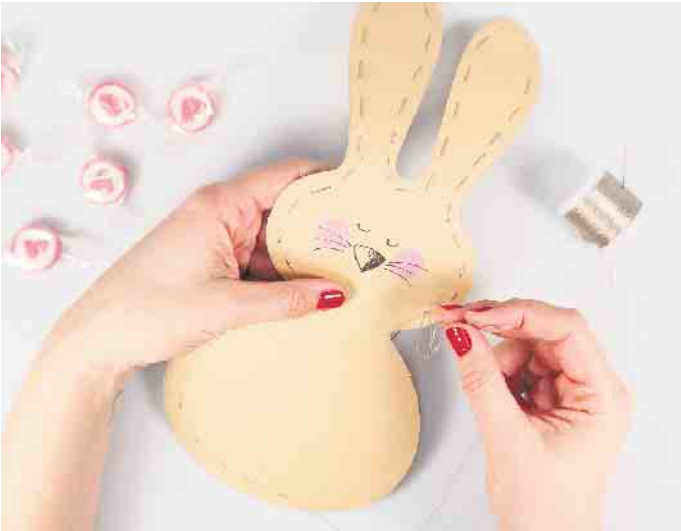
Mit einem Faden werden beide Hälften zusammengenäht. Kurz vor Schluss ein kleines Loch lassen, die kleinen Naschereien reinstecken und zunähen.

und Kreativstifte wie den Fineliner Drawing Pen in Schwarz und den Gelschreiber G2-7, den es von Pilot in einer Auswahl von 31 bunten Farben gibt. Hinzu kommen ausgedruckte Vorlagen für Hase und Anhänger, die man zum Beispiel unter www.pilotpen.de/diy-tutorial kostenlos herunterladen kann.