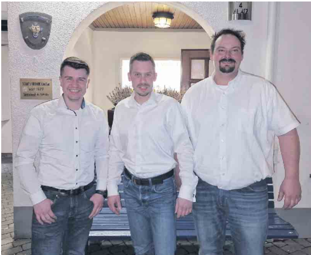
die neuen Tollitäten für die Gem. Lindlar 2023/2024