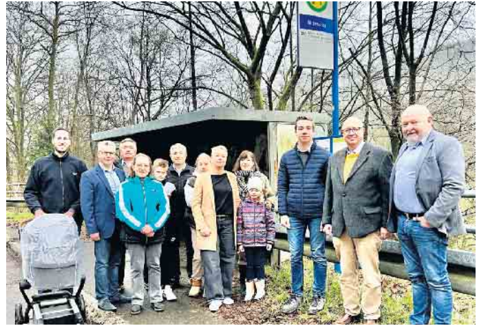
Betroffene Eltern und CDU-Vertreter aus dem Gemeinderat und Kreistag vor Ort

Idee auf, den Bürgerbusverein Lindlar e.V. auf der Suche nach Lösungen über die OVAG und den OBK einzubinden. Einen umfassenden Antrag hierzu hat die CDU-Fraktion bereits gestellt. Vielleicht kann es eine bedarfsorientierte Beförderungslösung für die Problemstrecken geben? Dies wollen wir gemeinsam herausfinden, denn wir setzen uns für sichere Schulwege ein. Dem Bürgerbusverein Lindlar e.V. und den Eltern danken wir für die Problemanzeige und die gemeinsamen Überlegungen.