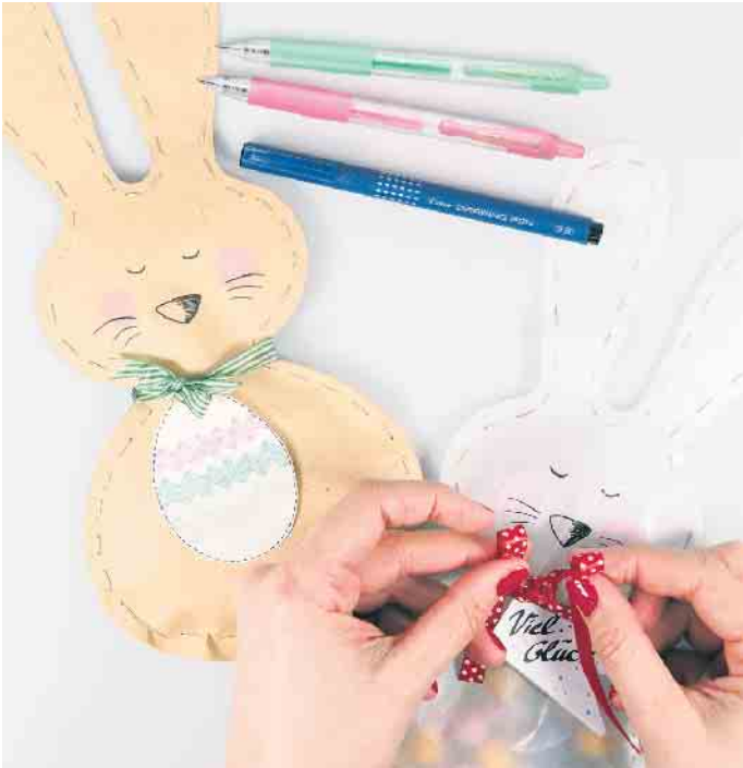
Ob für die Eiersuche oder als süße Geschenkverpackung: Über die Osterhasentüten freuen sich Jung und Alt.

Schritt 3: Für den Anhänger die ausgedruckte Ostereivorlage oder eine selbst gewählte Form aus Papier ausschneiden und mit verschiedenfarbigen G2-7 Stiften individuell gestalten. Am Ende lochen und mit Schleifenband an der Hasentüte befestigen. Fertig ist das süße Ostergeschenk! (djd)