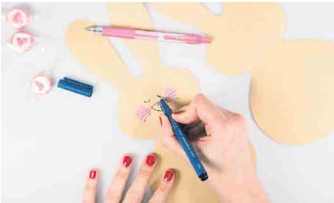
Ist der Osterhase ausgeschnitten, bekommt er ein hübsches Gesicht aufgemalt.

Transparentpapier, eine Nadel, einen stabilen Faden, ein Schleifenband, eine Schere, einen Locher