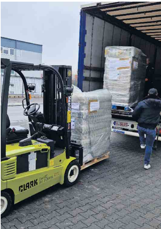
Beladen des Hilfstransports in Lindlar.