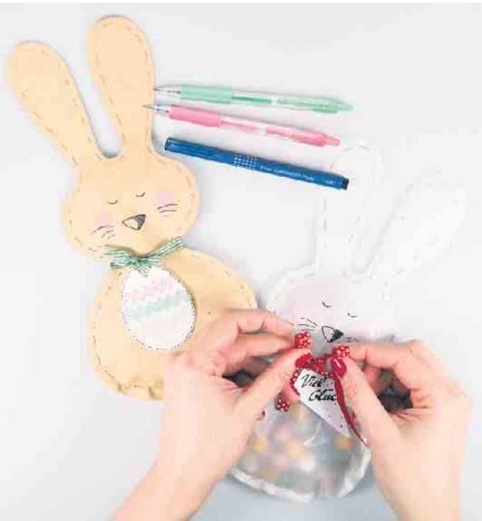
Niedliche Osterhasentüten machen die Eiersuche noch spannender und abwechslungsreicher.

se wartet! Aber nicht nur für die Kleinen sind die Hasentüten eine schöne Idee, auch als Mitbringsel zum Osterbrunch kommen sie gut an. Denn statt Bonbons, können darin zum Beispiel auch Blumen-samen und andere kleine Überraschungen verpackt werden. Mit nur wenigen Materialien und Kreativstiften sind die Hasentüten im Handumdrehen gebastelt. Und so geht's: