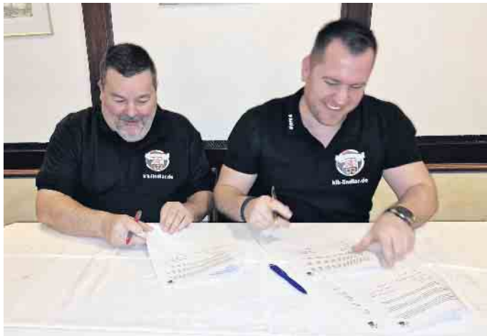
Unterschriften des Präsidenten und des stellv. Präsidenten

Der Förderverein für Kinder und Jugendliche in der Gemeinde Lindlar e.V. lädt seine Mitglieder ein