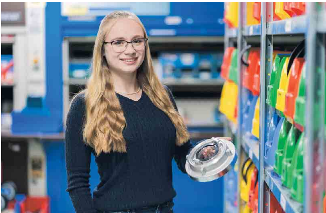
Kaufleute für Groß- und Außenhandelsmanagement sorgen für einen reibungslosen Warenfluss.

Für angehende Kaufleute, die sich für Handelswege und Warenaustausch interessieren, bietet der Technische Handel eine Ausbildung in den Fachrichtungen Großhandel und Außenhandel an. Für kommunikative Organisationstalente ist dies genau das Richtige, denn hier geht es um den reibungslosen Warenfluss von der Bestellung über die Lagerung und Auslieferung bis hin zur Bezahlung.