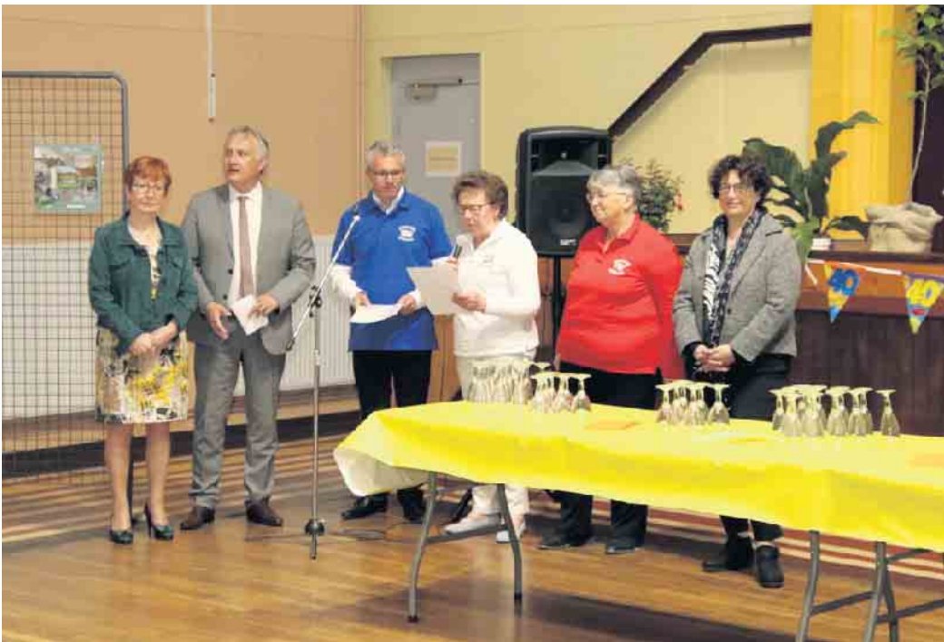
Bereits im vergangenen Jahr wurde das 40-jährige Partnerstadtjubiläum in Brionne gefeiert. Bald soll dieses in Lindlar gefeiert werden.