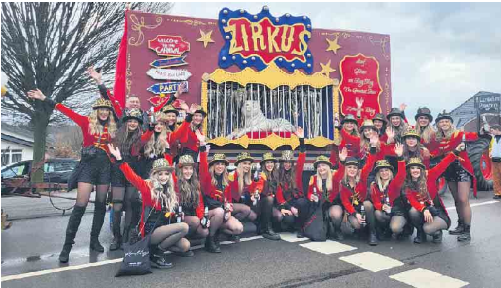
„Die Mädels vom Lande“ bildeten die beste Fußgruppe.

Die beste Fuß- und Wagengruppe der Session 2023/2024 wurde von einer Jury der KG ermittelt. Gewinn und Urkunde werden während der kommenden Sessionseröffnung überreicht.