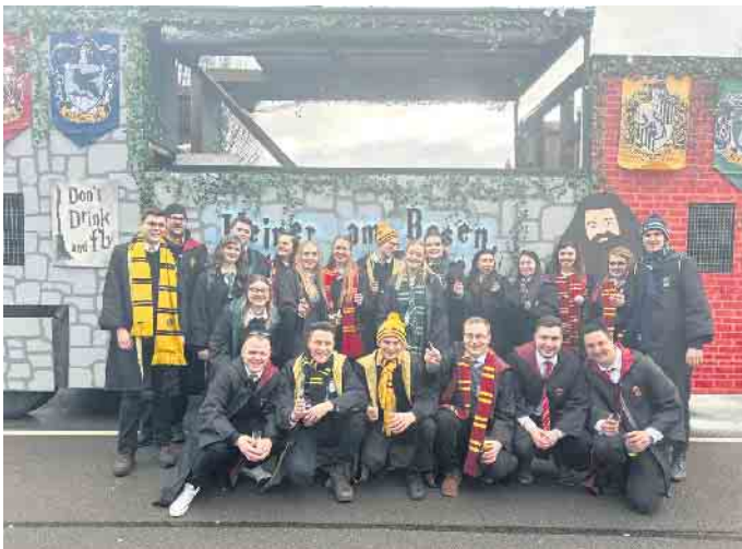
Die „Bergische Pänz“ präsentierten sich mit dem besten Festwagen.

Preis als beste Fußgruppe, gefolgt von den „1. Lenkeler Piraten“ (102 Punkte) und „Sambalocco“ (96 Punkte).