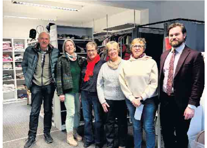
Spendenübergabe bei der Frielingsdorfer Kleiderbörse „Hand in Hand“

Rahmen eines Besuchs wurde die Spende an die Vertreterinnen der Kleiderbörsen überreicht. Dabei erhielten die Mitgliederinnen und Mitglieder der SPD Lindlar spannende Einblicke in die ehrenamt-