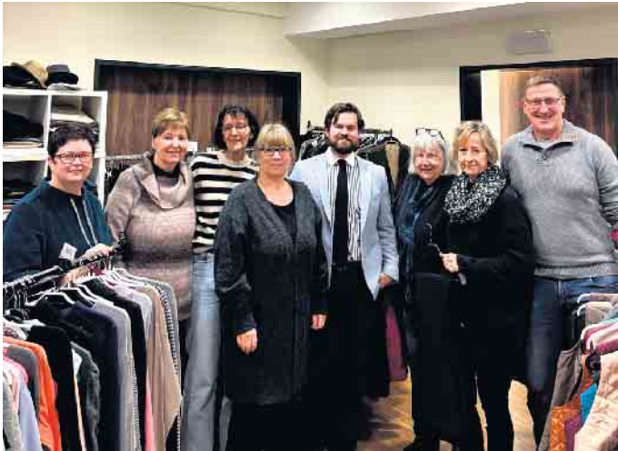
Spendenübergabe bei der Lindlarer Kleiderbörse „Dies und Das bei Caritas“

Die SPD Lindlar hat die Erlöse ihres Weihnachtsmarktstandes an die Lindlarer Kleiderbörse „Dies und Das bei Caritas“ sowie an die Frielingsdorfer Kleiderbörse „Hand in Hand“ gespendet. Im