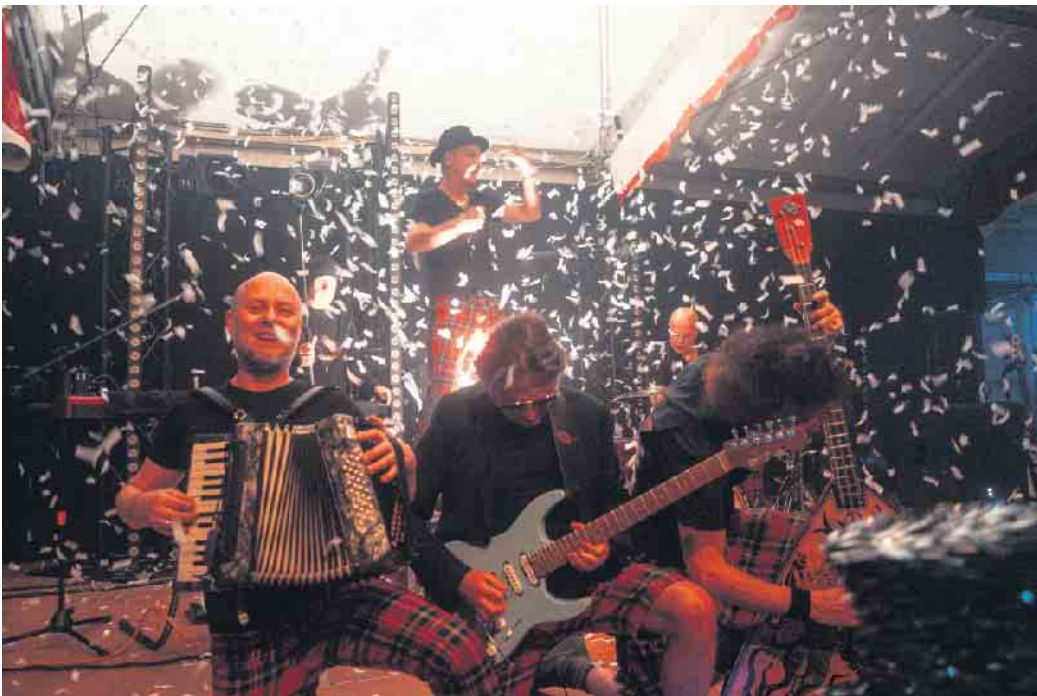
Die Band Brings sorgte für reichlich Stimmung.