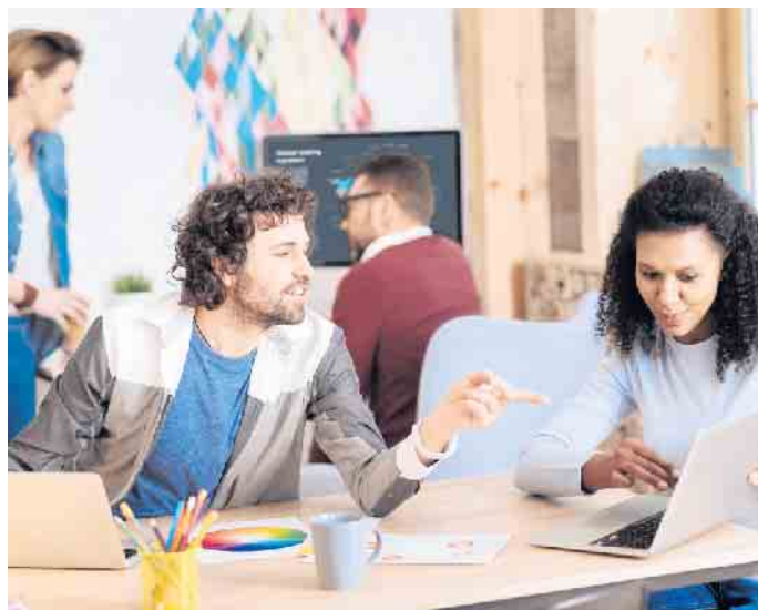
Bei einer Weiterbildung vertieft man sein Wissen in wichtigen beruflichen Themengebieten.