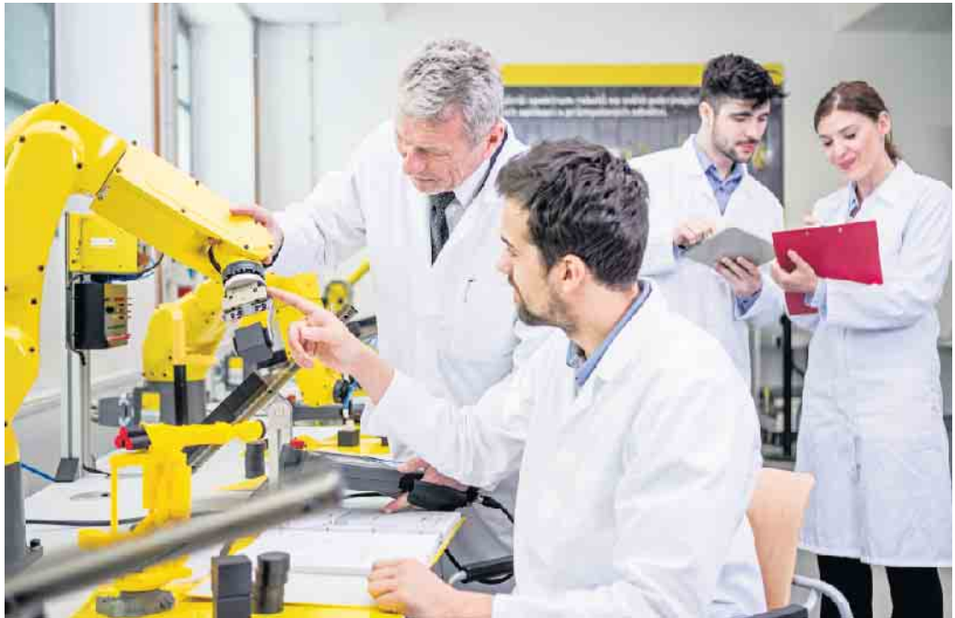
Immer mehr Unternehmen setzen bewusst auf Bewerber mit Erfahrung und bilden generationsübergreifende Teams.