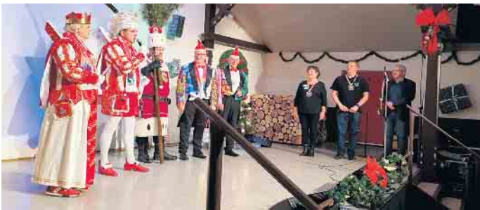
Lohmarer Dreigestirn als Überraschungsgast.