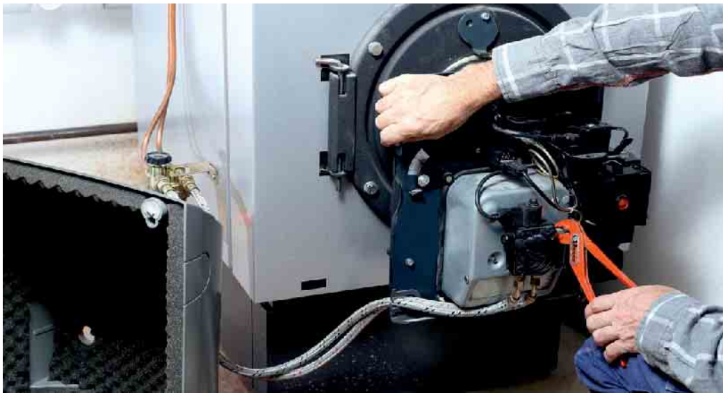
Viele Reparaturen können durch regelmäßige Heizungswartung avoided werden.

Die Kosten für eine jährliche Wartung der Heizung in einem Einfamilienhaus liegen im Schnitt bei rund 160 Euro. Grundsätzlich hängen die Preise vom jeweiligen Fachbetrieb sowie der regionalen Lage und dem Anlagentyp ab. Die durchschnittlichen Wartungskosten sind bei der Gasheizung (130 Euro) und Wärmepumpe (140 Euro) meist am günstigsten. Etwas