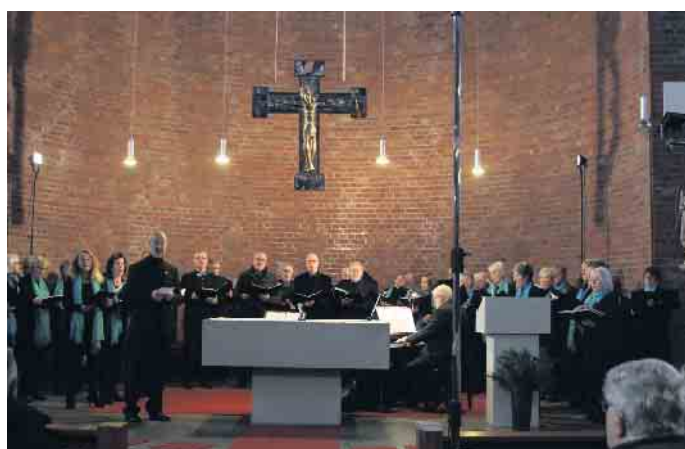
Weihnachtskonzert am 4. Advent.

Das „Abendlied“ von Rheinberger griff diese emotionale Stimmung