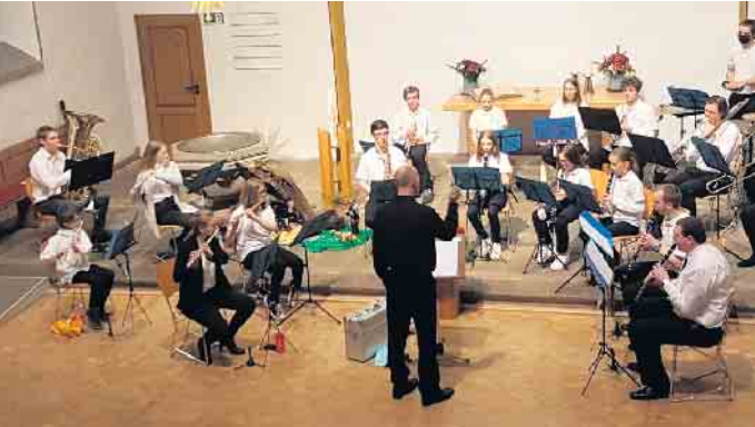
Adventskonzert des Jugendblasorchester Neuhonrath in Honrather Kirche