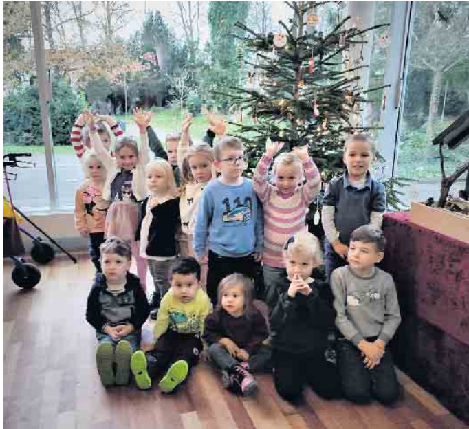
Die „Raupengruppe“ des Kindergartens Waldgeister vor dem geschmückten Weihnachtsbaum.

Raupengruppe schmückt den Weihnachtsbaum der Villa Friedlinde