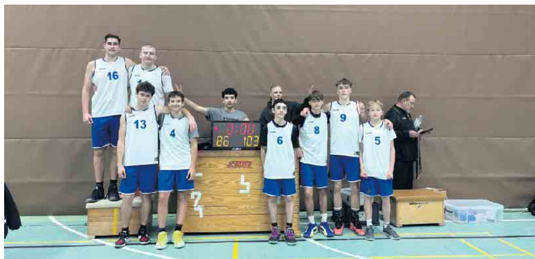
U18.2 nach dem Erfolg

Im letzten Viertel overpacete das Team dann, traf häufig - sei es aus beginnender Müdigkeit, sei es im Vorgefühl des Erfolgs - un-