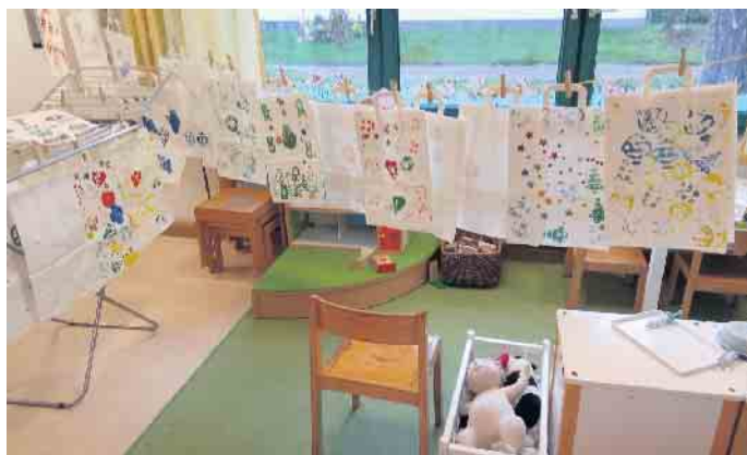
Die festlich gestalteten Tüten