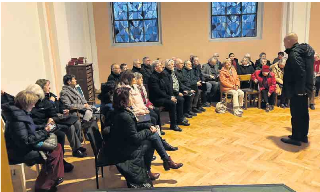
Kurze Vorbesprechung vor dem Singen

Am 2. Adventssonntag gestaltete die Singgemeinschaft Birk die Messe in der Kirche der Steyler Missionare in Sankt Augustin musikalisch. Vorgetragen wurden sakrale Lieder aus verschiedenen Epochen bis hin zur Neuzeit. Die Singgemeinschaft freute sich, diesem Adventssonntag einen festlichen Rahmen geben zu können. Gerade nach dem dramatischen Brand war es dem Chor wichtig, einen musikalischen Beitrag zu leisten. Die Kirche der Steyler Missionare hat eine hervorragende, aber auch besondere Akustik. Töne tragen laut und weit und schwingen lange nach. Bei der Interpretation der Stücke ist es deshalb wichtig, ein gutes Gleichgewicht zwischen passendem Tempo und Ausdruck der Lieder zu erreichen.