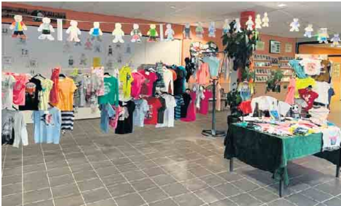
T-Shirt Tauschbörse an der Waldschule Lohmar

Jahresbericht des Fairtrade Teams Lohmar