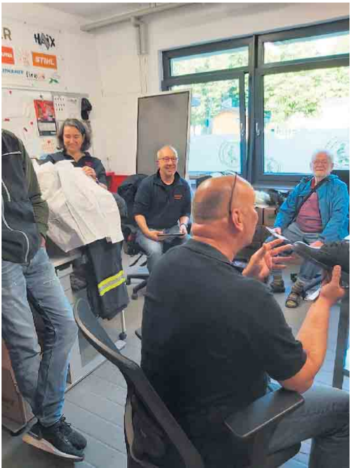
Gruppenstunde Kleiderkammer freiwillige Feuerwehr

Der faire Gedanke ist inzwischen in Lohmar weit verbreitet. Auch in diesem Jahr sind wieder einige faire Partner hinzugekommen. Fairtrade hat die Verbesserung der Lebens- und Arbeitsbedingungen in den produzierenden Ländern zum Ziel.