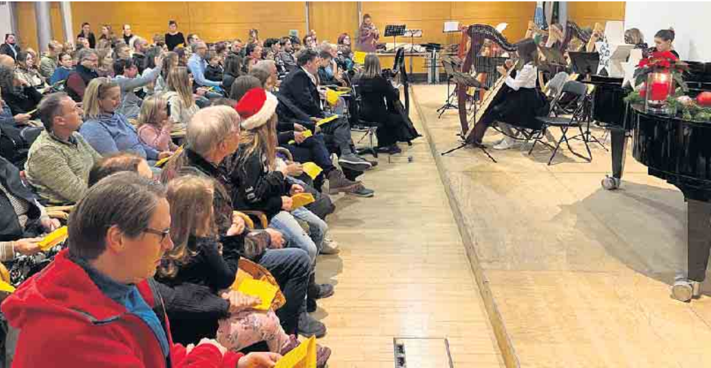
Das Harfenensemble Stardust eröffnete den Abend.

Am ersten Adventssonntag, 3. Dezember, fand das diesjährige Adventskonzert der Musik- und Kunstschule im Rathaus statt. Die Schüler*innen boten ein abwechslungsreiches Programm,