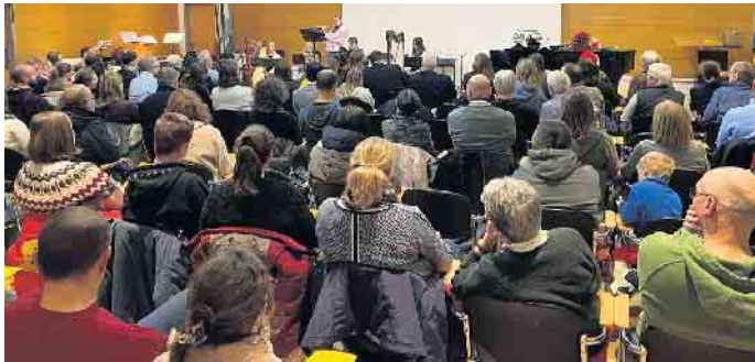
Volles Haus im Ratssaal der Stadt beim diesjährigen Adventskonzert der Musik- und Kunstschule Lohmar.