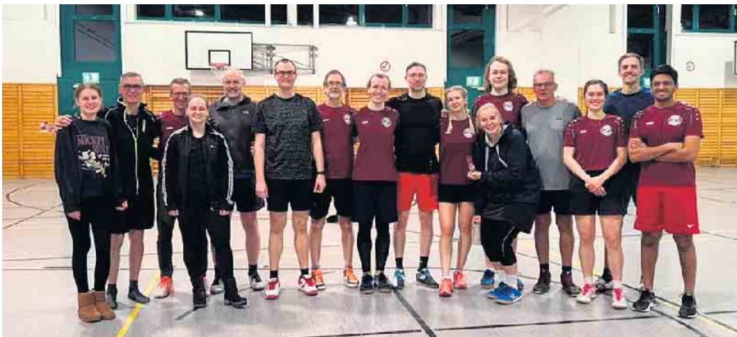
Gruppenfoto der beiden Vereine

TV Lohmar unterliegt SV Rot-Weiss Köln-Zollstock, aber behält den Teamgeist hoch