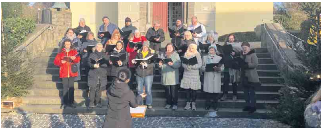
La Voce Honrath beim Nikolausmarkt in Wahlscheid

Bei strahlendem Sonnenschein konnte man auf dem kleinen, aber sehr feinen Nikolausmarkt an der Evangelischen Kirche Wahlscheid schlendern, Geschenke kaufen und genießen. Unter anderem war auch La Voce Honrath eingeladen, die Besucherinnen und Besucher mit Weihnachtsliedern auf die Festtage einzustimmen. Mit ihrem Repertoire von der Renaissance bis zum 20. Jahrhundert gaben die Sängerinnen und Sänger schon einen kleinen Vorgeschmack auf das Konzert im Wahlscheider Forum am 16. Dezember um 18 Uhr. Tickets für dieses Konzert, an dem sich alle Wahlscheider Chöre beteiligen, erhalten Sie im Laden 78, im Modestübchen und im Aueler Hof. www.lavoce-honrath.de