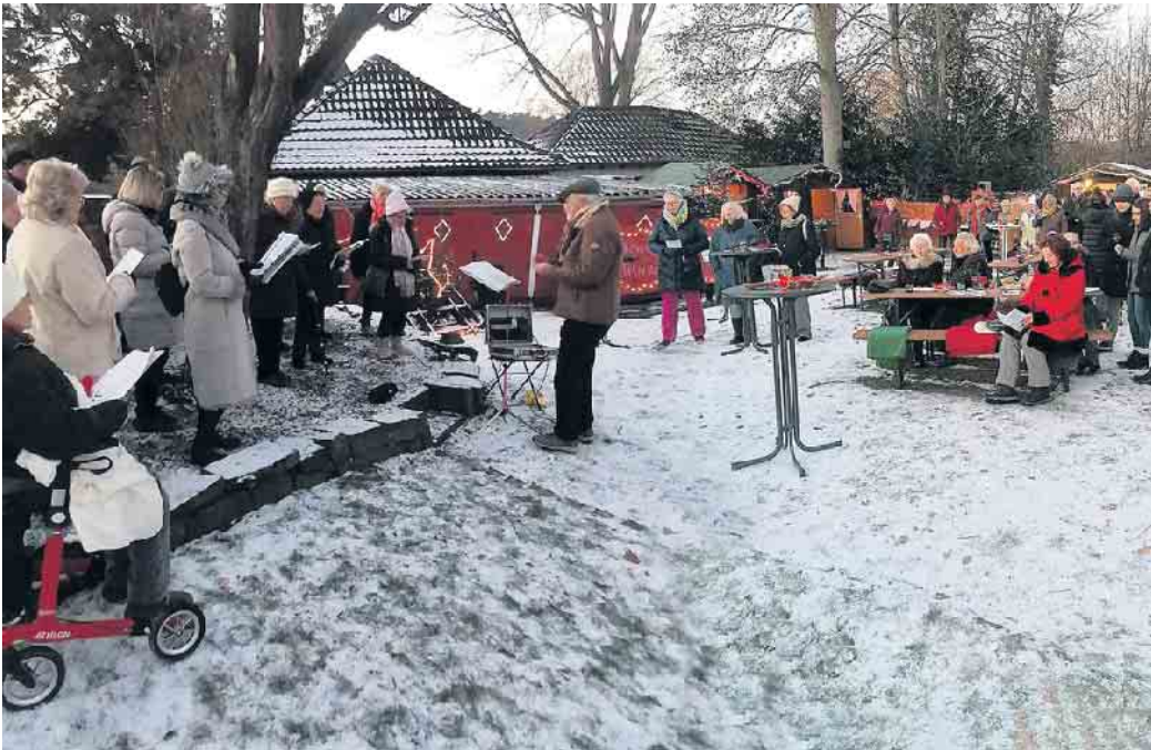
Mit Schnee ist in diesem Jahr nicht zu rechnen, dafür aber mit milderen Temperaturen. Im letzten Jahr war es bitterkalt.