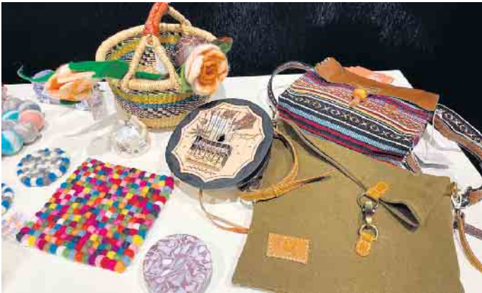
Unser Stand an der 1. Nachhaltigkeitsmesse