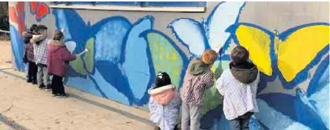
Die Kinder hatten viel Spaß bei der Verschönerung der vorher tristen Wand.