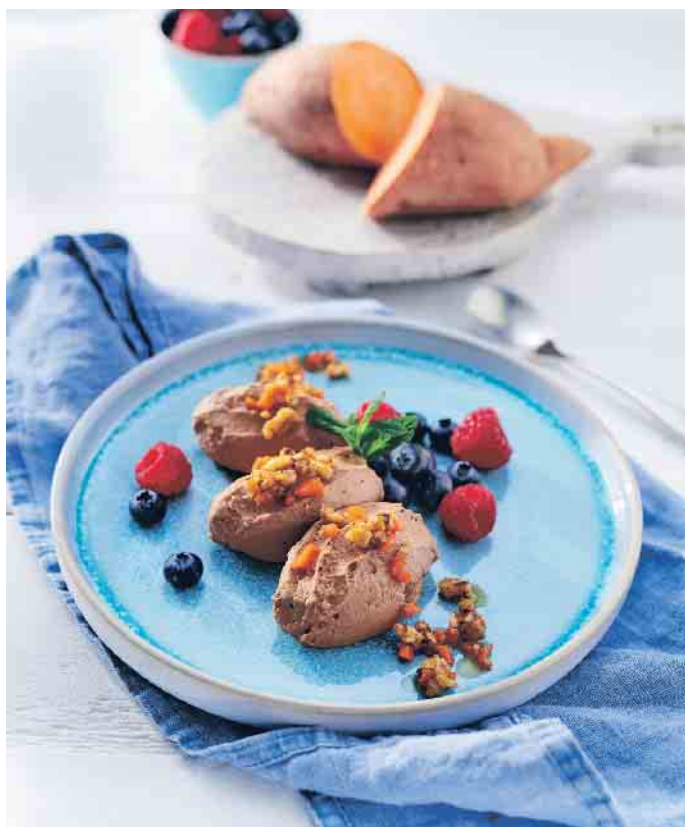
Süßkartoffel-Schoko-Mousse als leckeren Nachtisch.

Die besinnliche Zeit des Jahres steht vor der Tür und eines der wichtigsten Themen ist natürlich das perfekte Festtagsessen. Dabei gilt es ein Menü zu erstellen, welches allen Erwartungen entspricht und den verschiedenen Bedürfnissen gerecht wird. Während sich mancher Gast vielleicht überwiegend vegan ernährt, ist ein anderer ein absoluter Fleischfan und ein Dritter mag es eher traditionell.