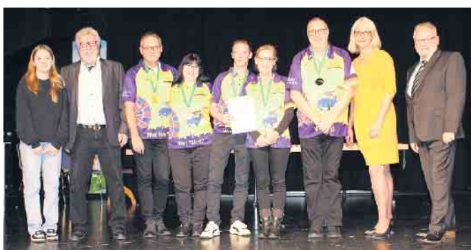
Das Lohmarer Darts-Team „Wer fährt?“, das schon so manchen Titel mit den Pfeilen ins Ziel gebracht hat.

Stadtssportbund und Stadt Lohmar zeichnen Sportler*innen aus