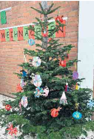
Ein von Kindern geschmückter Weihnachtsbaum der Aggertalschule