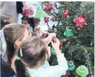
Die Kinder hängten selbstgefertigte Sterne und Mini-Tannenbäumchen in die Zweige.