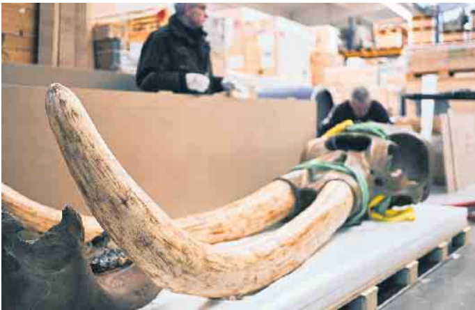
Das Amerikanische Mastodon war eine Art der Rüsseltiere aus der ausgestorbenen Gattung Mammut. Der Transport der kostbaren Zähne stellt auch für spezialisierte Kunstlogistiker eine Herausforderung dar.