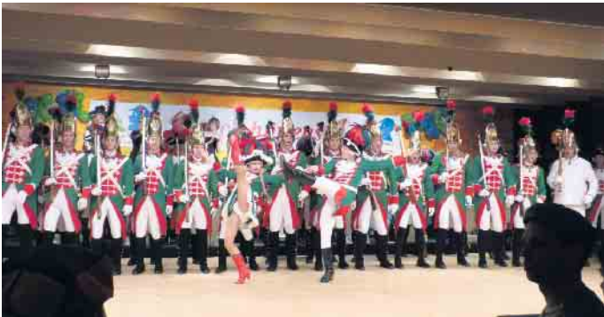
Die „Altstädter“ sind nach 10 Jahren wieder mit dabei!