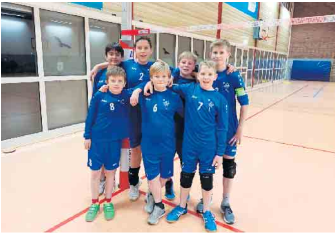
TVW Faustballer der neu formierten U14

dritte Begegnung mit dem Leichlinger TV begann sehr durchwachsen. Einem Rückstand hinterherlaufend mahnten die Trainer von der Seitenlinie, die Ruhe zu bewahren und zum soliden Abwehr- und Aufbauspiel zurückzufinden. Es brauchte jedoch eine Auszeit mit weiteren Hinweisen, um den ersten Satz zu drehen (11:8). Den zweiten Satz spielte das Team dann recht routiniert zu Ende (11:6). Die Wahlscheider Jungs zeigten tolle Spielzüge sowie einen guten Zusammenhalt und Teamgeist. Auch, dass sich das Team im Spiel gg. den LTV von einem Rückstand nicht aus der Ruhe bringen ließ, begeisterte Trainer und mitgereiste Eltern. Nicht zuletzt die drei Debütanten machten ihre