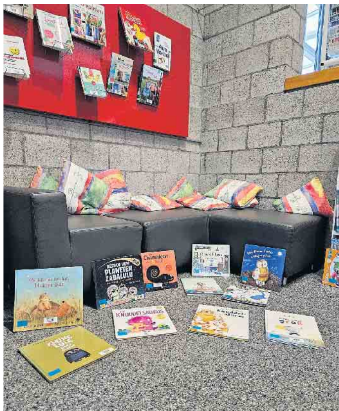
Das ist nur eine kleine Auswahl an Bilderbüchern in der Stadtbibliothek. Hier ist für alle etwas dabei!

dienstags 14 bis 18 Uhr donnerstags 10 bis 18 Uhr