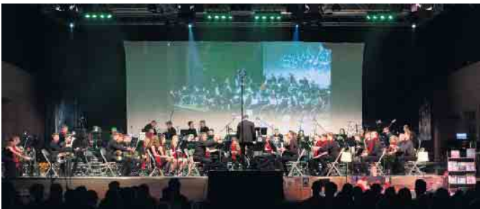
Das Sinfonische Blasorchester (SBO)