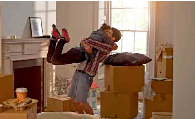
Vorfreude pur: Nach dem Umzug beginnt ein neuer Lebensabschnitt. Damit man sich so glücklich in die Arme fallen kann, ist allerdings vorher viel Planung und Organisation nötig.

Einer aktuellen Studie zufolge ziehen jedes Jahr etwa 8,5 Millionen Menschen in Deutschland um - und damit über 23.000 am Tag. Wenn man eine neue Wohnung gefunden hat, ist die Vorfreude meistens groß: Ein neuer Lebensabschnitt beginnt. Vorher steht jedoch der Umzug an, er erfordert eine Menge Planung und Organisation, um sicherzustellen, dass alles reibungslos verläuft. Oft gibt es zudem einen engen Zeitplan, um aus einer alten Wohnung ausziehen und in eine neue einzuziehen. Hier ist im Überblick ein grober zeitlicher Plan, an dem sich viele orientieren können: Einige Monate vor dem Umzug: alten Mietvertrag kündigen, Renovierung planen, Stromanbieter wählen Erst wenn man den neuen Mietvertrag von beiden Parteien unterschrieben in der Tasche hat, sollte man den alten Mietvertrag kündigen. Mieterinnen und Mieter können in aller Regel mit einer Kündigungsfrist von drei Monaten kündigen - und zwar unabhängig davon, wie lange sie in der Wohnung wohnen. Die Kündigung sollte bis spätestens zum dritten Werktag eines Monats erfolgen, damit dieser noch zur Frist zählt. Eventuelle Renovierungsarbeiten - oft in der alten und neuen Wohnung - sollten rechtzeitig eingeplant werden. Bereits vor dem Umzug kann man auch den Strom ummelden und gegebenenfalls