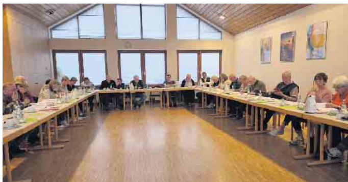
Motivierte „Schüler“.