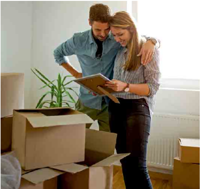
Das Pärchen zählt zu den etwa 8,5 Millionen Menschen in Deutschland, die pro Jahr umziehen. Soll der Umzug reibungslos vonstatten gehen, will er gut geplant und organisiert sein.

den Stromanbieter wechseln. Mit dem Bezug von Ökostrom etwa lässt sich ein wichtiger Beitrag zum Umweltschutz leisten. Bei LichtBlick beispielsweise stammt der Ökostrom komplett aus regenerativen Quellen, die CO 2 -Emissionen liegen bei null, mehr Infos gibt es unter www.lichtblick.de . Ein Monat vor dem Umzug: Umzugsplanung einleiten Spätestens vier Wochen vor dem Umzug geht es an die konkrete Planung des „großen Tages“: Das Umzugsunternehmen muss beauftragt werden - oder man schafft es, genügend Helferinnen und Helfer aus dem Familien-, Freundes- oder Bekanntenkreis zu organisieren. Damit der Umzug reibungslos vonstattengeht, sind ausreichend Umzugskartons und Verpackungsmaterial zu beschaffen. Ein bis zwei Wochen vor dem Umzug: konkrete Umzugsplanung Der zeitliche Aufwand für die Vorbereitung des Umzugs darf nicht unterschätzt werden. Umzugskisten sind zu packen und mit vorgeesehenem Zimmer zu beschriften. Möbel müssen abgebaut und die Renovierungsarbeiten in beiden Wohnungen abgeschlossen werden. Gegebenenfalls sind Schilder für Halteverbotszonen zu organisieren und rechtzeitig aufzustellen. Nach dem Umzug: Meldepflichten und Versicherungen Innerhalb von 14 Tagen nach dem