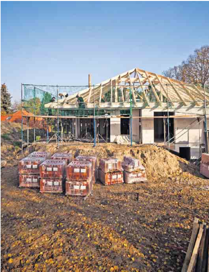
Für die Zahlungspläne zum Hausbau gibt es klare gesetzliche Regeln. Doch Vorsicht: Nicht alle Unternehmen halten sie ein.

sen. Er kann auch den Fortschritt während der Bauphase im Auge behalten, damit Zahlungen und erbrachte Leistungen zusammenpassen. Als Richtwert nennt Stange, dass bis zur Fertigstellung des Rohbaus nicht mehr als 50 Prozent der gesamten Bausumme geleistet werden sollten. Unter www.bsb-ev.de gibt es weitere Infos zum Bauen und einen kostenlosen Ratgeber „Hausneubau“. Verbraucher haben Anspruch auf Fertigstellungssicherheit Als zusätzliche Sicherheit haben Bauherren einen gesetzlichen Anspruch auf eine Fertigstellungssicherheit. Sie beträgt fünf Prozent der Bausumme und dient als Absicherung für die Fertigstellung des Bauwerks ohne wesentliche Mängel. Der Bauherr kann sie von der ersten Abschlagszahlung einbehalten, alternativ übergibt der Vertragspartner eine Bankbürgschaft oder eine Fertigstellungsversicherung. Diese Sicherungsfunktion greift auch, wenn die Gesamtvergütung durch nachträgliche Bauaufträge um zehn Prozent oder mehr ansteigt. Hier kann der Auftraggeber beim nächsten Abschlag fünf Prozent der Mehrkosten einbehalten. (djd)