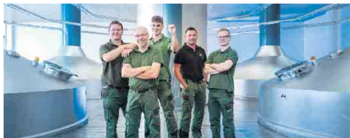
Ein traditionsreicher Beruf setzt heute auf fortschrittliche Technik: Das macht den Reiz der Tätigkeit des Brauers und Mälzers aus.

Entweichen der Kohlensäure zu verhindern, aber auch um im Fassinneren eine geschmackliche Veränderung durch den Kontakt zwischen Bier und Holz zu vermeiden, mussten Küfer die Holzfässer mit flüssigem und extrem heißem Pech auskleiden. War die dünne Schicht beschädigt, musste mühsam eine neue aufgetragen werden. (djd)