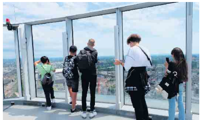
Kinder aus der Ukraine - Ein Ausflug nach Köln.

Anmeldung erforderlich unter: info@wahlscheid.de oder Telefon: 0176 74546206. Bitte dann auch angeben, ob der Fahrdienst genutzt wird.