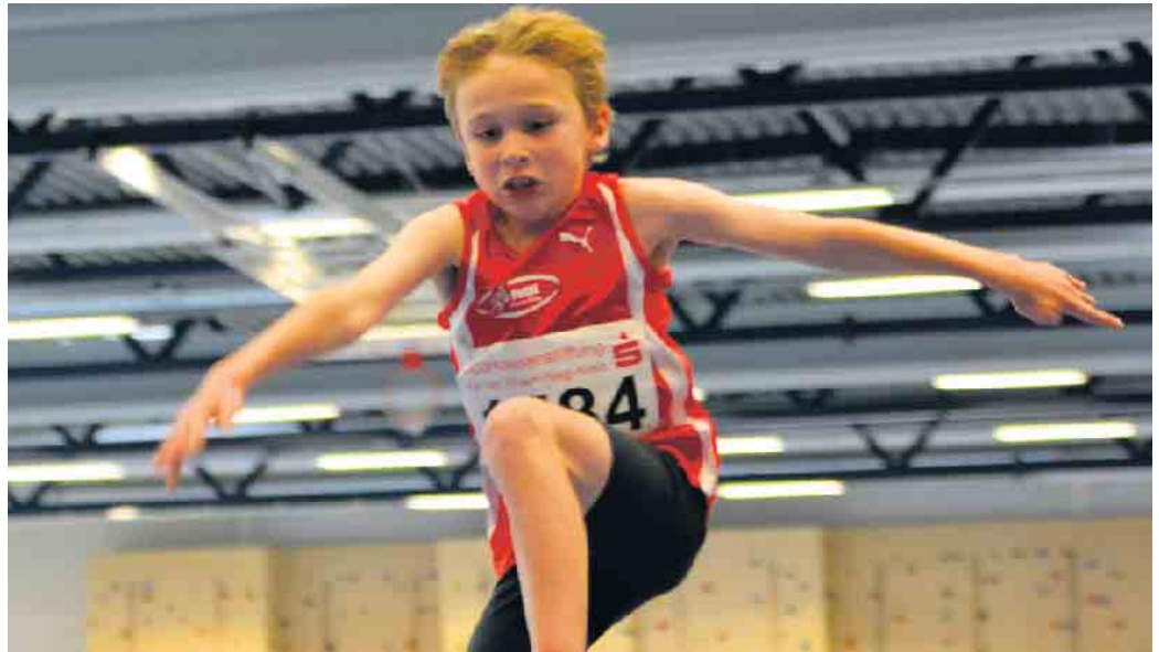
Weitsprung macht Spaß

Die zuständigen Trainer sind Lena Bastin und Aaron Allenberg. Für ein Probetraining oder weitere Infos können sich alle