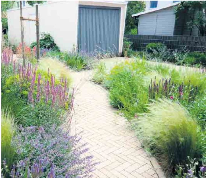
Eine sehr gelungene, artenreiche und harmonische Komposition verschiedenster Stauden.